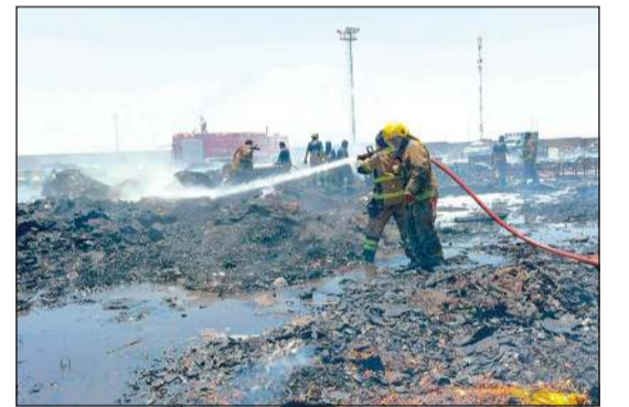
رجال الإطفاء يخمدون حريق ميناء عبدالله

تمكن رجال مركزي ميناء عبدالله وأم الهيمان من السيطرة على حريق مهملات في مصنع لتدوير النفايات في منطقة ميناء عبدالله. وقالت قوة الإطفاء في بيان لها إن الحادث لم يسفر عن أي إصابات تذكر.