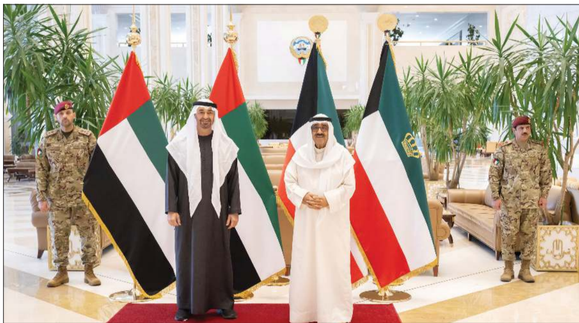
صاحب السمو الأمير الشيخ مشعل الأحمد خلال اللقاء مع صاحب السمو الشيخ محمد بن زايد رئيس دولة الإمارات العربية المتحدة

سموه على أرض المطار أخوه صاحب السمو الأمير الشيخ مشعل الأحمد، وسمو ولي العهد الشيخ صباح الخالد. كما كان في استقبال سموه رئيس مجلس الوزراء سمو الشيخ أحمد العبدالله، والنائب الأول لرئيس مجلس الوزراء وزير الداخلية الشيخ فهد اليوسف، ووزير شؤون الديوان الأميري الشيخ حمد جابر العلي، هذا، ورافق سموه وفد يضم سمو الشيخ منصور بن زايد آل نهيان نائب رئيس الدولة نائب رئيس مجلس الوزراء رئيس ديوان الرئاسة، والفريق سمو الشيخ سيف بن زايد آل نهيان نائب رئيس مجلس الوزراء وزير الداخلية، وسمو الشيخ حمدان بن محمد بن زايد آل نهيان نائب رئيس ديوان الرئاسة للشؤون الخاصة، والشيخ محمد بن حمد بن طحون آل نهيان مستشار صاحب السمو رئيس الدولة وعدد من كبار المسؤولين في دولة الإمارات العربية المتحدة الشقيقة.