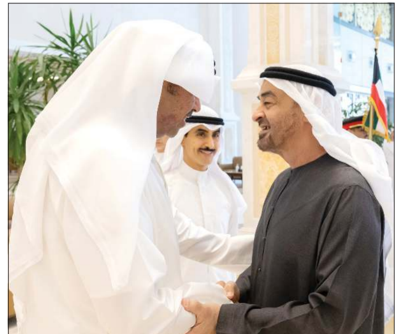
صاحب السمو الشيخ محمد بن زايد رئيس دولة الإمارات مصافحاً وزير الدفاع الشيخ عبدالله العلي