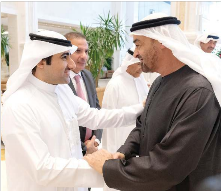
صاحب السمو الشيخ محمد بن زايد رئيس دولة الإمارات مصافحاً وكيل الديوان الأميري الشيخ عبدالعزيز مشعل المبارك