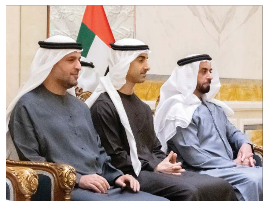
الفريق سمو الشيخ سيف بن زايد نائب رئيس مجلس الوزراء وزير الداخلية وسمو الشيخ حمدان بن محمد بن زايد نائب رئيس ديوان الرئاسة للشؤون الخاصة والشيخ محمد بن حمد بن طحون مستشار صاحب السمو رئيس الدولة