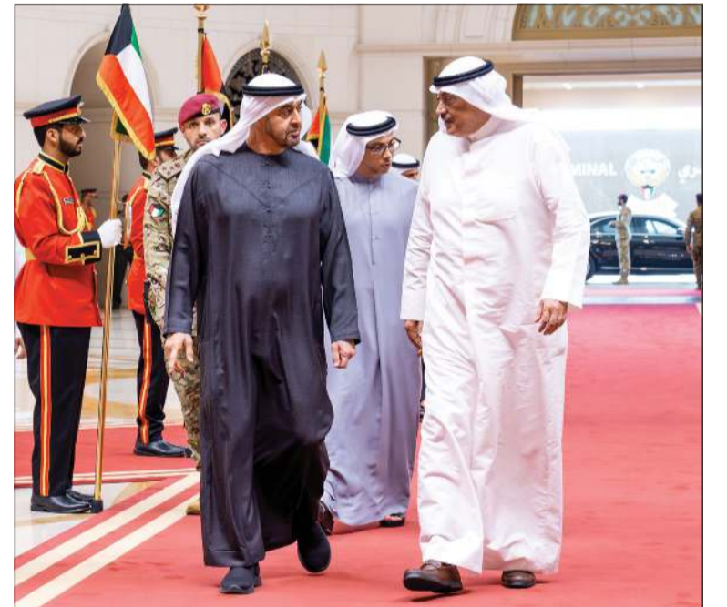
سمو ولي العهد صباح الخالد مودعا صاحب السمو الشيخ محمد بن زايد رئيس دولة الإمارات العربية المتحدة لدى مغادرته البلاد بحضور سمو الشيخ منصور بن زايد نائب رئيس الدولة نائب رئيس مجلس الوزراء رئيس ديوان الرئاسة