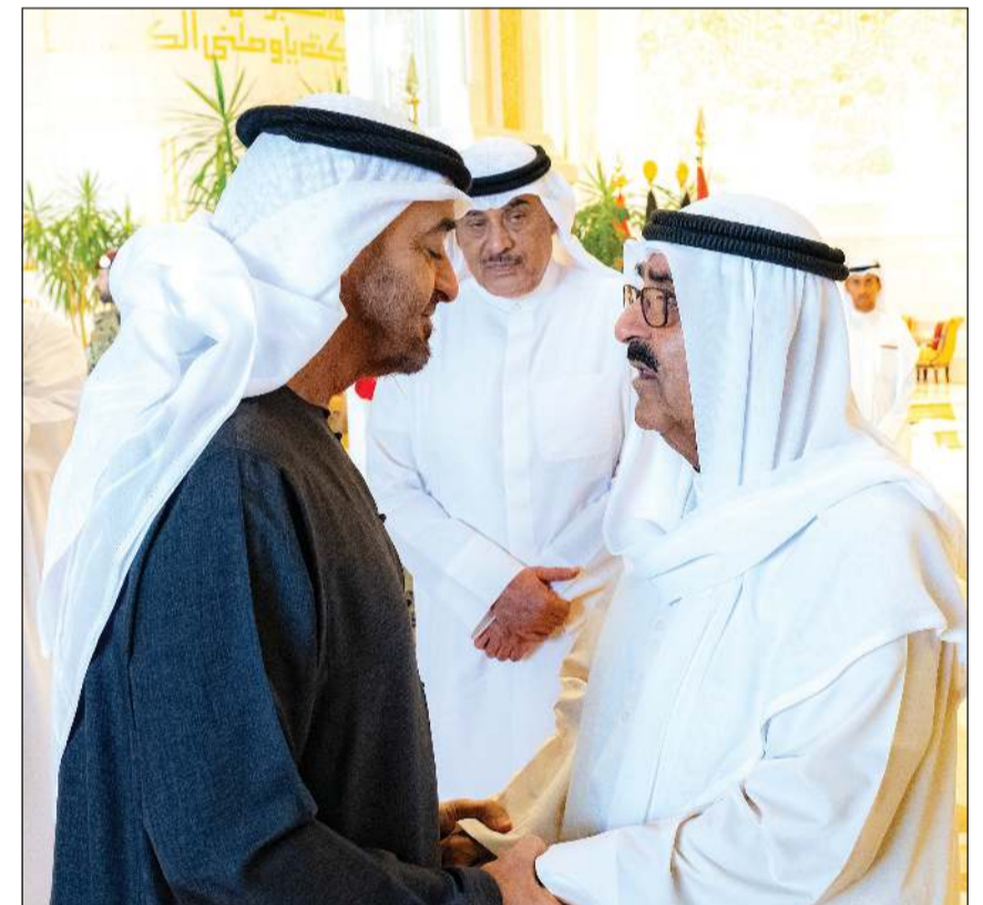
صاحب السمو الأمير الشيخ مشعل الأحمد مرحباً بصاحب السمو الشيخ محمد بن زايد رئيس دولة الإمارات العربية المتحدة بحضور سمو ولي العهد الشيخ صباح الخالد

ومن الجانب الإماراتي سمو الشيخ منصور بن زايد آل نهيان نائب رئيس الدولة نائب رئيس مجلس الوزراء رئيس ديوان الرئاسة، والفريق سمو الشيخ سيف بن زايد آل نهيان نائب رئيس مجلس الوزراء وزير الداخلية، وسمو الشيخ حمدان بن محمد بن زايد آل نهيان نائب رئيس ديوان الرئاسة للشؤون الخاصة، والشيخ محمد بن حمد بن طحون آل نهيان مستشار صاحب السمو رئيس الدولة وعدد من كبار المسؤولين في دولة الإمارات العربية المتحدة الشقيقة وسفيرا البلدين. وأقام صاحب السمو الأمير الشيخ مشعل الأحمد مأدبة غداء على شرف أخيه صاحب السمو الشيخ محمد