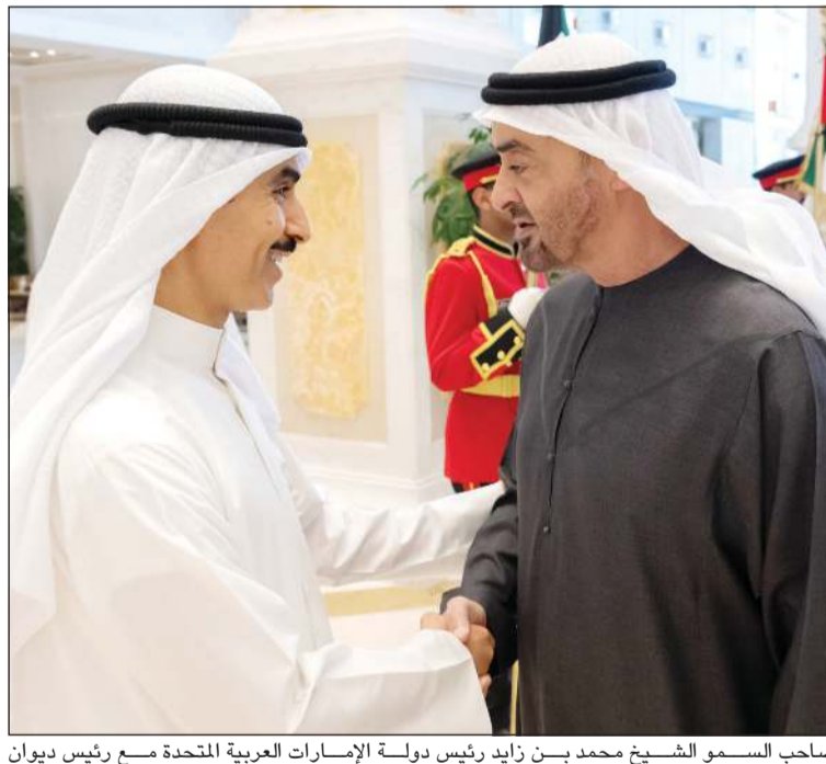
صاحب السمو الشيخ محمد بن زايد رئيس دولة الإمارات العربية المتحدة مع رئيس ديوان سمو ولي العهد الشيخ ثامر الجابر