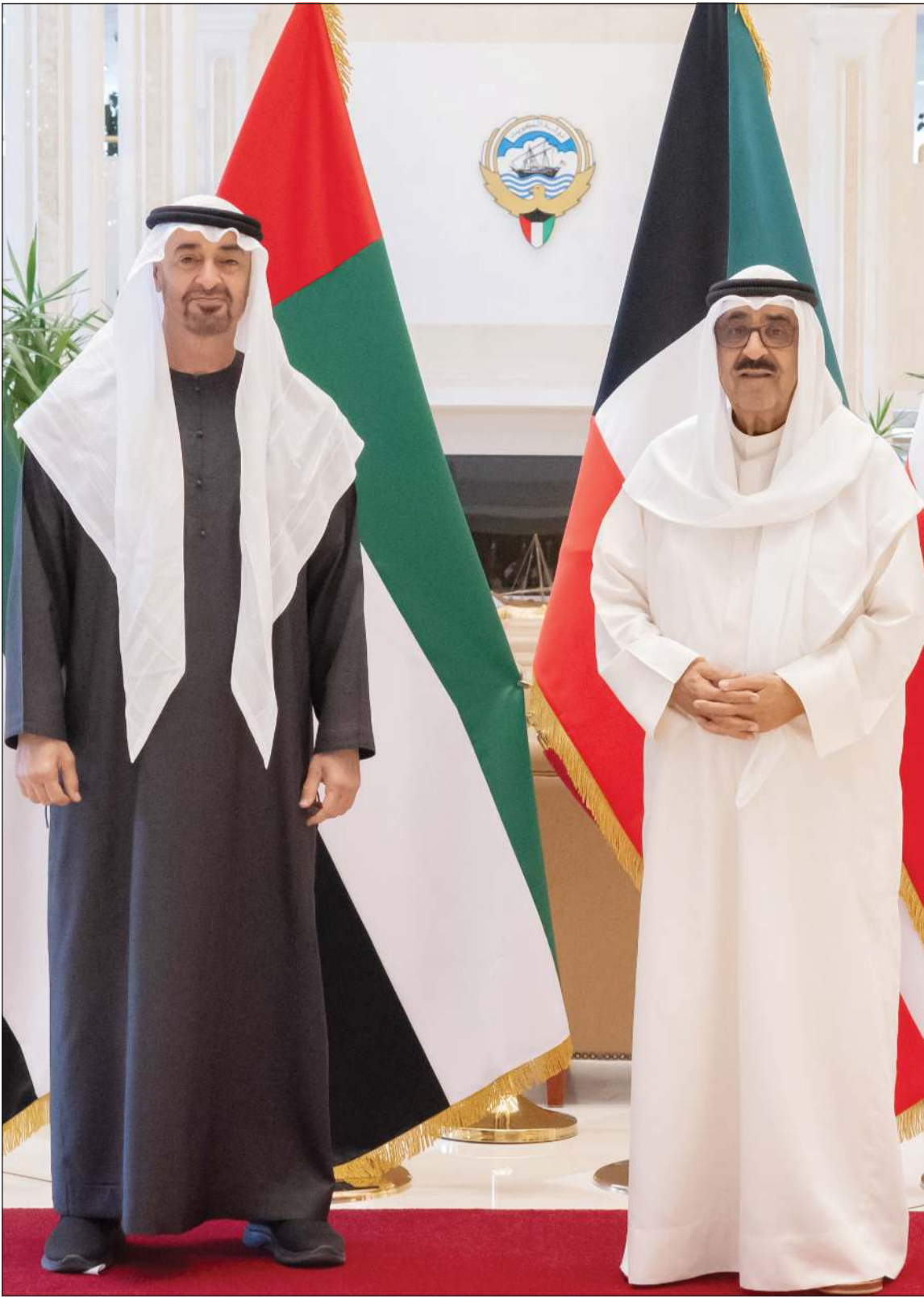
صاحب السمو الأمير الشيخ مشعل الأحمد وصاحب السمو الشيخ محمد بن زايد رئيس دولة الإمارات العربية المتحدة