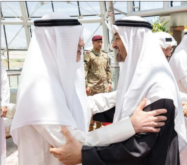
صاحب السمو الشيخ محمد بن زايد رئيس دولة الإمارات لدى استقبله من قبل النائب الأول لرئيس الوزراء ووزير الداخلية الشيخ فهد اليوسف