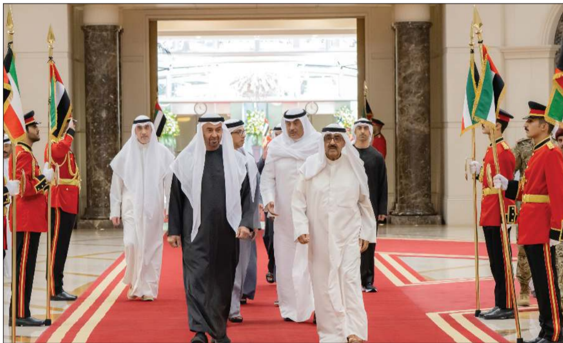
صاحب السمو الأمير الشيخ مشعل الأحمد خلال استقبال صاحب السمو الشيخ محمد بن زايد رئيس دولة الإمارات العربية المتحدة بحضور سمو ولي العهد الشيخ صباح الخالد وسمو الشيخ منصور بن زايد نائب رئيس الدولة نائب رئيس مجلس الوزراء رئيس ديوان الرئاسة والنائب الأول لرئيس الوزراء وزير الداخلية الشيخ فهد اليوسف