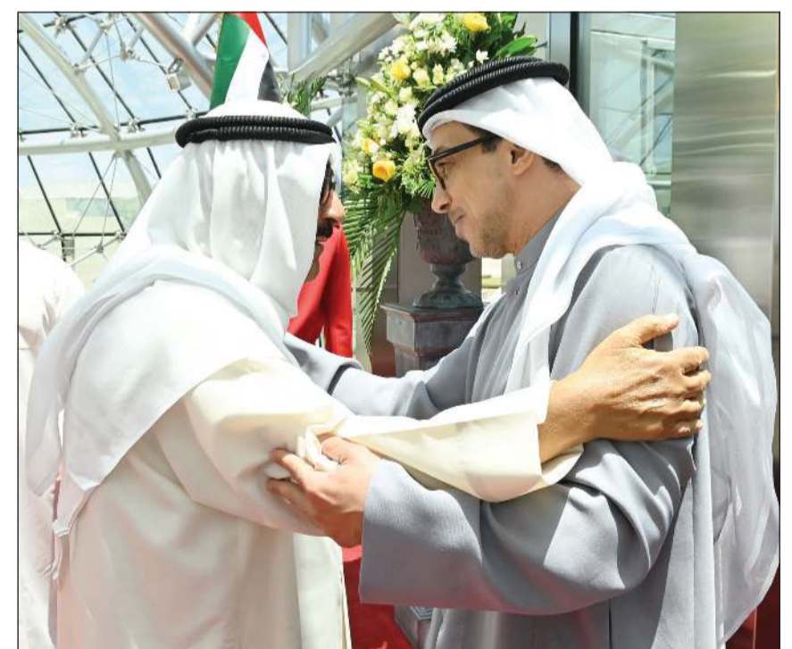
صاحب السمو الأمير الشيخ مشعل الأحمد مصافحاً سمو الشيخ منصور بن زايد نائب رئيس الدولة نائب رئيس مجلس الوزراء رئيس ديوان الرئاسة