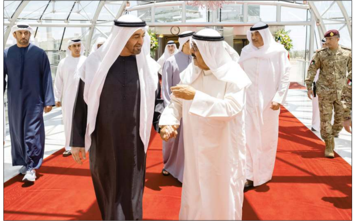
صاحب السمو الأمير الشيخ مشعل الأحمد في استقبال صاحب السمو الشيخ محمد بن زايد رئيس دولة الإمارات العربية المتحدة لدى وصوله إلى البلاد بحضور سمو ولي العهد الشيخ صباح الخالد وسمو الشيخ منصور بن زايد نائب رئيس الدولة نائب رئيس مجلس الوزراء رئيس ديوان الرئاسة