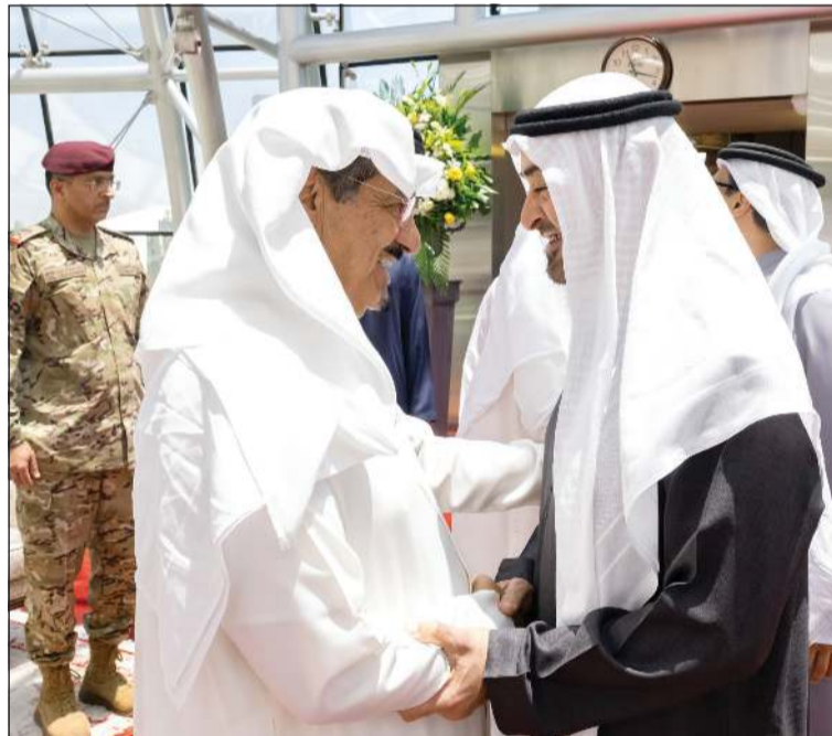
صاحب السمو الشيخ محمد بن زايد رئيس دولة الإمارات العربية المتحدة لدى وصوله إلى البلاد وفي استقباله رئيس الوزراء سمو الشيخ أحمد عبدالله