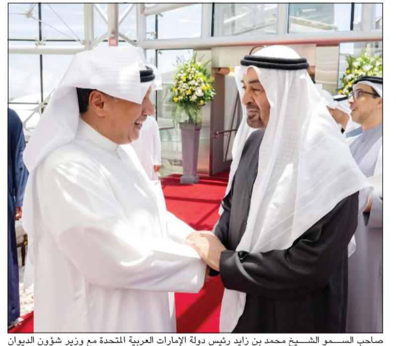
صاحب السمو الشيخ محمد بن زايد رئيس دولة الإمارات العربية المتحدة مع وزير شؤون الديوان الأميري الشيخ حمد جابر العلي