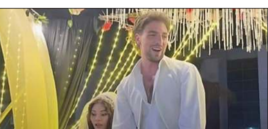
من حملة الترويج لأغنية

الشوارع وسط بهجة المارة بينما كانت تعلق أصوات أنوار السيارات بجانب السيارة التي نصبت عليها «كوشة زفاف» جلس فيها كل من هيفاء و«سانت ليفانت»، كما لو كانا عروسين في زفاف شعبي مصري.