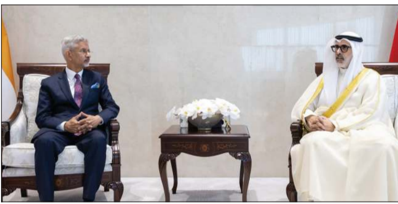
وزير الخارجية الشيخ جراح الجابر مستقبلاً وزير خارجية الهند. د.سوبراهمانيام جايشانكار

شمولا، كما بحث الجانبان الإقليمي والدولية. وأقام غداء على شرف د.جايشانكار آخر التطورات على الساحتين الإقليمية والدولية. والوفد المرافق له.