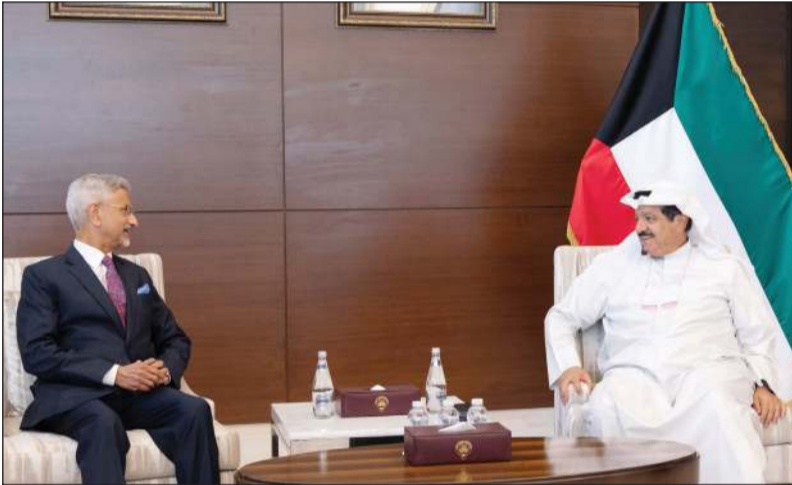
رئيس الوزراء سمو الشيخ أحمد عبدالله خلال استقباله وزير الشؤون الخارجية في الهند د.سوبراهمانيام جايشانكار