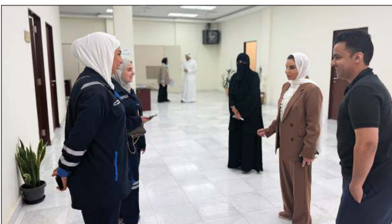
وزيرة الشؤون الاجتماعية وشؤون الأسرة والطفولة د.أمثال الحويلة خلال زيارتها إلى المجلس الأعلى لشؤون الأسرة

إضافة إلى ربط المراكز التابعة للمجلس إلكترونياً بما يسهم في تطوير العمل الإداري والمالي ورفع كفاءة المتابعة والرقابة.