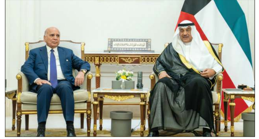
سمو ولي العهد الشيخ صباح الخالد خلال استقباله وزير خارجية العراق د.فؤاد محمد حسين

هنا، وقد رحب سموه به وبالوفد المرافق له في مستهل اللقاء متمنيا سموه لهم التوفيق والنجاح خلال هذه الزيارة. حضر اللقاء رئيس ديوان سمو ولي العهد الشيخ ثامر الجابر ووزير الخارجية الشيخ جراح الجابر والمسؤولين.