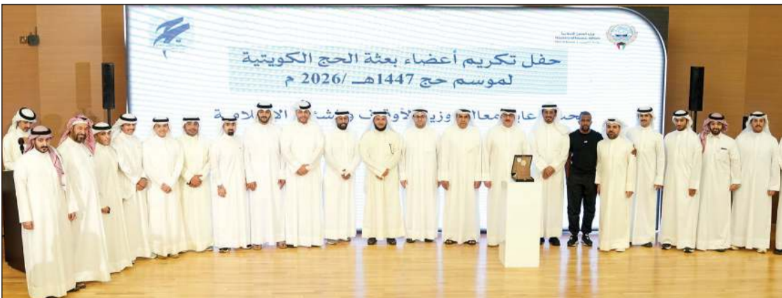
وكيل وزارة الشؤون الإسلامية بالكليف سليمان السويلم متوسطا المكرمين

الاستجابة ورفع كفاءة الأداء وساهم في الارتقاء بجودة الخدمات المقدمة لضيوف الرحمن. وشدد على مواصلة البناء على ما تحقق من نجاحات وتطوير منظومة العمل في مواسم الحج المقبلة والاستفادة من التجارب الميدانية والمقترحات التي تقدمها اللجان العاملة بما يتواءم مع متطلبات الدولة في التحول الرقمي والارتقاء بالخدمات وتحقيق أفضل مستويات الرعاية لحجاج دولة الكويت.