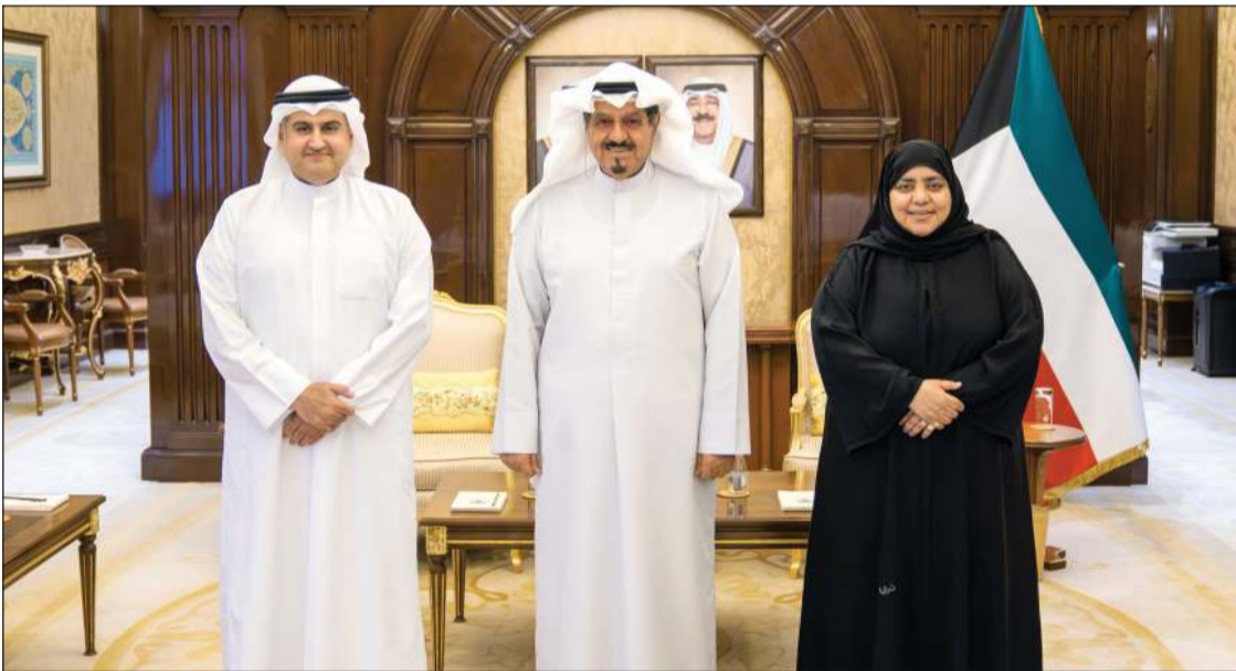
رئيس مجلس الوزراء سمو الشيخ أحمد العبدالله مستقبلاً وزير العدل المستشار ناصر السميح ووكيلة الوزارة عواطف السند

ببرقية تهنئة إلى الرئيس البروفيسور آرثر بيتر موثاريكا رئيس جمهورية ملاوي الصديقة بمناسبة ذكرى الاستقلال لبلادها. كما بعث سمو الشيخ أحمد العبدالله رئيس مجلس الوزراء ببرقية تهنئة إلى الرئيس عثمان غزالي رئيس جمهورية القمر المتحدة الشقيقة بمناسبة ذكرى الاستقلال لبلادها.