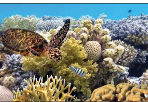
الحيد المرجاني العظيم

سيدني - أ.ف.ب: أقلت الحيد المرجاني العظيم في أستراليا من إدراجه بقائمة منظمة الأمم المتحدة للتربية والعلم والثقافة «اليونسكو» للتراث العالمي المعرض للخطر، مع أن المنظمة أبدت الجمعة «قلقاً بالغاً» بشأن مستقبل الحيد الذي يتميز بتنوعه البيولوجي. وقالت اليونسكو في تقريرها الأولي «رغم أن الحيد المرجاني لا يزال يظهر قدرة واضحة على الصمود، إلا أن قدرته على تحمل مثل هذه الظواهر والتعافي منها تتراجع بشكل متزايد، وهو ما يثير قلقاً كبيراً». وتراقب اليونسكو الحيد المرجاني منذ عام 2021، بعدما حذرت آنذاك من أن هذا الحاجز الممتد على 2300 كيلومتر، والذي يعد من أبرز الوجهات السياحية، قد يدرج على قائمة التراث العالمي المعرض للخطر. وأشارت المنظمة الأممية إلى أن أستراليا أحرزت تقدماً في مواجهة التغير المناخي، وتحسين جودة المياه، وتعزيز ممارسات الصيد المستدام، وتنظيف المخلفات التي قد تهدد الشعاب المرجانية. وأضاف العلماء خلال العام الفائت عن أكبر عملية أبيضاض على الإطلاق للشعاب المرجانية في الحيد المرجاني العظيم، نتيجة ارتفاع درجات حرارة المحيطات بشكل حاد عام 2024، ما أدى إلى تسجيل مستويات غير مسبوقة من الإجهاد الحراري منذ بدء تسجيل البيانات قبل نحو 40 عاماً. وعدلت أستراليا قانونها عام 2025 لتشديد القيود المفروضة على تدمير الغطاء النباتي الأصلي بالقرب من الحيد المرجاني.