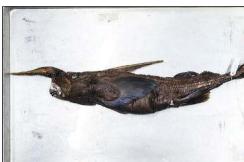
صورة لسمة القرش الشبح المكتشفة حديثاً في كوستاريكا

سان خوسيه - أ.ف.ب: أعلن علماء من كوستاريكا عن اكتشاف محتمل لنوع جديد من أسماك القرش الشبح في مياه المحيط الهادئ قرب كابو بلانكو وجزيرة كانيو. وقال أرتورو أنغولو سيباخا، أستاذ علم الأحياء في جامعة كوستاريكا، إن العينة المكتشفة تتميز بـ«خطم أقصر، ولون أكثر قتامة، وشوكة أطول بكثير على زعنفتها الظهرية»، مقارنة بالأنواع المعروفة. وأضاف أن هذا الاكتشاف يمثل النوع الوحيد المعروف حتى الآن من هذه الأسماك على سواحل أميركا الوسطى، مشيراً إلى أن التحليلات الجينية أظهرت أن النوع الجديد لا تربطه أي صلة تكاثرية بأنواع أسماك القرش الشبح الأخرى المعروفة. ورغم ذلك، أوضح أن عينات جمعت سابقاً قرب سواحل بيرو وتشيلي تشبه إلى حد كبير العينة المكتشفة في كوستاريكا، لذلك يواصل العلماء مقارنة العينات قبل تأكيد النتائج النهائية. واكتشفت ثلاثة أنواع أخرى من أسماك القرش الشبح في مياه قبالة جنوب إفريقيا وتايوان وأستراليا واليابان، وكذلك في المحيط الأطلسي بين غرينلاند والبرازيل. وتنتهي أسماك القرش الشبح إلى مجموعة من الأسماك الغضروفية تعرف باسم رينوكيميرا، وهي قريبة من أسماك القرش. هذا، ورجح سيباخا أن يكون النوع الجديد أوسع انتشاراً على طول سواحل المحيط الهادئ في أميركا الوسطى وأميركا الجنوبية.