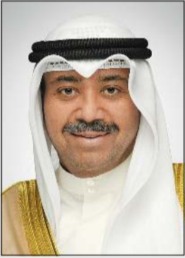
الشيخ عبدالله العلي

كونا: بعث وزير الدفاع الشيخ عبدالله العلي ببرقية تهنئة إلى وزير الحرب بالولايات المتحدة الأمريكية الصديقة بيت هيفيسيت بمناسبة الذكرى الـ 250 لاستقلال بلاده، وفق ما ذكرت وزارة الدفاع.