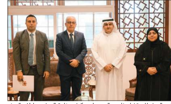
وزير العدل المستشار ناصر السميح ووكيل وزارة العدل عواطف السند مع سفير المملكة المغربية علي ابن عيسى

العلاقات الثنائية بين دولة الكويت وكل من المملكة المغربية وجمهورية الصين الشعبية. وأكد المستشار السميح وفق البيان حرص وزارة العدل على مواصلة تعزيز التعاون مع الدول الشقيقة والصديقة وترسيخ أطر الشراكة في المجالات العدلية والقانونية بما ينسجم مع توجهات دولة الكويت في دعم التعاون الدولي وتعزيز مبادئ العدالة وسيادة القانون. حضرت اللقاءين وكيلة وزارة العدل عواطف السند.