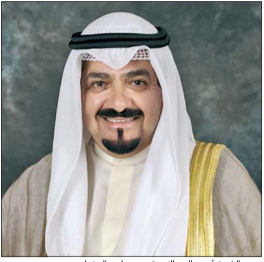
سمو الشيخ أحمد عبدالله رئيس مجلس الوزراء

كونا: بعث سمو الشيخ أحمد عبدالله رئيس مجلس الوزراء ببرقية تهنئة إلى الرئيس دونالد ترامب رئيس الولايات المتحدة الأمريكية الصديقة، ضمنها سموه خالص تهنائه بمناسبة الذكرى المائتين والخمسين لإعلان استقلال الولايات المتحدة الأمريكية الصديقة.