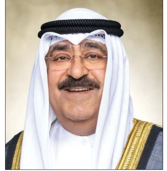
صاحب السمو الأمير الشيخ مشعل الأحمد

كونا: بعث صاحب السمو الأمير الشيخ مشعل الأحمد ببرقية تهنئة إلى الرئيس دونالد ترامب رئيس الولايات المتحدة الأمريكية الصديقة، عبر فيها سموه عن خالص تهنائه بمناسبة الذكرى المائتين والخمسين لإعلان استقلال الولايات المتحدة الأمريكية الصديقة، مشيدا سموه بالعلاقات التاريخية والإستراتيجية الراسخة التي تجمع دولة الكويت والولايات المتحدة الأمريكية الصديقة، مؤكدا سموه الحرص الدائم والمشارك لتعزير أواصر هذه العلاقات والارتقاء بأطر التعاون القائم بين البلدين الصديقين في مختلف المجالات إلى آفاق أرحب وبما يخدم مصالحهما المشتركة، متمنيا سموه للرئيس ترامب موفور الصحة والعافية وللولايات المتحدة الأمريكية وشعبها الصديق كل التقدم والأزدهار. كما بعث صاحب السمو الأمير الشيخ مشعل الأحمد ببرقية تهنئة إلى الرئيس ألكسندر لوكاشينكو رئيس جمهورية بيلاروسيا الصديقة، عبر فيها سموه عن خالص تهنائه بمناسبة ذكرى الاستقلال لبلاده، متمنيا سموه له موفور الصحة والعافية ولجمهورية بيلاروسيا وشعبها الصديق كل التقدم والأزدهار.