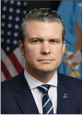
وزير الحرب الأميركي بيت هيفيسيت