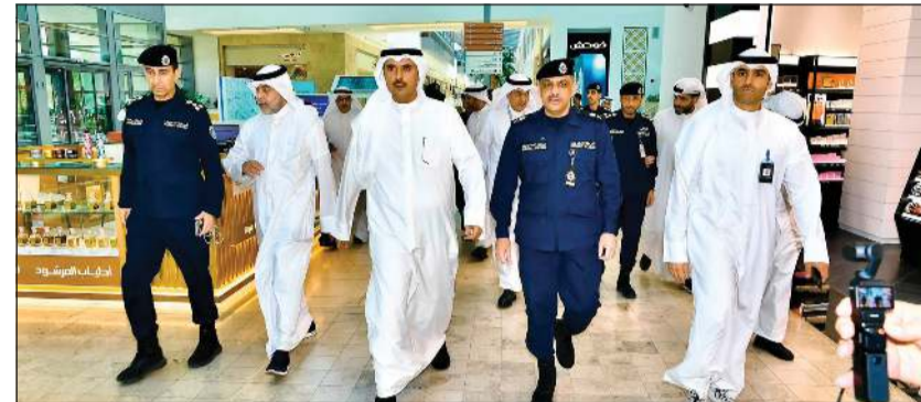
محافظ الأحمدى الشيخ حمود الجابر ووكيل وزارة الداخلية اللواء عبدالوهاب الوهيب والعميد فواز الرومي خلال الافتتاح

افتتح محافظ الأحمدى الشيخ حمود جابر الأحمد ووكيل وزارة الداخلية اللواء عبدالوهاب الوهيب، صباح أمس مركز خدمة المواطن في الخيران مول، بحضور الوكيل المساعد لشؤون الخدمات الأمنية المساندة بالإنابة العميد فواز الرومي، ومدير عام الإدارة العامة لمراكز الخدمة العميد سعود التويجري، وذلك ضمن خطة وزارة الداخلية الرامية إلى