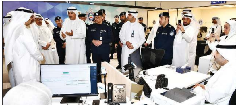
محافظ الأحمدى الشيخ حمود الجابر ومحمد الجابر متحدًا للموظفين في مركز خدمة الخيران مول