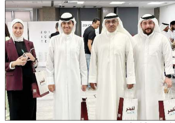
جانب من فعاليات «كسرة روتين»

في إطار سعيه المستمر لتعزيز بيئة العمل الإيجابية ودعم رفاه موظفيه، يواصل بنك الخليج تنظيم الفعاليات الشهرية لمبادرة «كسرة روتين»، التي تهدف إلى كسر الجمود اليومي وإضفاء روح جديدة على أجواء العمل بين الموظفين. وتأتي هذه المبادرة ضمن جهود البنك الرامية إلى دعم موظفيه ليس فقط على المستوى المهني، بل أيضا على المستوى الشخصي والاجتماعي، بما يعكس إجابا على أدائهم وإنتاجيتهم.