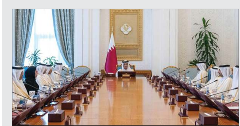
الشيخ محمد بن عبد الرحمن بن جاسم آل ثاني رئيس مجلس الوزراء وزير الخارجية مترئسا الاجتماع العادي لمجلس الوزراء

المبعوثان الأميركيان يؤكدان التزام واشنطن بمواصلة المسار التفاوضي وتعزيز الجهود الدبلوماسية الهادفة إلى التوصل لاتفاق شامل