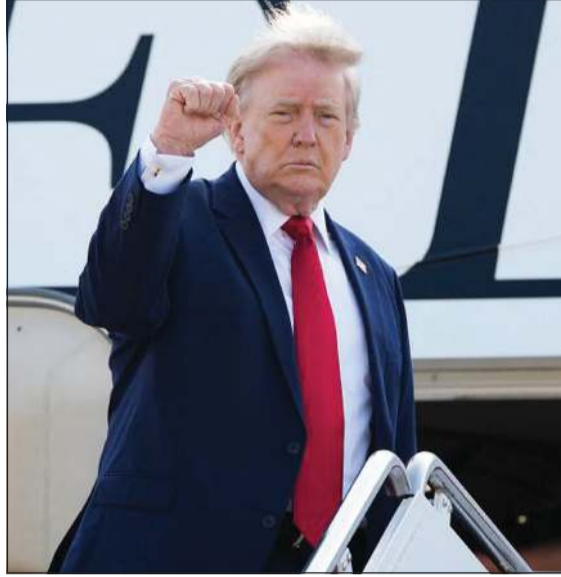
الرئيس الأميركي دونالد ترامب خلال توجهه إلى ولاية نورث داكوتا لحضور تدشين مكتبة ثيودور روزفلت الرئاسية