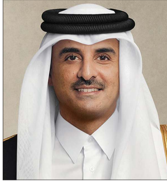
صاحب السمو الشيخ تميم بن حمد أمير دولة قطر

عواصم - وكالات: أكد الرئيس الأميركي دونالد ترامب أن «المحادثات مع إيران تسير بشكل جيد جدا»، في وقت استقبل صاحب السمو الشيخ تميم بن حمد آل ثاني أمير دولة قطر المبعوثين الأميركيين ستيف ويتكوف وجاريد كوشنر.