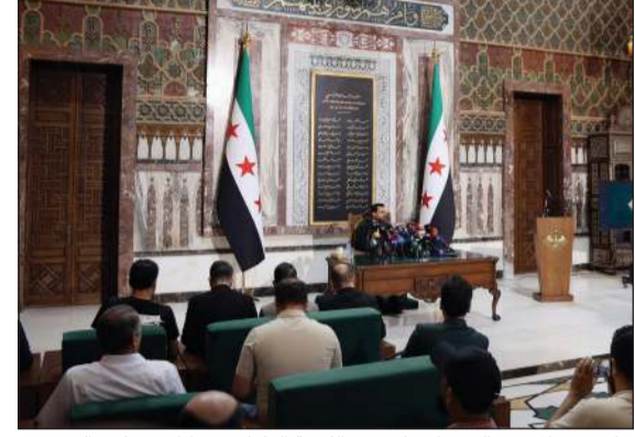
جانب من المؤتمر الصحفي لرئيس اللجنة العليا لانتخابات مجلس الشعب محمد طه الأحمد (ساعات)

وكالات: أعلنت اللجنة العليا لانتخابات مجلس الشعب أمس أسماء قائمة الثلث البالغه 70 عضواً المهيئة من قبل الرئيس أحمد الشرع، وفقاً للإعلان الدستوري، ليستكمل المجلس أعضائه باستثناء محافظة السويداء التي لم تجر فيها الانتخابات.