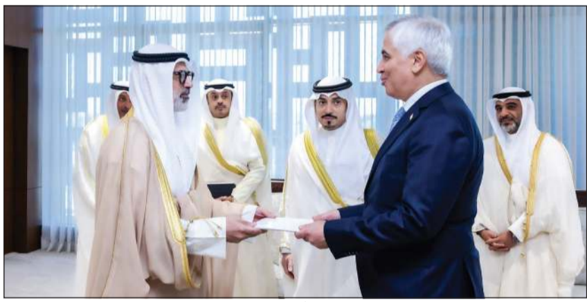
وزير الخارجية الشيخ جراح الجابر يتسلم نسخة من أوراق اعتماد سفير طاجيكستان خسرو ناظري

كوونا: تسلم وزير الخارجية الشيخ جراح الجابر نسخة من أوراق اعتماد سفير جمهورية طاجيكستان لدى دولة الكويت خسرو ناظري، وذلك خلال اللقاء الذي تم في ديوان عام الوزارة.