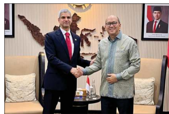
سفيرنا لدى إندونيسيا خالد الياسين مع وزير الاستثمار والصناعات التحويلية والرئيس التنفيذي لوكالة إدارة الاستثمار (داناانتارا) الإندونيسي روسان روسلاني

كوالالمبور - كوونا: بحث سفيرنا لدى إندونيسيا خالد الياسين مع مسؤولين إندونيسيين سبل تعزيز التعاون الاقتصادي والاستثماري بين البلدين والقضايا ذات الاهتمام المشترك.