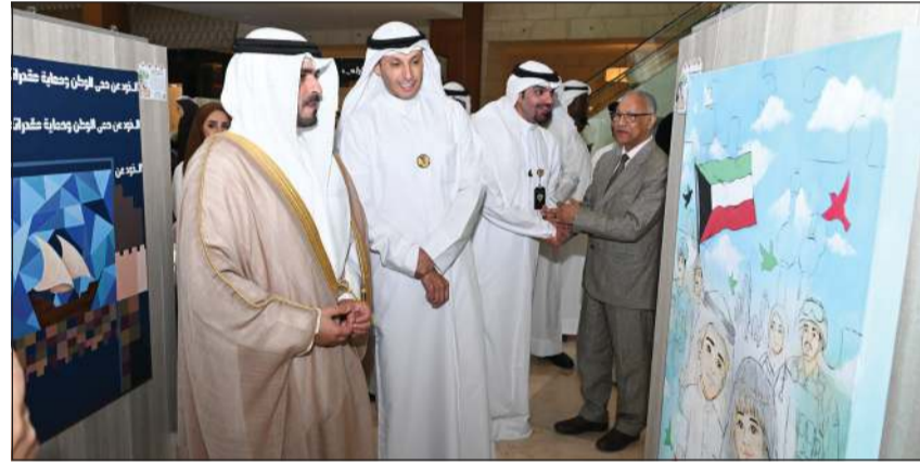
محافظ مبارك الكبير ومحافظ حولي بالتكليف الشيخ صباح بدر الصباح يطلع على إحدى اللوحات في المعرض بحضور الوكيل المساعد للشؤون التعليمية بوزارة التربية م. حمد الحمد (ريليش كومار)