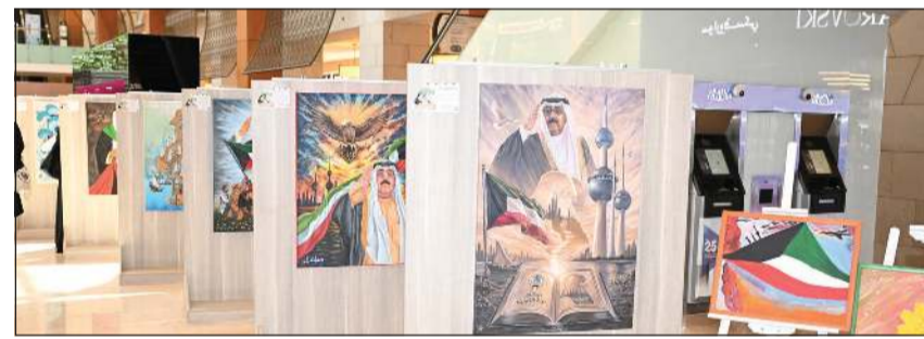
جانب من اللوحات الفنية في معرض «قال أبونا مشعل»

وأشار بالجهود المبذولة من وزارة التربية للمساهمة في هذا العمل الوطني ممثلة بقسم التوجيه الفني للتربية الفنية بمنطقة مبارك الكبير وحولي التعليميتين على المساهمة بأعمال تدل على حب الكويت