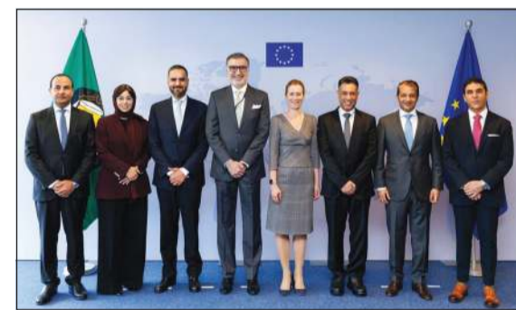
المظلة العليا للشؤون الخارجية والسياسة الأمنية في الاتحاد الأوروبي كايا كالاس خلال اللقاء مع سفيراء دول مجلس التعاون الخليجي

كما أكدت كالاس تمسك الاتحاد الأوروبي بموقفه الرافض لفرض أي رسوم أو إجراءات مستحدثة على حركة الملاحة في مضيق هرمز، مشددة على أهمية الحفاظ على انسدادية التجارة العالمية وأمن الممرات البحرية.