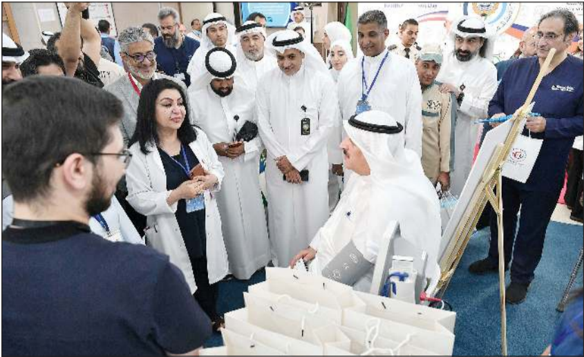
وزير الصحة د.أحمد العوضي خلال قياس ضغط الدم في فعاليات اليوم التوعوي

ضرورة تعزيز التواصل المباشر بين مختلف الكوادر الطبية وأفراد المجتمع