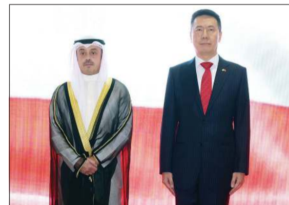
مساعداً وزير الخارجية لشؤون آسيا نواف عبداللطيف الأحمد وسفير الصين يانغ شين خلال الاحتفال

في مجالات الثورة والبناء والإصلاح، مشيرا إلى أن الصين تواصل المضي في مسار بناء دولة قوية وتحقيق النهضة الوطنية عبر التحديث الصيني النمط وتواصل الإسهام في تعزيز السلام والتنمية العالمين، مشيرا إلى نمو اقتصاد العالم، وتعد ثاني أكبر مساهم في الميزانية العادية للأمم المتحدة، وأكبر دولة بين الأعضاء الدائمين بمجلس الأمن من حيث عدد قوات حفظ السلام التي ترسلها.