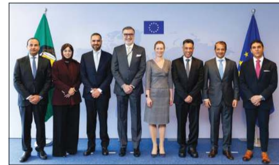
المظلة العليا للشؤون الخارجية والسياسة الأمنية في الاتحاد الأوروبي كايا كالاس خلال اللقاء مع سفيراء دول مجلس التعاون الخليجي

بروكسل - كونا: أكد سفيراء وممثلو دول مجلس التعاون لدول الخليج العربية لدى الاتحاد الأوروبي والمظلة العليا للشؤون الخارجية والسياسة الأمنية في الاتحاد الأوروبي ونائبة رئيس المفوضية الأوروبية كايا كالاس أهمية تعزيز الشراكة الاستراتيجية بين الجانبين