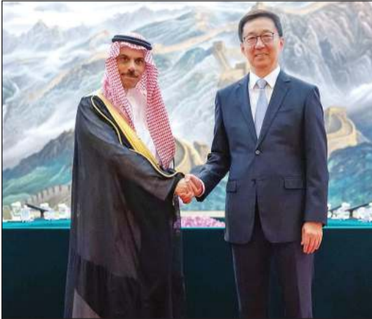
نائب الرئيس الصيني هان تشنغ مستقبلاً صاحب السمو الأمير فيصل بن فرحان وزير الخارجية السعودي (واس)

نائب الرئيس الصيني بحث مع وزير الخارجية السعودي الأوضاع الإقليمية والدولية