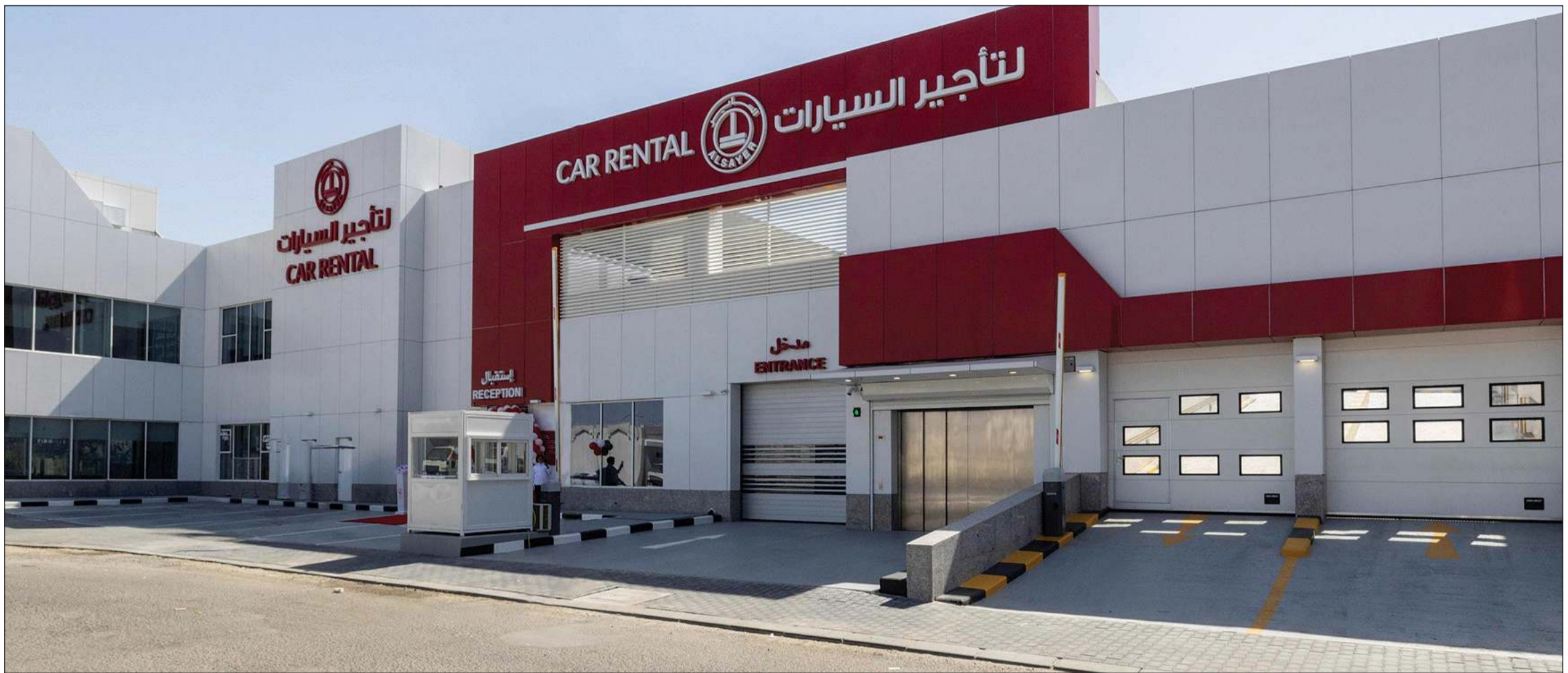
منشأة السائر المتكاملة لخدمة السيارات وتأجيرها في منطقة الري

تعزيزاً لإستراتيجية النمو في قطاع السيارات وترسيخاً لثقافة «العمل أولاً» في قطاع النقل بالكويت