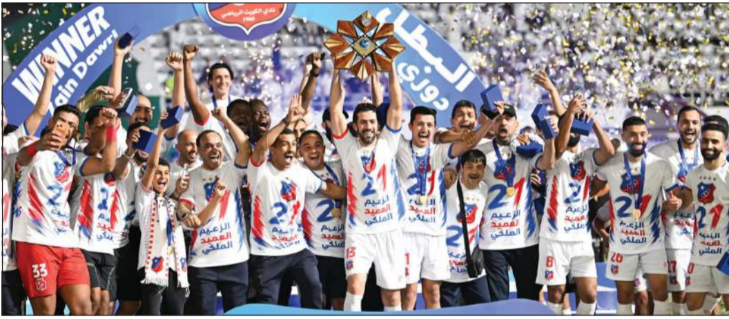
لاعبو الكويت يحتفلون بالتتويج بلقب الدوري الممتاز الـ 21