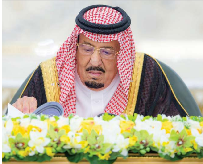
خادم الحرمين الشريفين الملك سلمان بن عبدالعزيز يترأس جلسة مجلس الوزراء التي انعقدت في جدة أمس (واس)

وأطلع المجلس على الموضوعات المدرجة على جدول أعماله، من بينها موضوعات اشترك مجلس الشورى في دراستها، كما أطلع على ما انتهى إليه كل من مجلسي الشؤون السياسية والأمنية، والشؤون الاقتصادية والتنمية، واللجنة العامة لمجلس الوزراء، وهيئة الخبراء بمجلس الوزراء في شأنها، بحسب «واس».