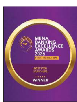
جائزة الأفضل للشركات الناشئة