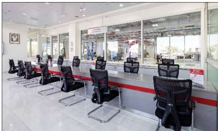
قسم استقبال العملاء

تضم المنشأة ورشة متطورة مجهزة بما يلي: ● أحدث أنظمة الفحص والتشخيص الفني: نتيج التحديد السريع والدقيق للمشكلات الفنية لكافة فئات المركبات. ● 14 نقطة خدمة: تصميم متعدد المسارات يضمن التعامل مع عدة مركبات في آن واحد لتقليل أوقات الانتظار وزيادة الإنتاجية اليومية. ● نظام حركة انسيابي للمركبات أحادي الاتجاه: لمنع أي اختناقات تشغيلية ويختصر الوقت الإجمالي لتجهيز السيارات.