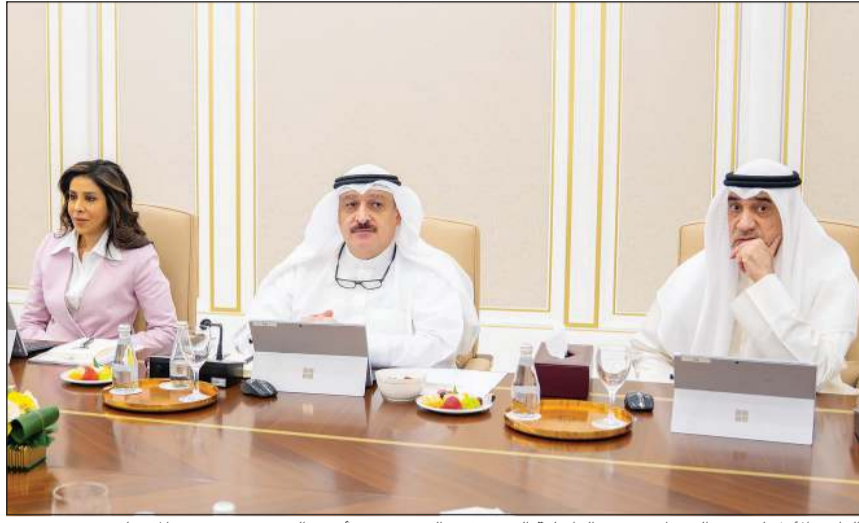
النائب الأول لرئيس الوزراء ووزير الداخلية الشيخ فهد اليوسف و.أحمد العوضي و.دنورة المشعان