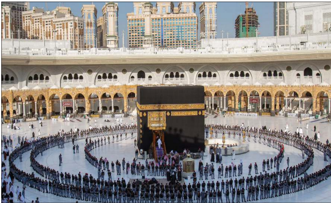
جانب من عمليات غسل الكعبة

بإستخدام مكونات خاصة تشمل 15 ليترًا من ماء زمزم، و15 ليترًا من ماء الورد، و15 ليترًا من دهن الورد، إضافة إلى 100 مل من دهن العود.