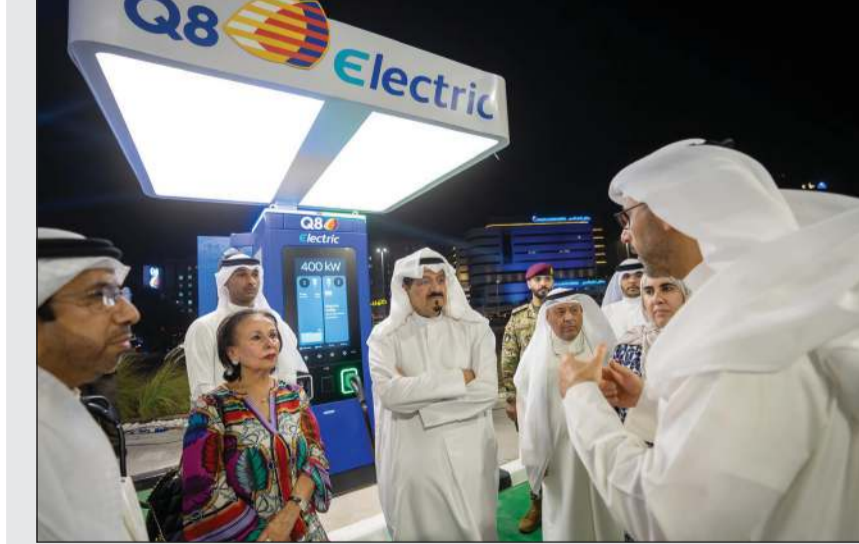
جانب من جولة سمو الشيخ أحمد عبدالله رئيس الوزراء في المحطة بحضور وزير النفط طارق الرومي ونائب رئيس مجلس الإدارة والرئيس التنفيذي لمؤسسة البترول الكويتية الشيخ نواف السعوي والسيدة وفاء القطامي ووكيلة وزارة المالية أسيل المنيفي