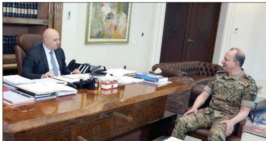
رئيس الجمهورية العماد جوزف عون مستقبلاً قائد الجيش العماد رودولف هيكل

القاهرة - أحمد صبري: ثنن د. مصطفى مدبولي، رئيس مجلس الوزراء، أمس، توصل الحكومة المصرية وفريق صندوق النقد الدولي إلى اتفاق على مستوى الخبراء بشأن المراجعة السابعة لبرنامج التمويل الممدد، الممتد لمدة 48 شهراً، في إطار «تسهيل الصندوق الممدد» (EFF)، وكذلك المراجعة الثانية في إطار «تسهيل المرونة والاستدامة» (RSF). وقال رئيس الوزراء إنه