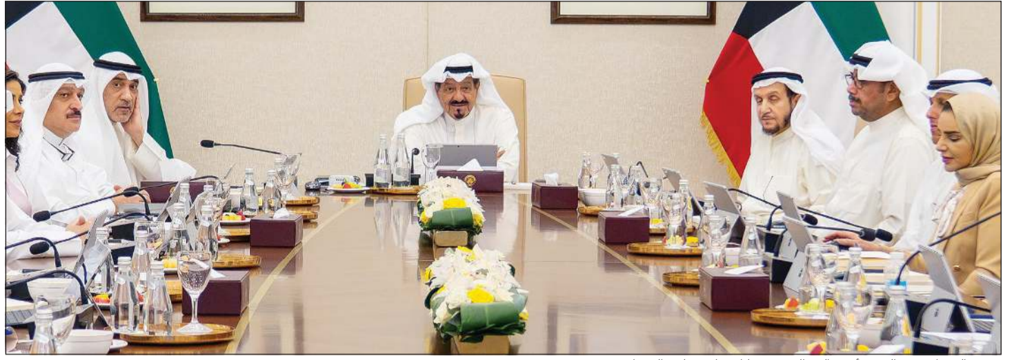
رئيس الوزراء سمو الشيخ أحمد عبدالله مترئسا اجتماع مجلس الوزراء