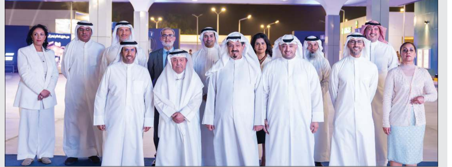
سمو الشيخ أحمد عبدالله رئيس الوزراء خلال حفل الافتتاح التشغيلي لمحطات وقود العلامة التجارية العالمية «كيو أيت» (Q8) بحضور وزير النفط طارق الرومي ونائب رئيس مجلس الإدارة والرئيس التنفيذي لمؤسسة البترول الكويتية الشيخ نواف السعوي والرئيس التنفيذي لشركة البترول الوطنية الكويتية وضحة الخطيب وبعض الحضور

تحت رعاية وبحضور سمو الشيخ أحمد عبدالله رئيس مجلس الوزراء، أقامت مؤسسة البترول الكويتية حفل الافتتاح التشغيلي لمحطات وقود العلامة التجارية العالمية «كيو أيت» (Q8) في منطقة الرقّة. وأكد سمو رئيس مجلس الوزراء في تصريح صحافي حرص الدولة على دعم القطاع النفطي الكويتي الذي واصل التطور والنمو بخطى ثابتة لتحقيق الأهداف الاستراتيجية على الرغم من الظروف الإقليمية الراهنة، مستنداً لقيمه في التميز والمهنية وإرثه العريق في الإنجاز بمختلف الظروف. وأشار سموه بالجهود التي أسهمت في إنجاز 5 محطات للوقود خلال فترة وجيزة، مؤكداً أن هذا الإنجاز يعكس كفاءة التخطيط وسرعة التنفيذ والتنسيق بين مختلف الجهات المعنية بما يسهم في تطوير البنى التحتية وتحفيز الأنشطة التجارية والخدمية المرتبطة بقطاع الوقود والخدمات اللوجستية. وقال سمو رئيس مجلس الوزراء إن افتتاح شركة «كيو أيت» (Q8) باكورة محطاتها في البلاد يسهم في الارتقاء بجودة الخدمات المقدمة للمستهلكين فضلاً عن استقطاب المزيد من الاستثمارات النوعية بما يعزز الإيرادات العامة للدولة ويواكب رؤية الدولة في تحقيق التنمية الاقتصادية المستدامة. حضر الافتتاح وزير النفط طارق الرومي ووزير الدولة للشؤون الاقتصادية والاستثمار عبدالعزیز المرزوق ونائب رئيس مجلس الإدارة والرئيس التنفيذي لمؤسسة البترول الكويتية الشيخ نواف السعوي والعضو المنتدب للهيئة العامة للاستثمار الشيخ سعود سالم عبدالعزیز ورئيس قوة الإطفاء العام اللواء طلال الرومي ومدير عام بلدية الكويت منال العصفور ووكيلة وزارة المالية أسيل المنيفي.