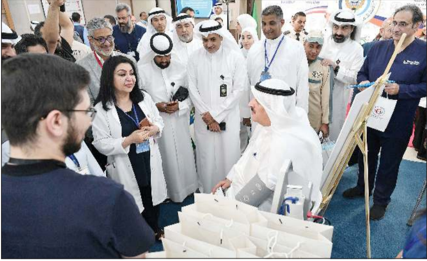
وزير الصحة د.أحمد العوضي خلال قياس ضغط الدم في فعاليات اليوم التوعوي

كونا: افتتح وزير الصحة د.أحمد العوضي أمس اليوم التوعوي في مستشفى مبارك الكبير بمحافظة حولي الذي يهدف إلى نشر الوعي حول أمراض عدة لدى المرضى والمرجعين، وأكد الوزير العوضي لـ «كونا» حرص وزارة الصحة على مثل هذه الفعاليات التي لها دور أساسي في التوعية وتنقيف المجتمع بأن «الوقاية خير من قنطار علاج».