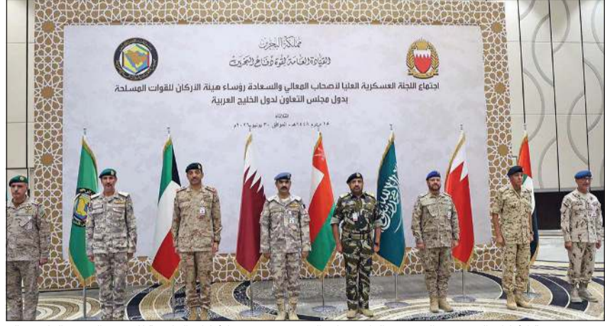
رئيس هيئة الأركان البحريني الفريق الركن ذياب النعيمي و رئيس الأركان العامة للجيش الفريق الركن خالد الشريهان مع المشاركين في الاجتماع

المنامة - كونا: بحث رؤساء هيئات الأركان للقوات المسلحة بدول مجلس التعاون لدول الخليج العربية خلال اجتماع اللجنة العسكرية العليا بالمنامة سبل تعزيز العمل العسكري المشترك.