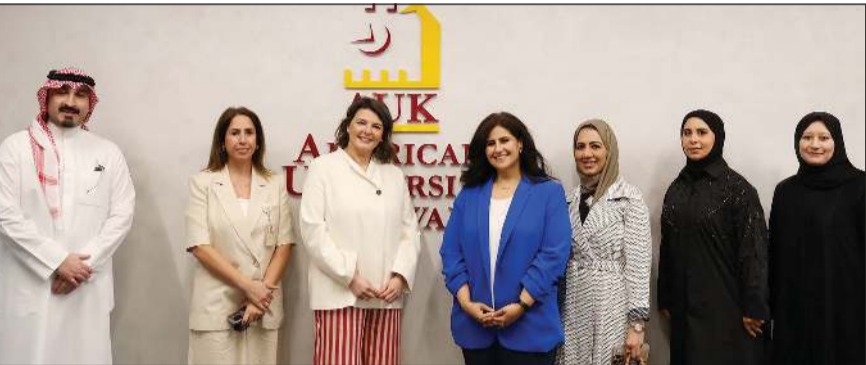
صورة جماعية لفريق الإدارة في الجامعة الأمريكية والمكتبة الوطنية الكويتية