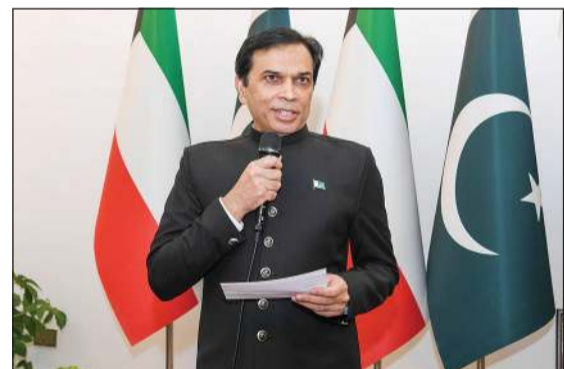
سفير باكستان لدى البلاد ظفر إقبال متحدثا في فعالية «مذاق باكستان 2026»

والتمازيم المشتركة، مبينا أن التطورات الإقليمية الأخيرة عززت الاهتمام بتوسيع مجالات التعاون الفني والتدريب، مع التأكيد على عدم وجود قوات عسكرية باكستانية منتشرة في الكويت. وعن المستجدات الإقليمية، شدد السفير على أن الحوار والدبلوماسية يمثلان الطريق الأمثل لمعالجة الأزمات، متمنا الدور الذي تضطلع به الكويت في دعم جهود خفض التصعيد وتعزيز الأمن والاستقرار في المنطقة.