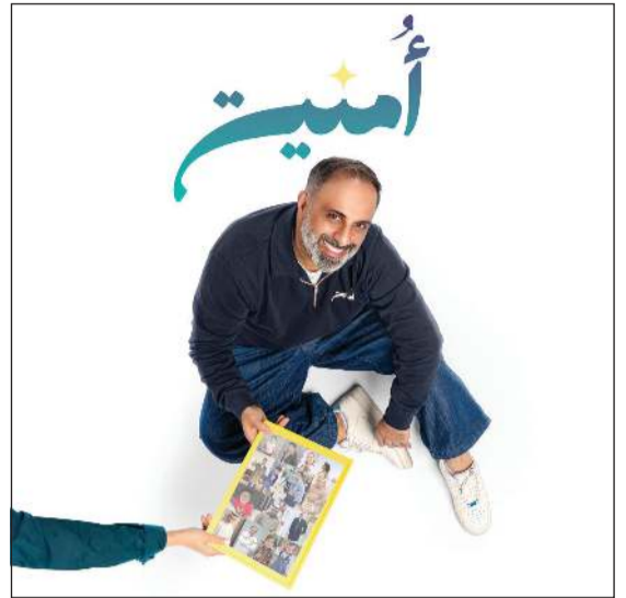
بوستر برنامج «أمنية»