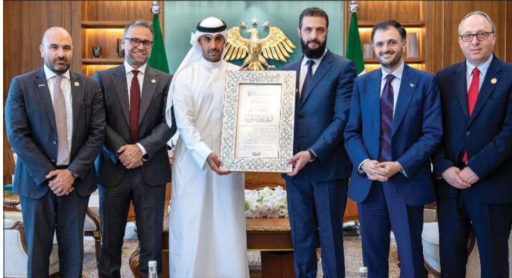
الرئيس السوري أحمد الشرع يتوسط بدر الخرافي ووزير الاتصالات وتقانة المعلومات السوري عبدالسلام هيكل وقيادي الوزارة ومجموعة «زين»

الكويت - دمشق: أعلنت مجموعة «زين» أنها تلقت إشعاراً من وزارة الاتصالات وتقانة المعلومات في سورية يفيد بتسوية رخصة تشغيل شبكة اتصالات متنقلة جديدة في الجمهورية العربية السورية، وذلك بعد عملية تنافسية شجعت لتقييم فني ومالي، تقدمت خلالها بأفضل عرض وفقاً لمعايير الزيادة بقيمة 747 مليون دولار.