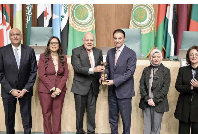
مندوبنا الدائم لدى جامعة الدول العربية السفير طلال المطيري يتسلم تكريم وزيرة الدولة لشؤون التنمية والاستدامة د.ريم الفليح

القاهرة - كونا: كرم منتدى المرأة العربية وزيرة الدولة لشؤون التنمية والاستدامة د.ريم الفليح تقديراً لإسهاماتها في مجالات التنمية والعمل المجتمعي وذلك بمناسبة اليوم العالمي للمرأة العربية الدبلوماسي. جاء ذلك خلال أعمال منتدى المرأة العربية والمسؤولية المجتمعية في نسخته الخامسة التي عقدت بمقر جامعة الدول العربية بالتعاون مع المجلس العربي للمسؤولية المجتمعية واتحاد الجامعات العربية. وتسلم درع التكريم مندوب الكويت الدائم لدى جامعة الدول العربية السفير طلال المطيري نيابة عن الوزيرة الفليح من الجهات المنظمة للمنتدى. وشهد المنتدى تكريم عدد من الشخصيات النسائية اللاتي لعبن أدواراً مؤثرة في مجالات التنمية والعمل المجتمعي والديبلوماسي في إطار الاحتفاء بالنماذج النسائية المهمة التي نجحت في ترك بصمات واضحة