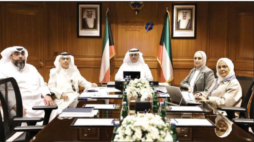
وزير الكهرباء والماء والطاقة المتجددة د.صبيح المخيزم وكبير الوزاره د.عادل الزامل خلال الاجتماع الاستثنائي للجنة التعاون الكهربائي والمائي في دول مجلس التعاون

كونا: شارك وزير الكهرباء والماء والطاقة المتجددة د.صبيح المخيزم في الاجتماع الاستثنائي للجنة التعاون الكهربائي والمائي في دول مجلس التعاون لدول الخليج العربية الذي عقد اليوم الاثنين عبر تقنية الاتصال المرئي. وقالت وزارة الكهرباء والماء والطاقة المتجددة في بيان له، «كونا» إن الاجتماع جاء للاطلاع على قرار المجلس الأعلى في اللقاء التشاوري الـ 19 لقادة دول مجلس التعاون المنعقد بمدينة جدة في أبريل الماضي بشأن إمكانية بناء مشاريع للربط المائي بين دول المجلس. وأفاد البيان بأن الاجتماع يأتي في إطار حرص دول مجلس التعاون على تعزيز العمل الخليجي المشترك في القطاعات الحيوية وترسيخ منظومة أمن مائي قادرة على مواجهة التحديات الجيوسياسية والتشغيلية والمتأخية وضمان استدامة الخدمات الأساسية للأجيال القادمة. وأوضح أن المشاركين بالاجتماع أكدوا أهمية دراسة إنشاء منظومة ربط مائي خليجية متكاملة تضمن استمرارية الإمدادات عبر توفير مسارات بديلة ونقل الفوائض الإنتاجية لمحطات التحلية لتعويض أي نقص أو انقطاع محتمل. وذكر أنه تمت مناقشة