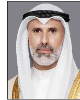
وزير الخارجية الشيخ جراح الجابر

وذكرت «الخارجية» في بيان لها أنه جرى خلال الاتصال استعراض العلاقات الثنائية الاستراتيجية بين البلدين الصديقين وسبل تعزيزها وتطويرها في مختلف المجالات بالإضافة إلى مناقشة آخر تطورات الأحداث الراهنة في المنطقة والجهود المبذولة بشأنها. من جانب آخر، أعربت وزارة الخارجية عن خالص تعازي وتعاطف دولة الكويت مع دولة قطر الشقيقة في استشهاد أحد المواطنين القطريين وإصابة مقيم جراء إصابتهما بشظايا ناجمة عن العمليات العسكرية التي شهدتها المنطقة مؤخرا. وتقدمت «الخارجية» بخالص تعازي دولة الكويت وصادق مواساتها للممارسات التي تمثل تقويضا للجهود الرامية إلى حفظ الأمن والاستقرار واستخفافا بالالتفاقيات الدولية ذات الصلة وفي مقدمتها اتفاقية فض الاشتباك لعام 1974. وجددت موقف دولة الكويت الثابت والداعم لسيادة الجمهورية العربية السورية الشقيقة ووحدة وسلامة أراضيها.