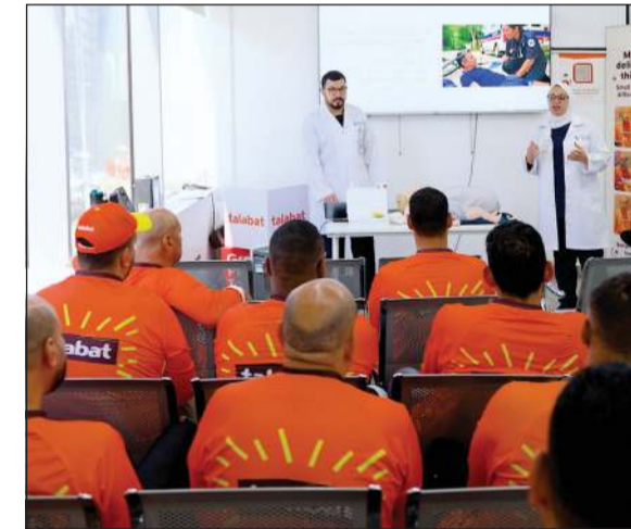
جانب من الورشة التدريبية في الإسعافات الأولية لسائقي التوصيل

في إطار حملة «الصف جمعنا» التي أطلقتها «طلبات» لدعم سائقي التوصيل، وانطلاقاً من التزام مستشفيات السلام المتواصل بتعزيز الصحة والسلامة المجتمعية، نظمت «طلبات» بالتعاون مع مستشفيات السلام ورشة تدريبية متخصصة في الإسعافات الأولية لسائقي التوصيل.