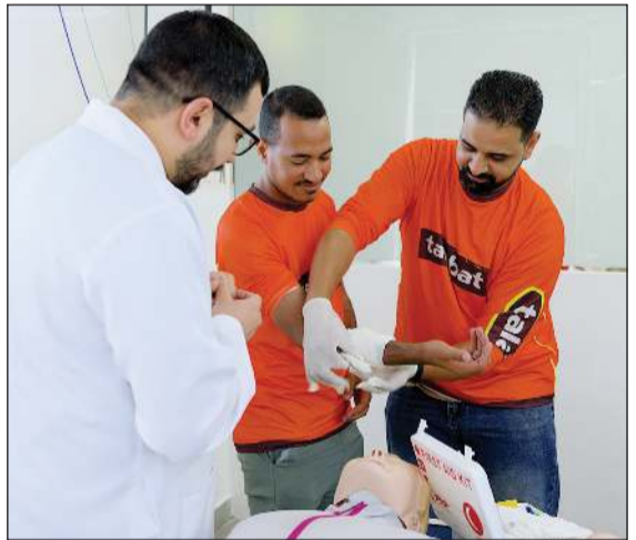
جانب من الإسعافات الأولية