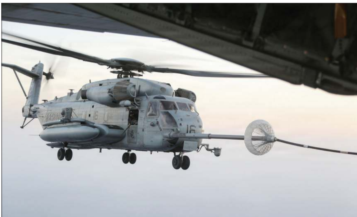
مروحية من طراز CH-53E تابعة لسلاح مشاة البحرية الأميركية تتزود بالوقود جوا أثناء تحليقها فوق الشرق الأوسط

العواصم - وكالات: اتهم الرئيس الأميركي دونالد ترامب إيران باستهداف سفن تعبر مضيق هرمز بطائرات مسيرة هجومية، فيما حذرها نائبه جي دي فانس من أن أي هجوم جديد سيقابل بالعنف، أما القيادة المركزية الأميركية «سنتكوم» فأعلنت شن ضربات ردا على هجوم إيران.