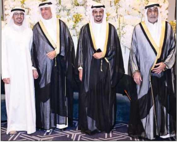
الشيخ أحمد الدعيخ يبارك بالمناسبة السعيدة