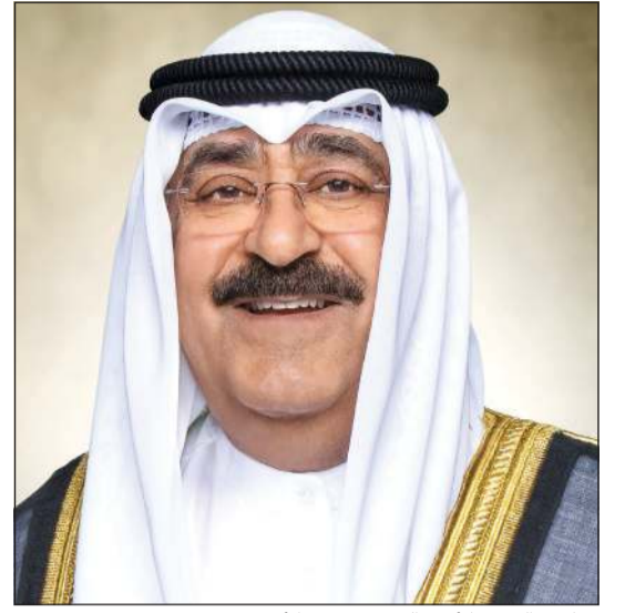
صاحب السمو الأمير الشيخ مشعل الأحمد

كوونا: بعث صاحب السمو الأمير الشيخ مشعل الأحمد ببرقية تهنئة إلى أخيه الرئيس إسماعيل عمر جيله رئيس جمهورية جيبوتي الشقيقة، عبر فيها سموه عن خالص تهنائه بمناسبة ذكرى الاستقلال لبلاده، متمنياً سموه له موفور الصحة والعافية ولجمهورية جيبوتي وشعبها الشقيق كل التقدم والازدهار.