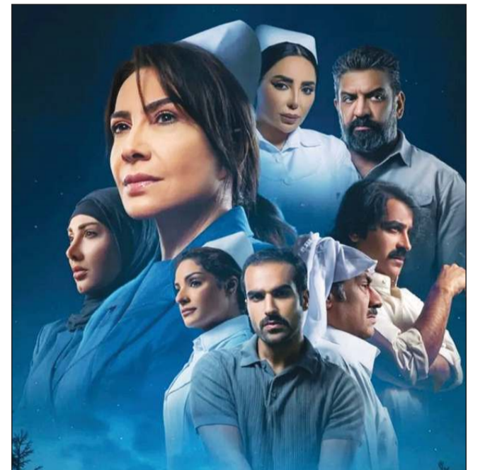
بوستر «سستر فخرية»