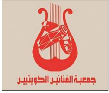
جمعيّة الفنانين الكويتيين

أعلنت جمعية الفنانين الكويتيين خروج القدير الرئيس الفخري للجمعية «شادي الخليج» من المستشفى، وذلك بعد تحسن حالته الصحية وبناء على قرار الفريق الطبي المشرف على علاجه. وأكدت الجمعية أن شادي الخليج سيواصل استكمال خطة العلاج خلال الفترة المقبلة، متمنية له دوام الصحة والعافية والشفاء التام، ومشيدة بالدعوات الصادقة التي أحاطته من جمهوره ومحبيه داخل الكويت