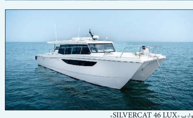
قوارب SILVERCAT 46 LUX