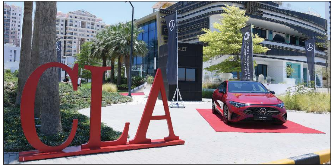
مرسيدس- بنز CLA الجديدة كلياً

خلال فعالية جمعت ممثلي وسائل الإعلام والمتخصصين في عالم السيارات وصنّاع المحتوى على منصات التواصل الاجتماعي