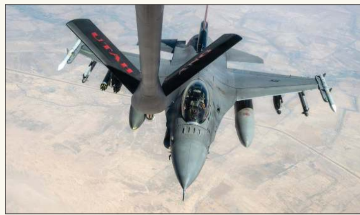
مقاتلة «إف - 16» تحلق فوق الشرق الأوسط خلال دورية (سنستكوم)

الإمارات تعلن تضامنها مع مملكة البحرين بوجه الاعتداءات: تهديد لأمن واستقرار المملكة