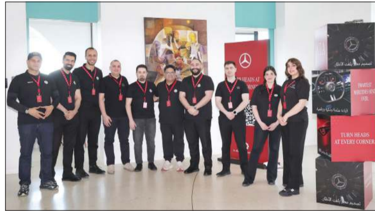
فريق عمل «الملا أوتوموبيلز» و«مرسيدس- بنز» في صورة جماعية

تطلق تأثيرات إضاءة متحركة عند فتح السيارة وإغلاقها، فيما تتواصل هذه الأجواء الضوئية في المصابيح الخلفية وشريط الإضاءة الممتد على كامل العرض، لتمنح CLA حضوراً بصرياً لا يخطئه الناظر نهاراً وليلاً. وتأتي جميع طرازات CLA مزودة بسقف بانورامي ثابت بلا دعائم وسطي كتجهيز قياسي، يمتد بسلاسة من الزجاج الأمامي حتى المؤخرة، ما يعظم مساحة الرأس ويملا المقصورة بضوء طبيعي. في داخل سيارة مرسيدس- بنز CLA الجديدة كلياً يقع نظام التشغيل MB.OS - الذي طورته مرسيدس- بنز داخلياً - في خطوة راسخة نحو