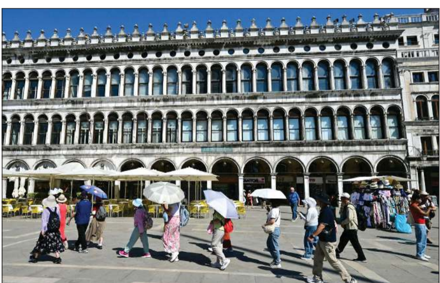
سياح يحمون أنفسهم من أشعة الشمس بالمظلات في ساحة سان ماركو بالبنديقة

ألغى عرض إعادة تمثيل معركة وتوترو في بلجيكا، وفي ألمانيا لن تجري مدينة هامبورغ سباق نصف الماراثون. وفي المنطقة الباريسية، سجلت خدمات الطوارئ ارتفاعاً هائلاً في الاتصالات الواردة بنسبة بلغت 80٪ هذا الأسبوع. وقال مساعد رئيس بلدية باريس المكلف الشؤون الصحية أنطوان البجير إن المستشفيات الباريسية تشهد «حالة اكتظاظ استثنائية» غير مسبوقة، مؤكداً «أننا في وسط أزمة صحية». وفي بريطانيا، باتت المنظومة الصحية «على مشارف الانهيار»، وقد ما لاحظت نائبة