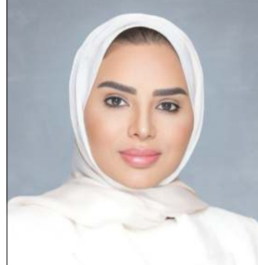
وزيرة الشؤون الاجتماعية وشؤون الأسرة والطفولة د. أمثال الحويلة

المرحلة النهائية من مشروع قانون العمل التعاوني، يهدف رفع كفاءة الأداء المالي والإداري وتعزيز أدوات المساءلة والحوكمة. كما أشارت إلى إنجاز منظومة الحماية من العنف الأسري، وتطوير تشريعات الحضّانة والعمل التطوعي، بما يعزز الإطار التشريعي ويحسن جودة الخدمات. وأضافت أنه يتم العمل على تنظيم إشهار جمعيات النفع العام والجمعيات الخيرية وفق احتياجات المجتمع وأولويات التنمية، إلى جانب تعديل قانون حقوق الأشخاص ذوي الإعاقة بما يساهم في تطوير الخدمات وتعزيز الرقابة وحماية حقوق المستفيدين. وأكدت د. الحويلة أن التأهيل والتدريب المستمر لأعضاء مجالس إدارات الجمعيات التعاونية يعدان من الركائز الأساسية للارتقاء بالأداء الإداري والمالي والرقابي، بما يضمن كفاءة العمل واستدامة التطوير التفصيلي ص 2