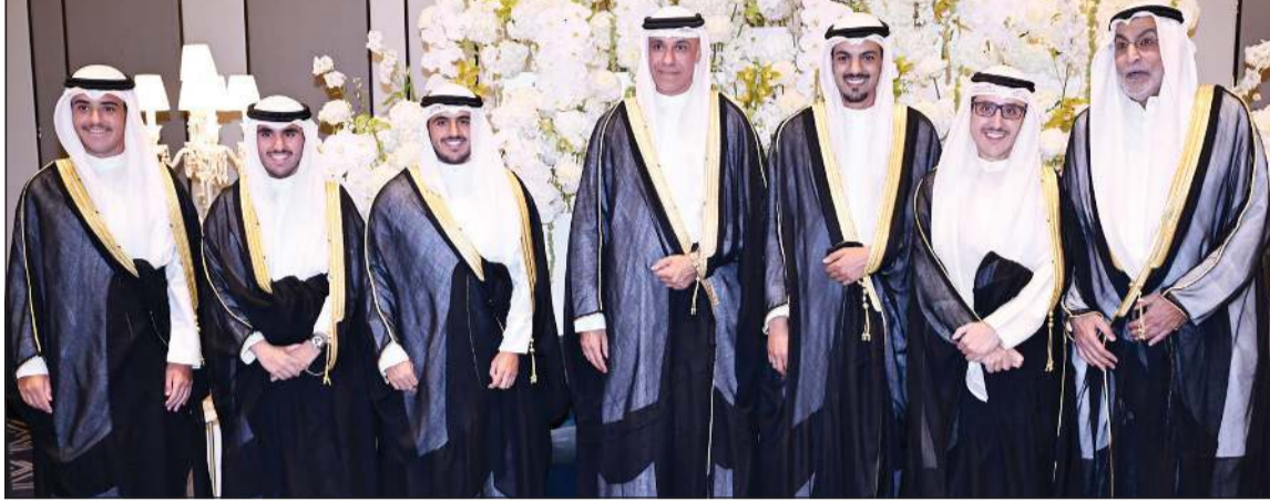
الشيخ د.أحمد ناصر المحمد والشيخ محمد أحمد الناصر والشيخ عبدالله أحمد الناصر يباركون