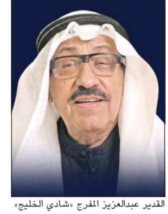
القدير عبدالعزيز الفرج «شادي الخليج»

أعلنت جمعية الفنانين الكويتيين خروج القدير الرئيس الفخري للجمعية «شادي الخليج» من المستشفى، وذلك بعد تحسن حالته الصحية وبناء على قرار الفريق الطبي المشرف على علاجه. وأكدت الجمعية أن شادي الخليج سيواصل استكمال خطة العلاج خلال الفترة المقبلة، متمنية له دوام الصحة والعافية والشفاء التام، ومشيدة بالدعوات الصادقة التي أحاطته من جمهوره ومحبيه داخل الكويت