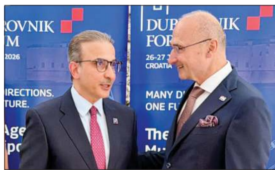
مساعد وزير الخارجية لشؤون أوروبا السفير نجيب البدر مع وزير الخارجية والشؤون الأوروبية الكرواتي غوردان غريليتش رادمان

تناولت كذلك مواضيع في مجال الأمن البحري وسلامة الممرات البحرية وسلاسل الإمداد والتجارة الدولية إلى جانب التحول الرقمي ومناقشة آفاق التعاون الدولي في ظل التحديات الراهنة. وعلى هامش المنتدى، استعرض السفير البدر مع وزير الخارجية والشؤون الأوروبية الكرواتي غوردان غريليتش رادمان ومدير عام الشؤون السياسية بوزارة الخارجية والشؤون الأوروبية الكرواتية د. تومسلاف لينديتش، أوجه العلاقات الثنائية بين البلدين وسبل تعزيزها بمختلف المجالات التي تخدم مصالح البلدين والشعبين الصديقين إضافة إلى تبادل وجهات النظر حول عدد من القضايا الإقليمية والدولية ذات الاهتمام المشترك.