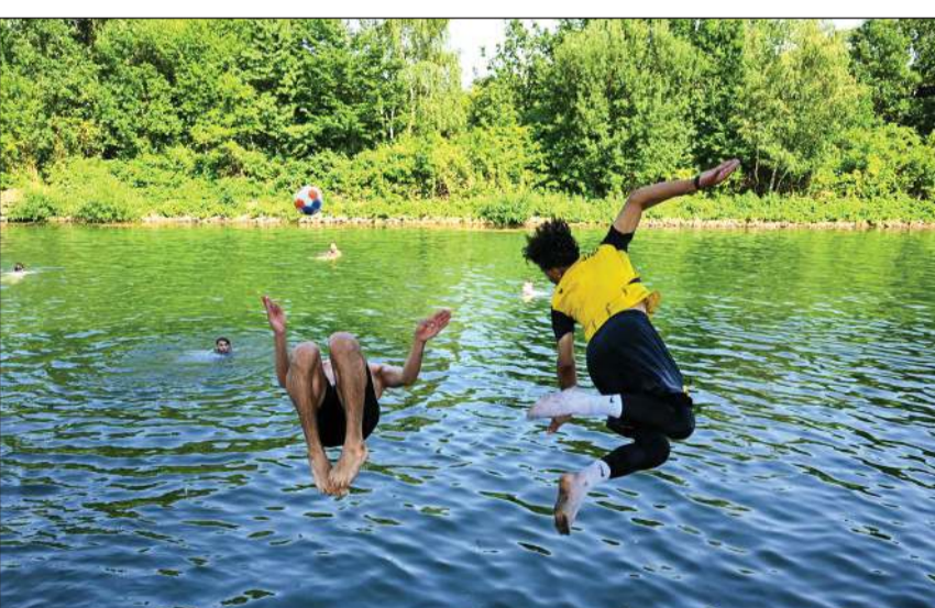
فتيان يقفزان في مياه قناة «دورتونده» غربي ألمانيا هرباً من حرارة الجو