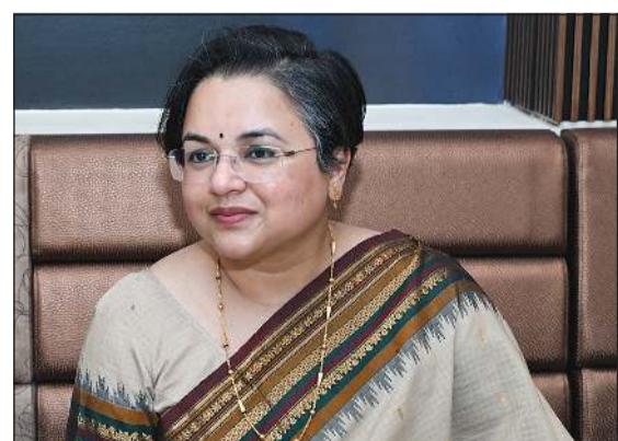
سفيرة الهند لدى الكويت باراميتا تريباتي (قاسم باشا)

الحوار والتواصل مع مختلف الجهات، بما في ذلك المؤسسات الحكومية، وقطاع الأعمال، ومنظمات المجتمع، والمؤسسات التعليمية، ووسائل الإعلام، وهو ما أسهم في تعزيز الشراكة الاستراتيجية الوثيقة بين الهند والكويت، وترسيخ العلاقات التاريخية والثقافية والاقتصادية التي تجمع البلدين الصديقين. كما أشادت بالدور الحيوي الذي تضطلع به الجالية الهندية في دعم الاقتصاد الكويتي والمساهمة في النهج الاجتماعي للمجتمع، مؤكدة التزام السفارة بمواصلة رعاية مصالح المواطنين الهنود وتعزيز التعاون الثنائي في مختلف المجالات.