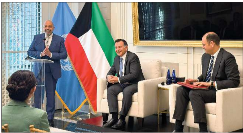
مندوبنا الدائم لدى الأمم المتحدة السفير طارق البناي

نيويورك - كوونا: أكد مندوبنا الدائم لدى الأمم المتحدة السفير طارق البناي تجديد دعم البلاد لانتخاب القاضي الأردني محمود الحمود عضواً في محكمة العدل الدولية، مشيداً بخبرته القانونية الواسعة وإسهاماته في خدمة القانون الدولي.