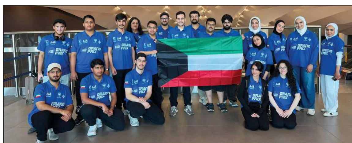
الوفد الطلابي قبيل مغادرته إلى سويسرا للمشاركة في نهائيات بطولة العالم لسباق السيارات الهيدروجينية

الابتكار والعمل الجماعي، بما يواكب التطورات العالمية ويسهم في إعداد كوادر وطنية مؤهلة تمتلك المهارات اللازمة للمستقبل. وأكدت الهيئة أن هذه المشاركة تمثل فرصة مهمة لطلبتها لاكتساب الخبرات العملية والاحتكاك بالفرق الدولية، والإطلاع على أحدث