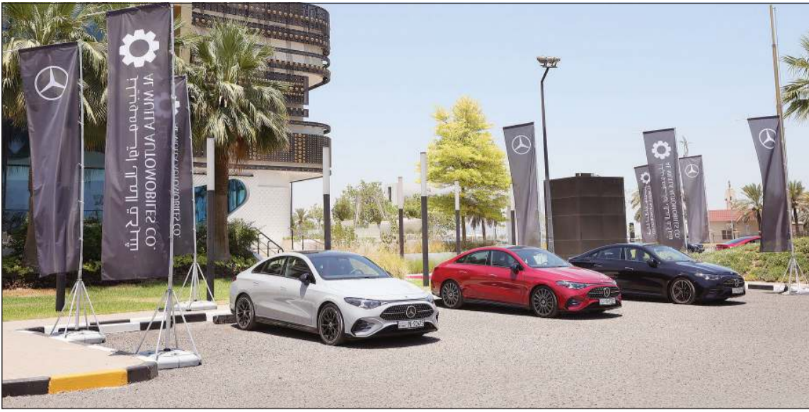
سيارات مرسيدس- بنز CLA جاهزة للتجربة