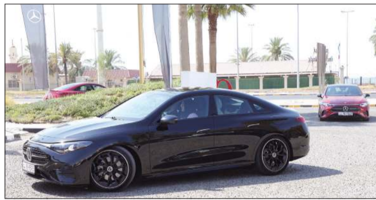
جانب من تجارب القيادة

مستقبل المركبات الرقمية. وبفضل بنية الشريحة والسحابة المتكاملة، يربط MB.OS نظام القيادة ومنظومة المعلومات والترفيه وسائر أنظمة السيارة في منظومة موحدة، مع إمكانية التحديث المستمر عبر الأنترنت. كما يمثل MB.OS الانطلاقة الرسمية للجيل الرابع من نظام MBUX، وهو أول نظام معلومات وترفيه في سيارة يدمج الذكاء الاصطناعي من كل من Microsoft و Google في آن واحد. وتشكل شاشة MBUX Superscreen الاختيارية البارزة، الممتدة عبر كامل عرض لوحة القيادة، تجربة متكاملة من ثلاث شاشات متواصلة تتيح للسائق والراكب الأمامي الوصول إلى تطبيقات الترفيه والمعلومات وتطبيقات الطرف الثالث. أما الكونسول الوسطي المعاد تصميمه فيتخذ وضعية مرتفعة لإضفاء طابع رياضي، ويتألف من مستويين يمتد بمساحة من الزجاج الأمامي حتى طرازات CLA مزودة بسقف بانورامي ثابت بلا دعائم وسطي كتجهيز قياسي، يمتد بسلاسة من الزجاج الأمامي حتى المؤخرة، ما يعظم مساحة الرأس ويملا المقصورة بضوء طبيعي. في داخل سيارة مرسيدس- بنز CLA الجديدة كلياً يقع نظام التشغيل MB.OS - الذي طورته مرسيدس- بنز داخلياً - في خطوة راسخة نحو