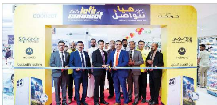
جانب من افتتاح المهرجان

التكنولوجيا التي تنظمها لولو هايبرماركت، حيث يقدم عروضاً استثنائية على مجموعة واسعة من الفئات والمنتجات، تشمل الهواتف الذكية، والملحقات التقنية، والأجهزة المنزلية، والحلول الذكية المتطورة. كما تستعرض الفعالية أحدث الابتكارات في عالم تقنيات الهواتف المحمولة والأجهزة الذكية، ما يتيح للعملاء فرصة التعرف على منتجات الجيل الجديد وتجربتها بشكل مباشر من خلال العروض التوضيحية والتجارب العملية. وتسهم الشراكات مع العلامات التجارية التقنية الرائدة في تعزيز الطابع الابتكاري للمهرجان، بما يمنح الزوار فرصة استكشاف التقنيات الناشئة والتعرف على منتجات مصممة لتبسيط الحياة اليومية والارتقاء بجودتها.