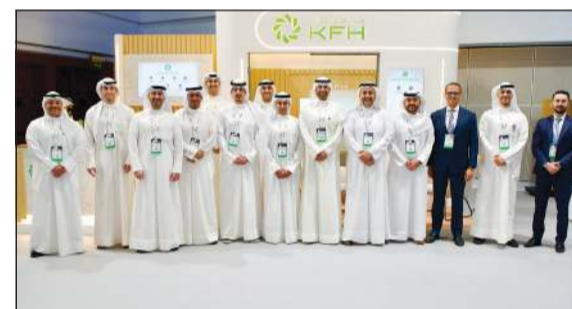
فريق مجموعة بيت التمويل الكويتي المشارك في المؤتمر