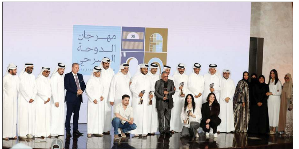
وزير الثقافة القطري الشيخ عبدالرحمن بن حمد آل ثاني متوسلا الفائزين في دورة المهرجان