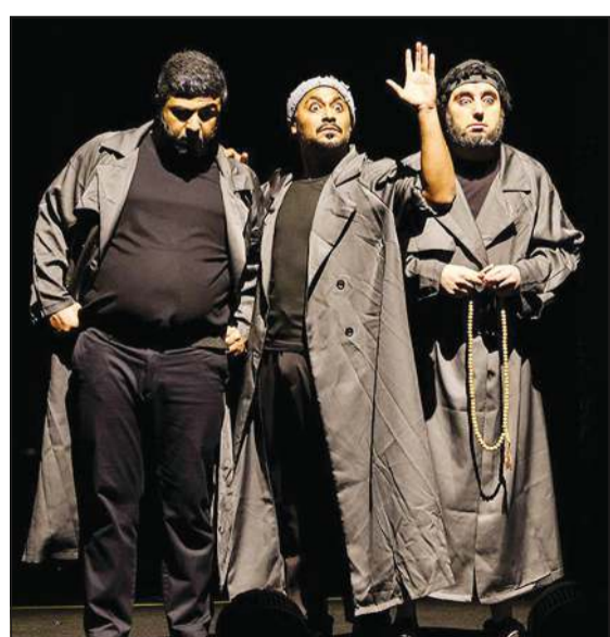
مشهد من مسرحية «المدينة الفاصلة» لفرقة قطر المسرحية

ومع إسدال الستار على الدورة الـ 38، يؤكد مهرجان الدوحة المسرحي أنه ليس مجرد فعالية سنوية، بل مشروع ثقافي مستدام يجسد رؤية قطر في جعل الثقافة ركيزة أساسية من ركائز التنمية، ويكرس حضور المسرح كمساحة للإبداع والحوار وصناعة الجمال، مهما تبدلت الظروف وتعاظمت التحديات.