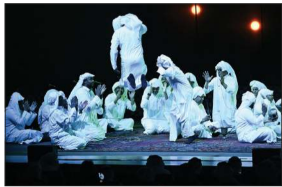
تالق كبير لفرقة الماص للفنون الشعبية

مازلت قادرة على استقطاب الأجيال الجديدة متى ما قدمت بصورة احترافية تلتق بقيمتها التاريخية والثقافية. واتسمت الأمسية بدفء حياقة تحولت إلى حوار موسيقي وغنائي عفوي امتد لوصولتين تخللتها استراحة قصيرة، واستهل العماري والمهدي السهرة بفن الدواري، أحد أبرز فنون الغناء البحري في الخليج العربي، من خلال أغنية «اللولو ضيع دوأوبينه»، ثم قدما تنزلية «أول ما نبيدي»، أعقبها «يا دان» التي تعد من أشهر التنزليات في فنون الصداوي واليامال البحري الكويتي.