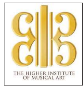
المعهد العالي للفنون الموسيقية

الشهادة العلمية وصون مكانتها، ولا يقتصر التدقيق الإداري على المواطنين فقط بل يشمل المقيمين العاملين بتلك المعاهد بهدف الحفاظ على سمعة التعليم وتعزيز الثقة بالمخرجات الأكاديمية. يذكر أن تزوير الشهادة يعتبر من الجرائم التي تناولها قانون الجزاء الكويتي رقم 61 لسنة 1960 الذي نص في المادة 259 على أن يعاقب بمسدة لا تتجاوز خمس سنوات حبسا وغرامة مالية لا تتجاوز 5000 دينار أو بإحدى هاتين العقوبتين كل من ارتكب تزوير شهادة أكاديمية أو مهنية واستعملها وهو يعلم بتزويرها.