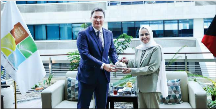
وزيرة الدولة لشؤون التنمية والاستدامة، ريم الفليج خلال اللقاء مع سفير كازاخستان بيزان إيليكيف

كونا: وجهت وزيرة الدولة لشؤون التنمية والاستدامة ريم الفليج الجهات التابعة للبدء في إعداد تقارير الاستدامة وفق نموذج موحد ومؤشرات أداء قابلة للقياس بما يسهم في بناء قاعدة بيانات وطنية متكاملة تدعم اتخاذ القرار وتعزيز الشفافية والإفصاح البيئي.