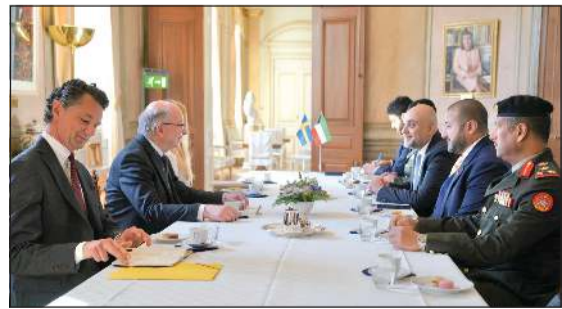
وكيل وزارة الدفاع الشيخ د.عبدالله المشعل خلال مباحثاته مع ممثلي الجهات والمؤسسات المعنية بقطاع الصناعات الدفاعية والأمنية في مملكة السويد

وتناولت هذه الاجتماعات استعراض أحدث التطورات في الصناعات الدفاعية والتقنيات العسكرية المتقدمة، وبحث فرص التعاون وتبادل الخبرات، بما يسهم في دعم جهود التطوير والتحديث وتحقيق أهداف الخطة الاستراتيجية لوزارة الدفاع (2025-2030).