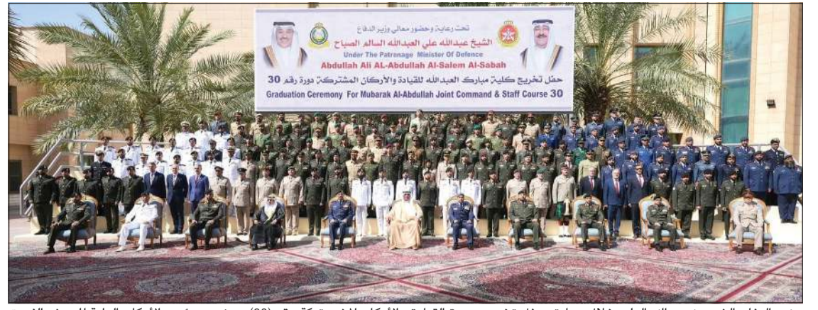
وزير الدفاع الشيخ عبدالله العلي خلال رعايته حفل تخريج دورة القيادة والأركان المشتركة رقم (30) بحضور رئيس الأركان العامة للجيش الفريق الركن خالد الشريهان ونائب رئيس الأركان العامة للجيش اللواء الركن طيار الشيخ صباح جابر الأحمد ووكيل وزارة الدفاع بالندب د.وائل ناصر الصباح ومدير عام الإدارة العامة لخفر السواحل العميد الركن بحري الشيخ مبارك علي اليوسف وقائد الشؤون العسكرية والأمنية في الحرس الوطني العميد الركن عبدالله صالح الخزي وعدد من كبار الضباط القادة

الركن عيسى سيف بن بعلان المزروعى سبل تعزيز التعاون العسكري المشترك بين البلدين الشقيقين. وذكرت وزارة الدفاع الإماراتية في بيان على منصة «إكس»، أن ذلك جاء خلال استقبال الفريق المزروعى للفريق الركن الشريهان في إطار العلاقات