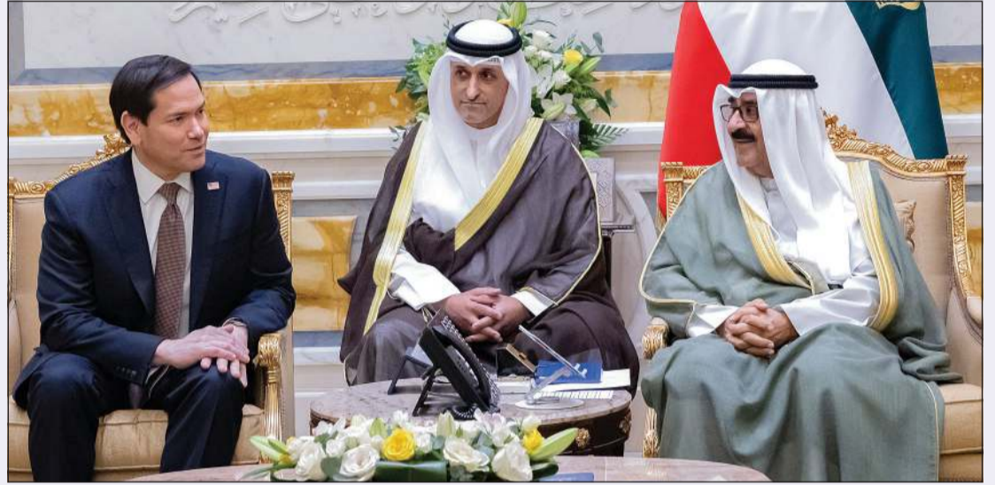
صاحب السمو الأمير الشيخ مشعل الأحمد مستقبلاً وزير الخارجية الأميركي ماركو روبيو