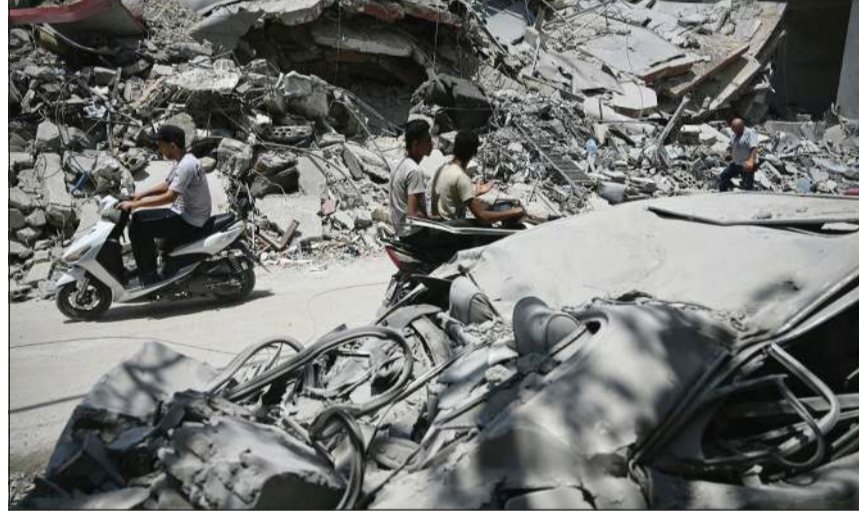
لبنانيون يسيرون بين انقاض مبانٍ دمرتها غارات إسرائيلية على أحد أحياء مدينة صور الساحلية جنوب لبنان

بيروت - منصور شعبان تجه الأنظار في لبنان إلى واشنطن حيث تعقد المفاوضات اللبنانية - الإسرائيلية - الأميركية، وتكسر التوقعات بشأن ما يمكن أن تنتهي إليه تحقيق «إنجاز ما» بريح الوضغ ولا يعقده، طالما أن القرار هو التوصل إلى حل، سواء كانت مفاوضات «مباشرة»، كما يحصل الآن، أو تلك المفتوحة بطريقة «غير مباشرة» توجي بها «الاتصالات» الـ «رفيعة المستوى» الأميركية والفرنسية وغيرها مع رؤساء وقادة لبنانيين، ناهيك عن المواقف المعتنة لجهة تأييد حصر السلاح بيد الدولة وبسط سلطتها على كل أراضيها، وحتى يظهر الخيط الأبيض من الخيط الأسود، تتركز المتابعات، في بيروت، على الواقع الميداني الذي اخترقه تطور مهم يصب في خانة العودة الممكنة للنازحين إلى ديارهم مع انتشار الجيش اللبناني وبكورتها في قرية عين عرب وهي أول قرية حدودية ضمن الخط الأصفر عاد إليها أهلها بعد انتشار الجيش وهي تابعة لقطاع مرجعيون وتبعد 120 كم عن بيروت قبل أن تزدحم قوات الاحتلال بالمغادرة.