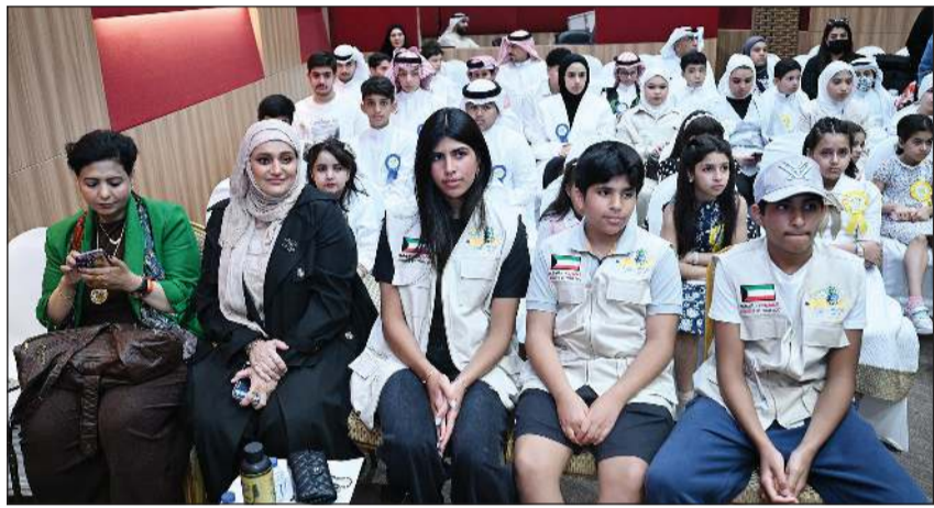
جانبا من الطلبة المكرمين (متين غوزال)

تكريم 48 طالبا وطالبة، مبينة أن بعضهم بالعلاج بالخارج، ومع هذا سيكونون جزءا من الاحتفال. وأوضح أن هناك ثلاثة في مختلف المراحل، من ابتدائي ومتوسط وثانوي، طلاب على أبواب التخرج من الثانوية العامة، مشيرة إلى أنه تم مؤخرا فتح فصل دراسي جديد في مستشفى العدان. ونوهت إلى أن هذا الأمر يعد إنجازا في التوسع بعملية تعليم الطلبة المرضى، كاشفة أن المرحلة المقبلة تتمثل في تصميم منصة حتى يكون الطالب، وإن كان داخل غرفة درس ويتم من خلاله أيضا التعليم عن بعد، خاصة وأن الطلبة الآن تعودوا على هذا الأمر. وأعربت عن أملها في وضع بروتوكول واضح مع وزارة التربية، بحيث يكفل حق كل الأطفال حتى وإن كانوا مرضى.