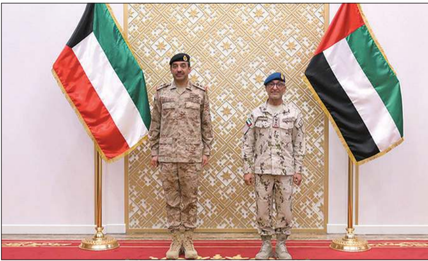
رئيس الأركان العامة للجيش الفريق الركن خالد الشريهان مع رئيس أركان القوات المسلحة الإماراتية الفريق الركن عيسى سيف بن بعلان المزروعى

أبو ظبي - كونا: بحث رئيس دولة الإمارات العربية المتحدة صاحب السمو الشيخ محمد بن زايد آل نهيان مع رئيس الأركان العامة للجيش الفريق الركن خالد الشريهان عدداً من الموضوعات ذات الاهتمام المشترك، واستعرض معه أوجه التعاون والتنسيق العسكري بين الجانبين. وذكرت وزارة الدفاع الإماراتية في بيان على منصة «إكس» أن صاحب السمو الشيخ محمد بن زايد استقبل الفريق الركن الشريهان في إطار العلاقات والتعاون العسكري بين البلدين الشقيقين.