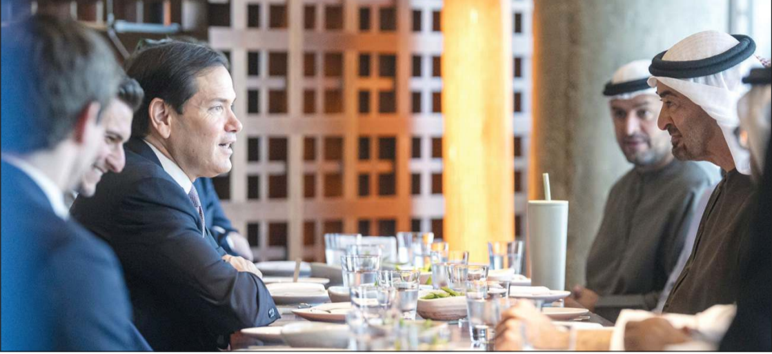
صاحب السمو الشيخ محمد بن زايد آل نهيان رئيس دولة الإمارات العربية المتحدة مستقبلا وزير الخارجية الأميركي ماركو روبيو

عواصم - وكالات: استقبل صاحب السمو الشيخ محمد بن زايد آل نهيان رئيس دولة الإمارات العربية المتحدة وزير الخارجية الأميركي ماركو روبيو، في مسقط جولته إلى منطقة الشرق الأوسط التي تشمل أيضا الكويت والبحرين. وقالت وكالة الأنباء الإماراتية «وام» إن رئيس الدولة بحث مع الوزير الأميركي علاقات التعاون الإستراتيجي والعمل المشترك بين دولة الإمارات والولايات المتحدة والجهود المبذولة لتأمين عبور أمن وكامل عبر مضيق هرمز، وأهمية السلام والاستقرار في المنطقة، مضيفاً أن روبيو «جدد التزام الولايات المتحدة أمن الإمارات» في غضون ذلك، أعلن الرئيس الأميركي أن إيران بلغت الولايات المتحدة بأنها لن تطلب تلقي أي رسوم أو تكاليف من السفن التي تعبر مضيق هرمز.