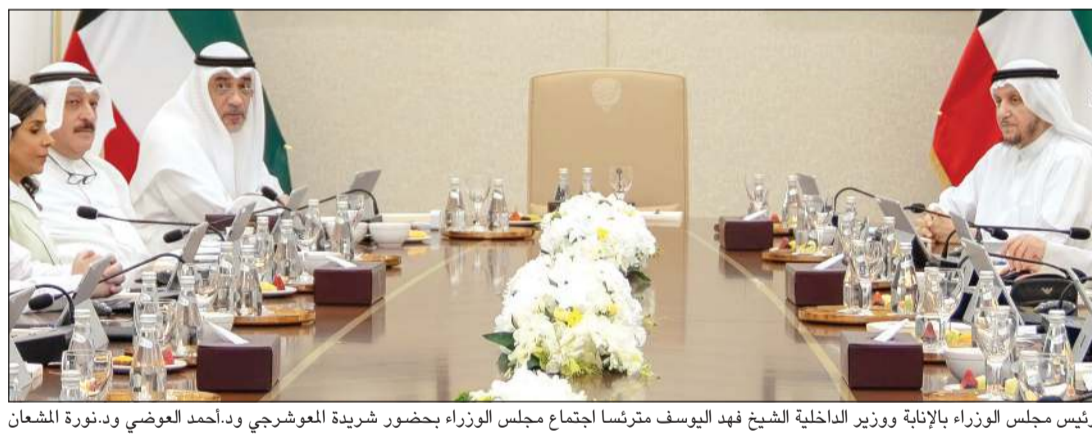
رئيس مجلس الوزراء بالإنابة وزير الداخلية الشيخ فهد اليوسف مترشداً اجتماع مجلس الوزراء بحضور شريدة العوشرجي ود. أحمد العوضي ود. نورة الشعلان

مصيرهم واستعادة الممتلكات الكويتية بما فيها الأرشيف الوطني وذلك باعتبارها من القضايا التي تحظى بأولوية قصوى لدى الكويت لما لها من أبعاد وطنية وإنسانية. من جهة أخرى، استمع المجلس إلى شرح قدمه وزير الخارجية الشيخ جراح الجابر حول الجهود السياسية والديبلوماسية التي تقوم بها وزارة الخارجية وبعثاتها الدبلوماسية في الخارج لمواكبة آخر المستجدات التي تشهدها