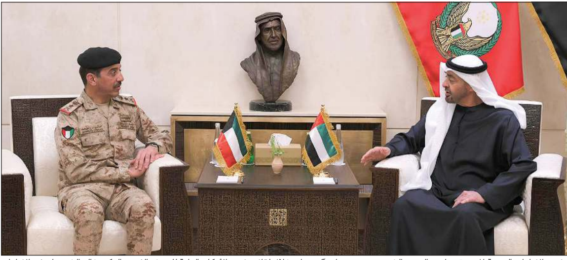
رئيس الإمارات العربية المتحدة صاحب السمو الشيخ محمد بن زايد آل نهيان خلال لقائه رئيس الأركان العامة للجيش الفريق الركن خالد الشريهان في الإمارات