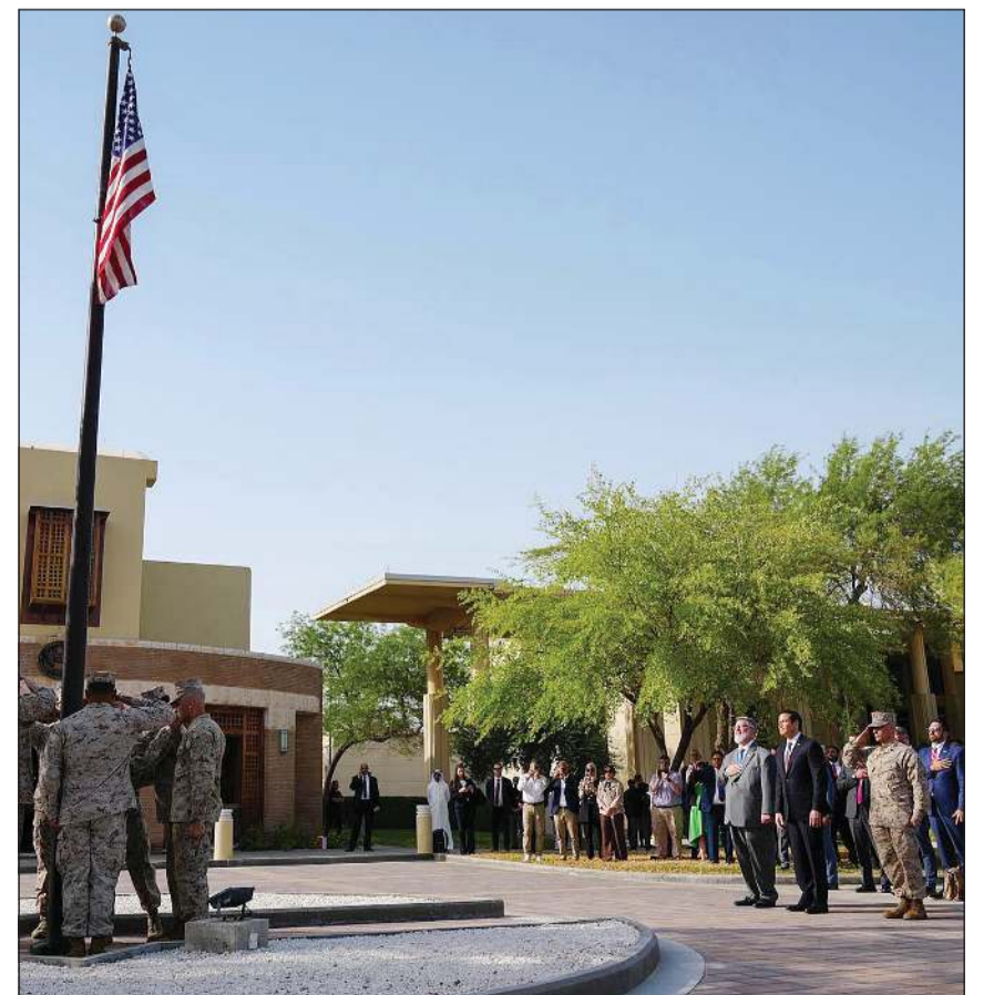
وزير الخارجية الأميركي ماركو روبيو يشهد مراسم رفع علم الولايات المتحدة في السفارة الأميركية لدى الكويت

وتم خلال اللقاء استعراض الشراكة الاستراتيجية الراسخة بين البلدين والشعبين