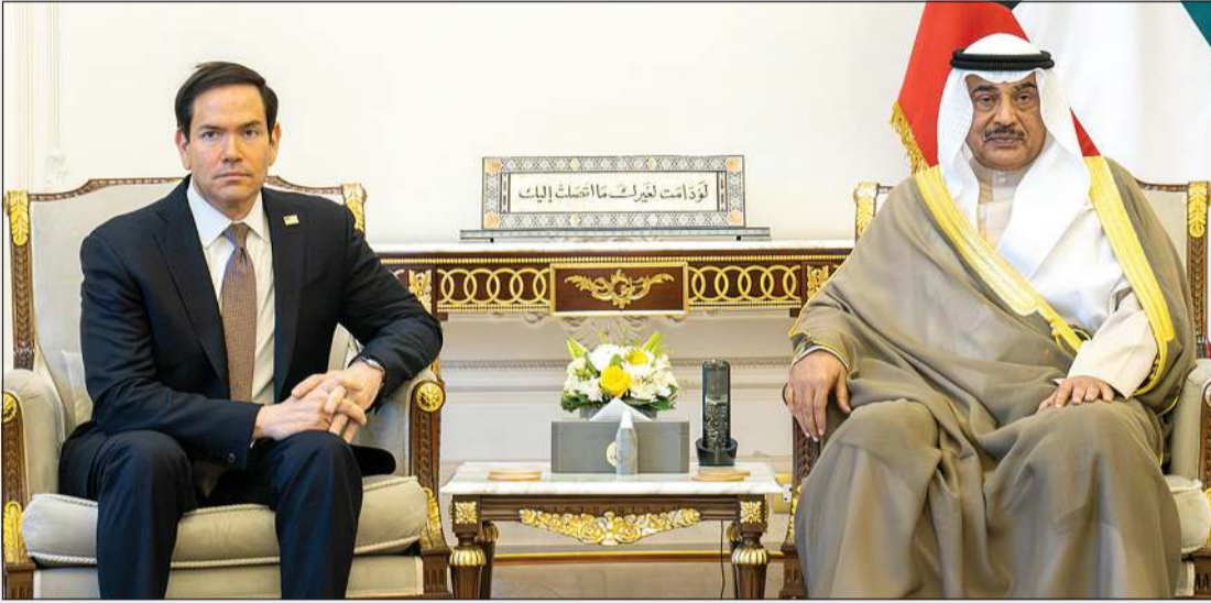
سمو ولي العهد الشيخ صباح الخالد خلال لقائه وزير الخارجية الأميركي ماركو روبيو