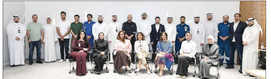
صورة جماعية للمتدربين

نظمت زين الكويت برنامجاً تدريبياً متخصصاً بعنوان «التواصل التنفيذي وأدوات الابتكار لحل التحديات الاستراتيجية»، مجموعة من موظفي شركة البنزول الوطنية الكويتية (KNPC) والشركة الكويتية للصناعات البترولية المتكاملة (KIPIC)، وذلك في إطار دورها كشريك وطني فاعل في تعزيز منظومة الابتكار ونقل المعرفة بين القطاعات الحيوية في الدولة. وهدفت الجلسة إلى تعزيز جسور المعرفة والابتكار مع القيادات الواعدة في القطاع النفطي، حيث أقيمت على مدى يومين في مقر زين بالشويخ، وأشرف عليها سفراء الابتكار في زين بالتعاون مع فريق إدارة القدرات التابع لدائرة التدريب والتطوير الوظيفي في شركة البنزول الوطنية الكويتية، وشارك فيها 20 من المهندسين والمراقبين الأوائل، وذلك ضمن الدورة الرابعة من برنامج إدارة القدرات على مستوى القطاع النفطي الكويتي. وتم تصميم البرنامج خصيصاً للمشاركين في برنامج إدارة القدرات، حيث ركز على نقل الرسائل بشكل مختصر وهدف، وتطوير مهارات العرض