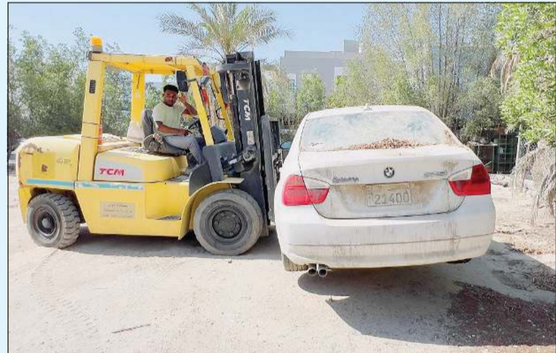
رفع سيارة مهمة

أعلنت إدارة العلاقات العامة في بلدية الكويت موافقة الفرق الميدانية لإدارات النظافة العامة وإشغالات الطرق تكثيف جولاتها التفتيشية لرصد وإزالة مخالفات لاأحتي النظافة وإشغالات الطرق في كل المحافظات وتفعيل الدور الرقابي للأجهزة الرقابية لتطبيق قوانين البلدية.