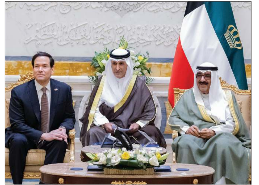
صاحب السمو الأمير الشيخ مشعل الأحمد خلال استقباله وزير الخارجية الأميركي ماركو روبيو

الشبيخة الزين الصباح ووكيل المسؤولين. وأعلنت وزارة الخارجية الأميركية استئناف العمل بسفارة الولايات المتحدة في دولة الكويت بعد أكثر من ثلاثة أشهر من إغلاقها بسبب الحرب في المنطقة.