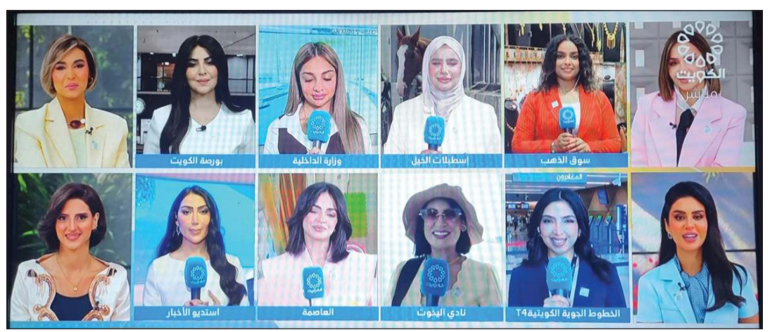
كوكبة من مرسلات البرنامج في مواقع مختلفة بالبلاد

وعرف العميري لدى الجمهور عبر برنامجه «قصة حلم» وقناته المتخصصة في تفسير الأحلام، حيث استطاع على مدى سنوات بناء قاعدة واسعة من المتابعين من خلال تقديم محتوى يهدف إلى تبسيط فهم الرموز والدلالات المرتبطة بالأحلام، مستفيداً