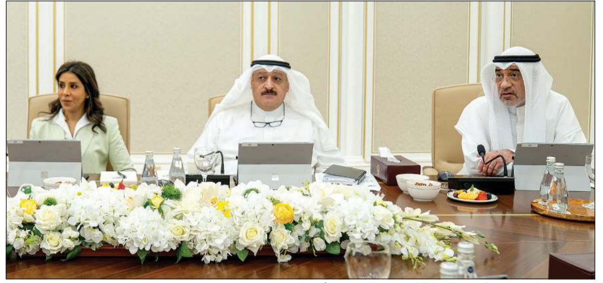
رئيس مجلس الوزراء بالإنابة ووزير الداخلية الشيخ فهد اليوسف ود.أحمد العوضي ود.نورة المشعان

أحيط بتكليف صاحب السمو لسمو ولي العهد بتروؤس وفد الكويت في الدورة الـ 81 للجمعية العامة للأمم المتحدة خلال الفترة من 22 - 28 سبتمبر المقبل