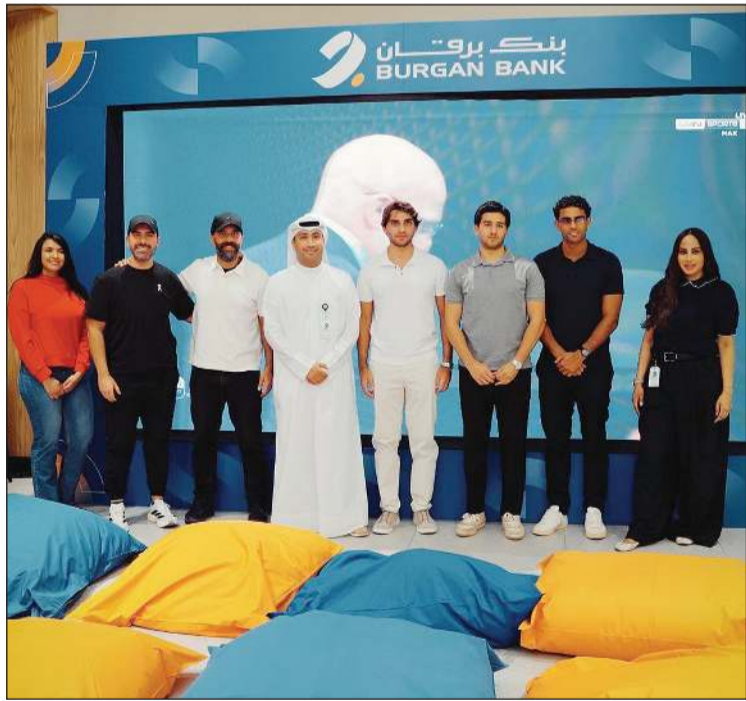
صورة جماعية لفريق بنك برقان والضيوف خلال فعالية كأس العالم 2026