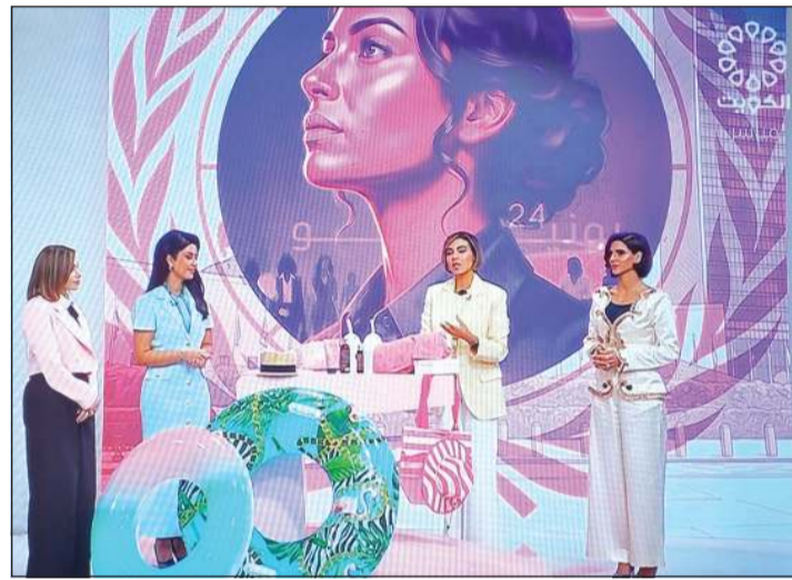
مقدمات برنامج «صباح الخير يا كويت»

التي تضمنتها كانت عن نساء كويتيات مبدعات، حيث تناولت قصص نجاحهن وتجاربهن في العديد من المجالات، من بينها الإعلام والرياضة والعمل المؤسسي والمجتمعي، وسلطة الضوء على إسهاماتهن البارزة ودورهن في تحقيق الإنجازات ورفع اسم الكويت في مختلف المحافل.