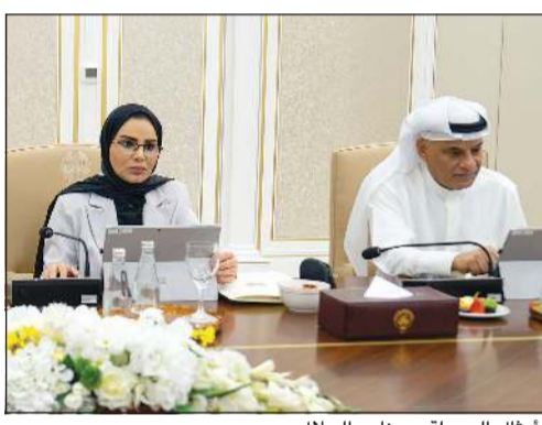
د.أمثال الحويلة ود.نادر الجلال

من جهة أخرى، اطلع مجلس الوزراء على محضر اجتماع اللجنة الوزارية للشؤون الاقتصادية بشأن مشروعات الشراكة بين القطاعين العام والخاص عن الفترة من (أكتوبر 2025 - مارس 2026). وقرر مجلس الوزراء إحالة التقرير إلى اللجنة العليا لمشروعات الشراكة بين القطاعين العام والخاص لاتخاذ ما تراه مناسباً بشأنه في ضوء ما تضمنه من ملاحظات ونتائج، واستعرض مجلس الوزراء عدداً من المواضيع المدرجة على جدول الأعمال والتقارير ومحاضر اللجان الوزارية، وقرر الموافقة عليها، كما قرر إحالة عدد منها إلى اللجان الوزارية المختصة لدراستها ورفع التوصيات المناسبة بشأنها لاستكمال الإجراءات الخاصة بإنجازها.