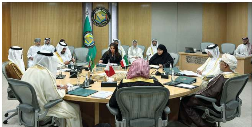
وكيلة وزارة العدل عواطف السند خلال مشاركتها في اجتماع وكلاء وزارات العدل بدول مجلس التعاون الذي عقد بمقر الأمانة العامة للمجلس بالرياض

ظل تعاون قانوني وقضائي محكم. وأكدت السند أهمية دعم أعمال لجان وميري ورؤساء المراكز والمعاهد التدريبية القضائية والقانونية في دول المجلس باعتبار التدريب المتخصص أحد الركائز الأساسية لتطوير الكوادر العدلية وتمكينها من مواكبة المستجدات القانونية والتقنية.