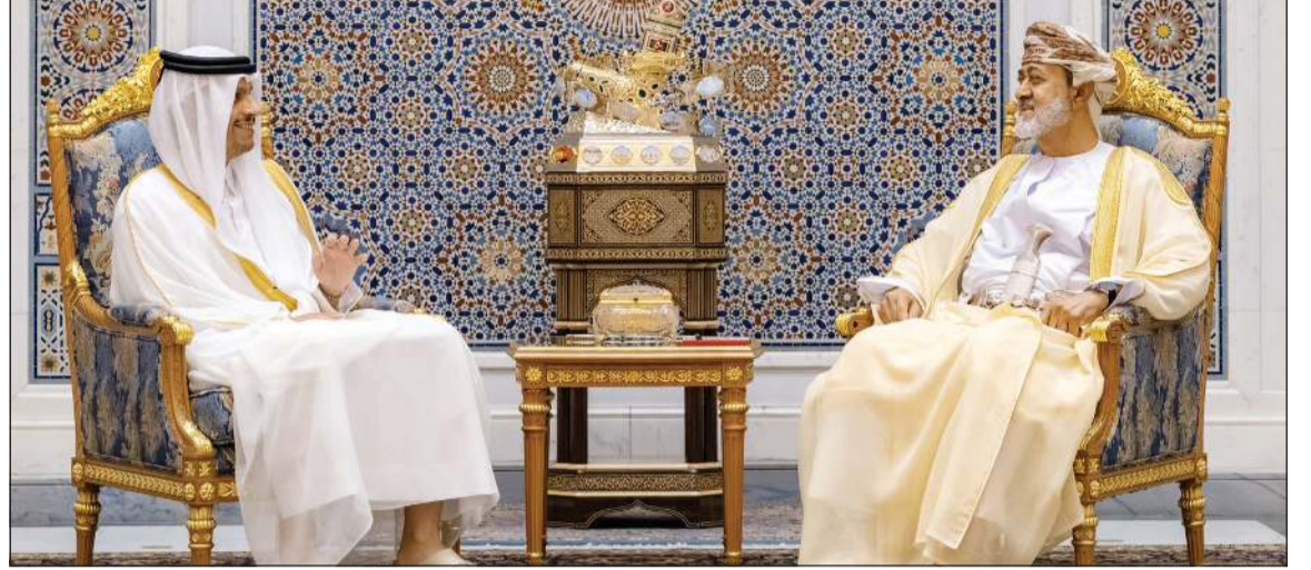
جلالة السلطان هيثم بن طارق سلطان عمان مستقبلا الشيخ محمد بن عبد الرحمن بن جاسم آل ثاني رئيس مجلس الوزراء وزير الخارجية بدولة قطر (أونا)

عواصم - وكالات: استقبل جلالته السلطان هيثم بن طارق سلطان عمان الشيخ محمد بن عبد الرحمن بن جاسم آل ثاني، رئيس مجلس الوزراء وزير الخارجية بدولة قطر، وقالت وكالة الأنباء العمانية (أونا) إن السلطان هيثم بن طارق بحث مع رئيس الوزراء وزير الخارجية القطري مسار المفاوضات الأميركية - الإيرانية الجارية عبر الوساطة الباكستانية - القطرية ومستجدات الجهد الدبلوماسية المبذولة لإنهاء حالة الحرب والتوصل إلى تسوية نهائية للأزمة من جميع جوانبها. وذكرت «أونا» أن سلطان عمان أكد خلال استقباله الشيخ محمد بن عبد الرحمن في قصر البركة بمسقط، ضرورة الدفع بهذه الجهود لتحقيق الأمن والاستقرار في المنطقة وأهمية تكامل المساعي الخيرة التي تبذلها الدول الشقيقة والصديقة في هذا الشأن.