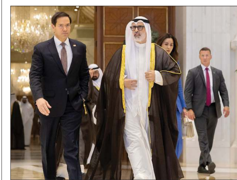
وزير الخارجية الشيخ جراح الجابر خلال لقائه وزير خارجية الولايات المتحدة الأميركية ماركو روبيو

الأمير الشيخ مشعل الأحمد وزير الخارجية الأميركي ماركو روبيو بحضور وزير شؤون الديوان الأميري الشيخ حمد جابر العلي ووزير الخارجية الشيخ جراح الجابر ومدير مكتب صاحب السمو الأمير الفريق متقاعد جمال الذياب