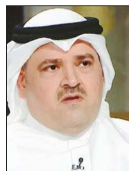
العميد الشيخ حمد اليوسف

متنوعاً، و1423 طلقة. وأوضحت الإحصائية كذلك وفاة 3 أشخاص بسبب تعاطي المواد المخدرة. وأكد مصدر أمني أن جميع المتهمين في القضايا المضبوطة يخضعون لأحكام قانون مكافحة المخدرات والمؤثرات العقلية رقم 159 لسنة 2025، والذي شدد العقوبات على مهربي ومروجي المخدرات ووسع نطاق الإجراءات الرادعة لمواجهة هذه الجريمة.