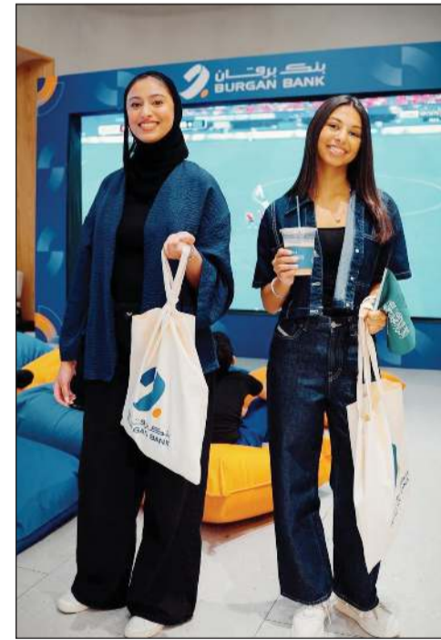
المشاركات بالفعالية في أجواء رياضية مميزة برعاية «برقان»