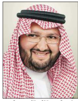
صاحب السمو الملكي الأمير عبدالعزيز بن طلال بن عبدالعزيز آل سعود

أعلن صاحب السمو الملكي الأمير عبدالعزيز بن طلال بن عبدالعزيز آل سعود، رئيس مجلس أمناء الجامعة العربية المفتوحة، افتتاح الجامعة في المملكة المغربية، لتكون الحرم الجامعي العاشر ضمن منظومتها التعليمية الممتدة في الوطن العربي، وذلك خلال الاجتماع (45) لمجلس أمناء الجامعة، الذي عقد عبر الاتصال المرئي بمشاركة أصحاب المعالي والسعادة أعضاء المجلس. ورفع سموه أسمى آيات الشكر والتقدير إلى العاهل المغربي جلالة الملك محمد السادس وحكومته الرشيدة على ما حظيت به الجامعة من دعم وتمكين منذ ولادة فكرة إنشاء الجامعة