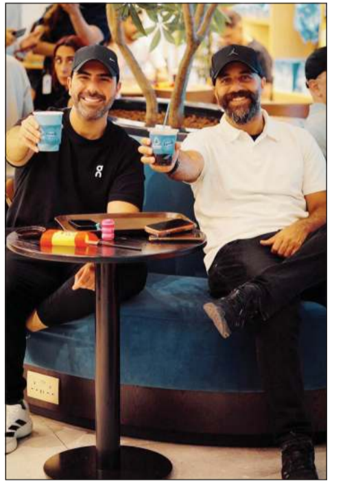
ضيوف البنك مستمتعون في أجواء كأس العالم