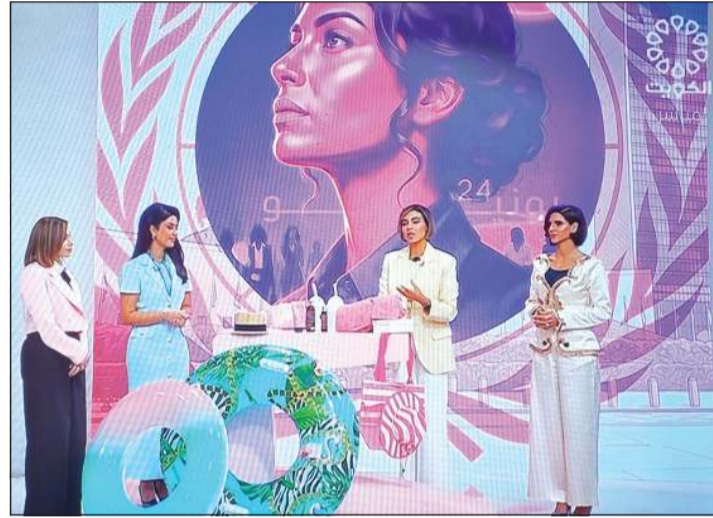
مقدمات برنامج «صباح الخير يا كويت»

التي تضمنتها كانت عن نساء كويتيات مبدعات، حيث تناولت قصص نجاحهن وتجاربهن في العديد من المجالات، من بينها الإعلام والرياضة والعمل المؤسسي والمجتمعي، وسلطة الضوء على إسهاماتهن البارزة ودورهن في تحقيق الإنجازات ورفع اسم الكويت في مختلف المحافل.