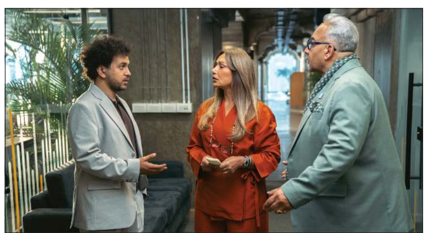
بيومي فؤاد وليلي علوي وأحمد عصام في مشهد من فيلم «ابن مين فيهم»

جميع المسرحيات التي قدمتها في السعودية تم تصويرها بالفعل، لكن قرار عرضها على المنصات أو شاشات التلفزيون يعود إلى الجهات المنظمة وخطط العرض الخاصة بها.