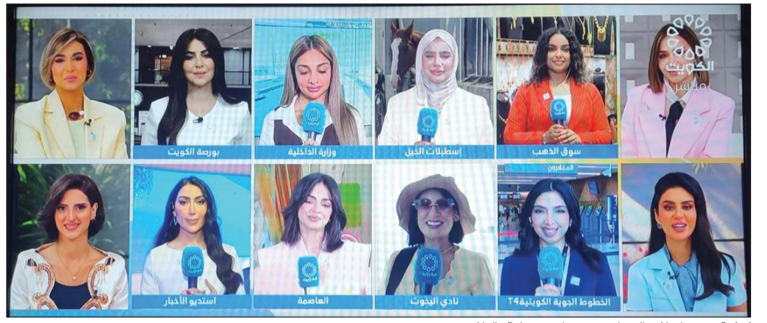
كوكبة من مرسلات البرنامج في مواقع مختلفة بالبلاد

وعرف العميري لدى الجمهور عبر برنامجه «قصة حلم» وقناته المتخصصة في تفسير الأحلام، حيث استطاع على مدى سنوات بناء قاعدة واسعة من المتابعين من خلال تقديم محتوى يهدف إلى تبسيط فهم الرموز والدلالات المرتبطة بالأحلام، مستفيداً