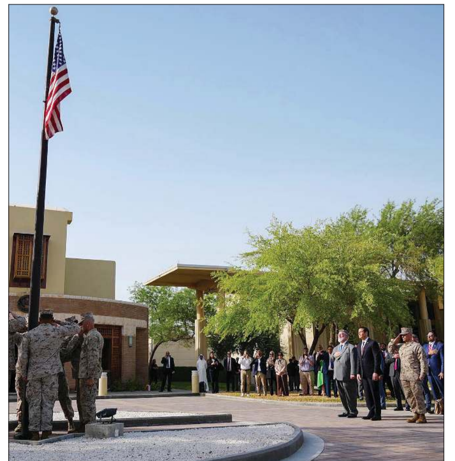
وزير الخارجية الأميركي ماركو روبيو يشهد مراسم رفع علم الولايات المتحدة في السفارة الأميركية لدى الكويت

التقى وزير الخارجية الشيخ جراح الجابر مع وزير خارجية الولايات المتحدة الأميركية الصديقة ماركو روبيو، وذلك بمناسبة الزيارة الرسمية التي يجريها روبيو والوفد المرافق إلى الكويت. وتم خلال اللقاء استعراض الشراكة الاستراتيجية الراسخة بين البلدين والشعبين