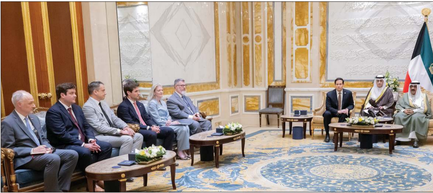
صاحب السمو الأمير الشيخ مشعل الأحمد خلال استقباله وزير الخارجية بالولايات المتحدة الأميركية ماركو روبيو والوفد الرسمي المرافق