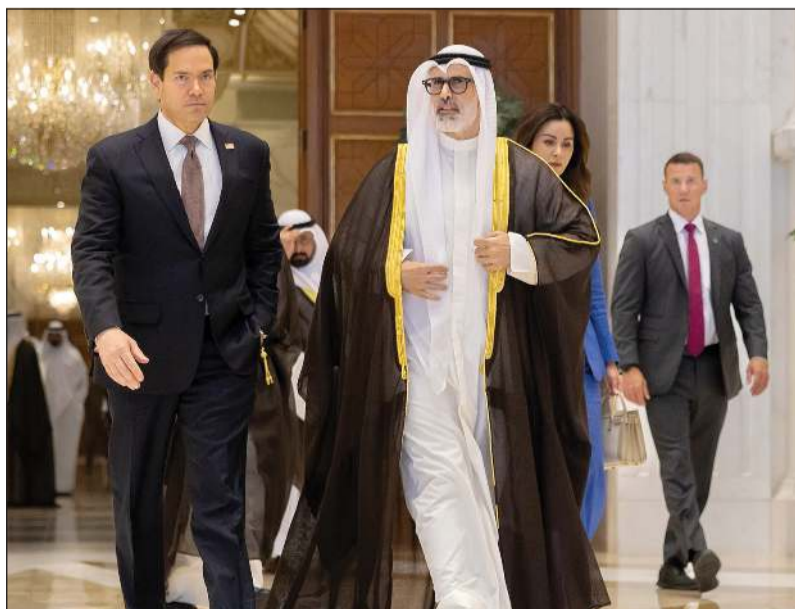
وزير الخارجية الشيخ جراح الجابر خلال لقائه وزير الخارجية بالولايات المتحدة الأميركية ماركو روبيو

وتم خلال اللقاء بحث العلاقات التاريخية الراسخة التي تجمع البلدين والشعبين الصديقين وسبل دعمها وتنميتها على كل الأصعدة وبما يخدم مصالح البلدين الصديقين وقضاياهما المشتركة، كما تم التطرق إلى آخر القضايا على الساحتين الإقليمية والدولية خاصة فيما يتعلق بمستجدات الأوضاع في منطقة الشرق الأوسط واستعراض كل المساعي والجهود التي تسهم في تعزيز أمنها واستقرارها. حضر المقابلة وزير شؤون