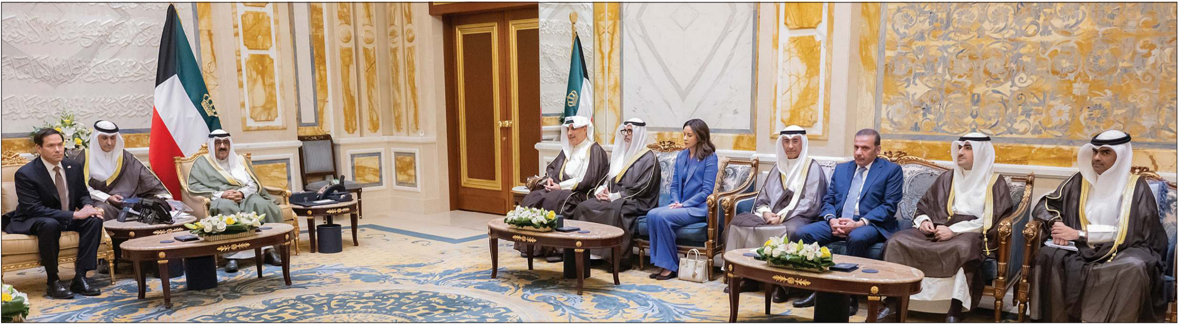
صاحب السمو الأمير الشيخ مشعل الأحمد مستقبلاً وزير الخارجية الأميركي ماركو روبيو بحضور وزير شؤون الديوان الأميري الشيخ حمد جابر العلي ووزير الخارجية الشيخ جراح الجابر ومدير مكتب صاحب السمو الأمير الفريق متقاعد جمال الذياب ووكيل الديوان الأميري الشيخ عبدالعزيز مشعل المبارك ووكيل الشؤون الخارجية بالديوان الأميري مازن العيسى وسفيرتنا لدى الولايات المتحدة الأميركية الشبيخة الزين الصباح

صاحب السمو حمّله تحياته للرئيس الأميركي وتمنى للولايات المتحدة وشعبها كل التطور والنماء