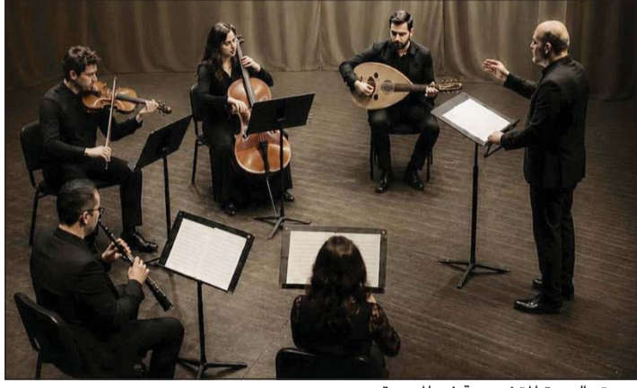
بوستر الدورة المتخصصة في الموسيقى