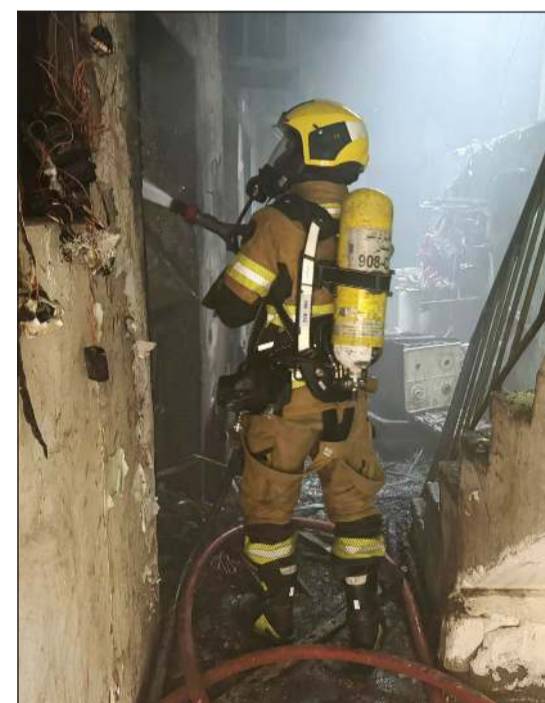
إطفائي يتعامل مع حريق «خيطان»

أسفر حريق منزل عربي في منطقة خيطان عن وقوع إصابتين تم نقلهما إلى مستشفى الفروانية لتلقي العلاج. وكانت قوة الإطفاء العام تلقت بلاغا ظهر أمس عن اندلاع حريق، وعلى الفور تم الإيعاز إلى مركزي إطفاء مراكز الفروانية وصبحان، حيث تمت السيطرة على الحريق واندقاد شخصين تعرضا لإصابات، حيث جرى تسليمهما إلى الطوارئ الطبية، وجرى الوقوف على أسباب الحريق.