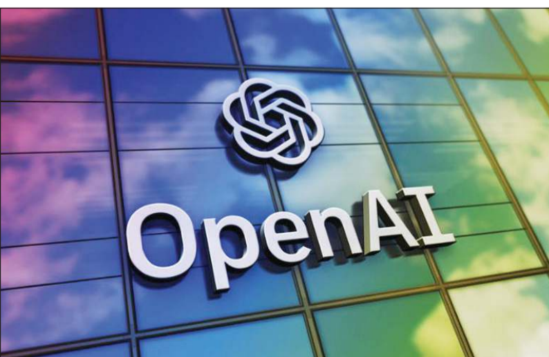
أوين آيه آي

واشنطن - سانا: كشفت شركة OpenAI عن رؤيتها للمرحلة المقبلة من تطور تقنيات الذكاء الاصطناعي، والتي تتمثل في تطوير وكلاء ذكاء اصطناعي شخصيين قادرين على مرافقة المستخدمين ومساعدتهم في مختلف جوانب حياتهم اليومية والمهنية.