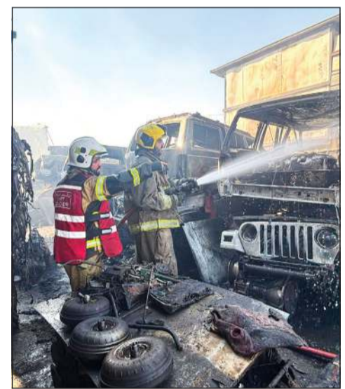
مراكز الشقايا والجھراء الحرفي والقيروان والإسناد تعاملت مع حريق ظهر الجمعة