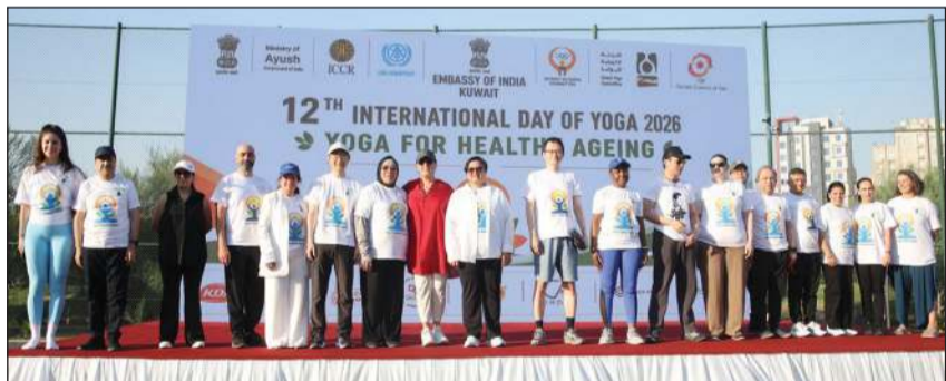
سفيرة الهند لدى الكويت باراميتا تربياني متوسطة عددا من السفراء والدبلوماسيين المشاركين في الفعالية