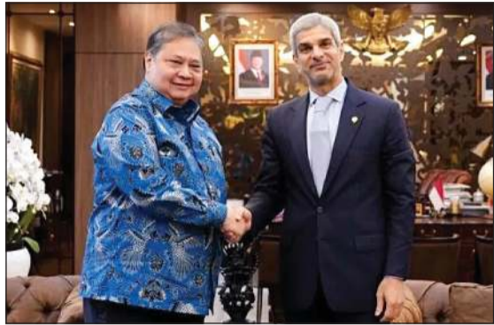
الوزير المنسق للشؤون الاقتصادية الإندونيسية إيرلانغا هارتارتو خلال اللقاء مع سفيرنا لدى إندونيسيا خالد الياشين

وذكر أنه خارج قطاع الطاقة فإن إندونيسيا والكويت تربطان بعدد من مذكرات التفاهم من بينها مذكرة تفاهم بشأن إنشاء لجنة مشتركة وتفاهم للتعاون الاقتصادي والفني وقعت عام 2007 ومذكرة تفاهم للتعاون التجاري وقعت في العام نفسه. ونقل البيان عن السفير الياشين قوله «إن الاتفاقيات المختلفة الموقعة بين الكويت وإندونيسيا تعكس الأهمية الاستراتيجية التي تمثلها إندونيسيا للكويت، وخصوصا في المجال الاقتصادي». وأشار البيان إلى أن الدولتين اتفقتا على أهمية تسريع المفاوضات بشأن اتفاقية التجارة الحرة بين إندونيسيا ومجلس التعاون لدول الخليج العربية مع استهداف إنجازها بحلول نهاية عام 2026.