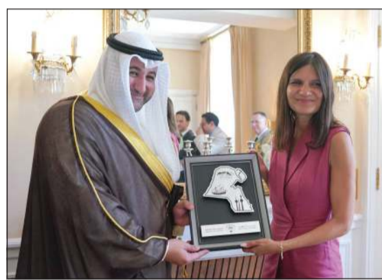
وكيل وزارة الدفاع الشيخ د.عبدالله المشعل خلال اللقاء مع الوزيرة المنتدبة لدى وزير القوات المسلحة وشؤون المحاربين القدامى اليس روفو

الدفاع والوفد المرافق على أحدث ما توصلت إليه الصناعات الدفاعية والتقنيات العسكرية الحديثة المعروضة في المعرض، والتقى ممثلي عدد من الشركات والمؤسسات الدفاعية العالمية المشاركة. وحضر اللقاءات سفيرنا لدى الجمهورية الفرنسية عبدالله الشاهين، ورئيس هيئة التسليح والتجهيز ووكيل الوزارة المساعد للشؤون الفنية بالتكليف العميد خليفة الدعيج، والمحق العسكري الكويتي لدى الجمهورية الفرنسية العميد الركن البحري أسامة محمد حسن. وفي ختام الزيارة، التقى وكيل وزارة الدفاع عددا من منتسبي وزارة الدفاع المتواجدين في الجمهورية الفرنسية لتلقي العلاج، مؤكدا حرص الوزارة على متابعة أوضاعهم الصحية والإطمئنان عليهم بصورة مستمرة، متمنيا لهم الشفاء العاجل وتسام الصحة والعافية.