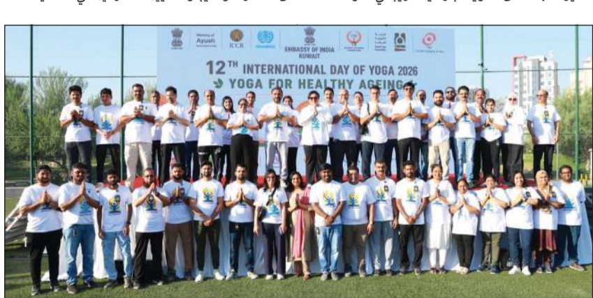
سفيرة الهند لدى الكويت باراميتا تربياني مع المشاركين في اليوم العالمي لليوغا

وتمنت السفيرة الهندية الدعم الذي قدمته الحكومة الكويتية واللجنة الكويتية لليوغا ومؤسسات المجتمع المدني والجهات الراعية والمتطوعون وأبناء الجالية الهندية، مؤكداً أن نجاح الاحتفالات يعكس عمق العلاقات الإنسانية والثقافية بين البلدين الصديقين. واختتمت تصريحها بالتأكيد على أن مشاركة أكثر من 2200 من ممارسي ومحببي اليوغا في الفعالية الرئيسية هذا العام تجسد حجم الاهتمام الذي تحظى به اليوغا في الكويت، والالتزام المتزايد بنمط الحياة الصحي.