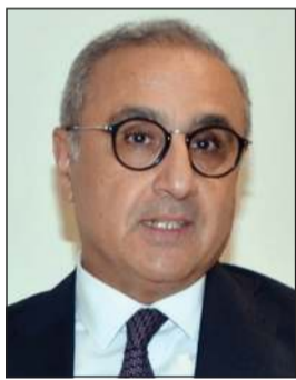
السفير محمد كريم البودالي

بينهم حنبلع المجبري، لكنه أكد في الوقت ذاته أن نجاح المنتخب لا يعتمد على لاعب واحد، بل على العمل الجماعي وروح الفريق والتكامل بين جميع عناصر المنتخب. وأوضح البودالي أن بلوغ الدور الثاني سيكون نتيجة إيجابية تعكس حجم التحضيرات والجهود التي سبقت البطولة، معرباً عن أمله في أن يواصل المنتخب مشواره إلى أبعد مرحلة ممكنة، وفق ما تسمح به ظروف المنافسة. وفيما يتعلق بتوقعاته لنتائج البطولة، رجح السفير التونسي وصول منتخبات فرنسا وإسبانيا والأرجنتين والبرتغال إلى الدور نصف النهائي، لافتاً