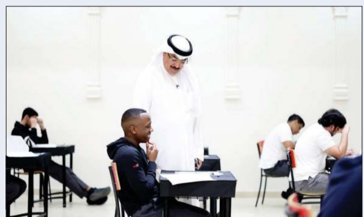
وزير التربية م.سعيد جلال الطبطبائي خلال تفقده إحدى لجان اختبارات الصف الـ 12 للاطلاع على سير الامتحانات

وزير التربية تفقّد عدداً من لجان «الثاني عشر»: الالتزام باللوائح والنظم لضمان المحافظة على نزاهة الامتحانات