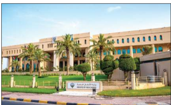
مبنى وزارة الأشغال

استثمارية، إلى جانب 3 فحوصات متقدمة لـ «الكور الخرساني». ويعد هذا الفحص الأخير بمنزلة «الأشعة المقطعية» التي تكشف قوة المبنى القائم بالفعل، حيث يتم استخراج عينات أسطوانية آخذة من قلب الأعمدة أو الأسقف الخرسانية بالموقع، وتسجيل كافة بياناتها فوراً لمنع التداخل.