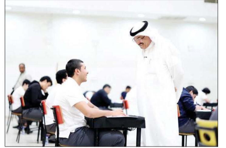
وزير التربية مسيد جلال الطيباني يفتتح لجان امتحانات الصف 12 في سيرة الامتحانات