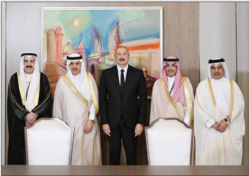
رئيس جمهورية أذربيجان إلهام علييف يتوسط وزير المالية د. يعقوب الرفاعي ووزير المالية في المملكة العربية السعودية محمد الجدعان ووزير المالية في دولة قطر علي الكواري ورئيس مجموعة البنك الإسلامي للتنمية د.محمد الجاسر

على هامش مشاركة دولة الكويت في اجتماع مجلس محافظي البنك الإسلامي للتنمية في العاصمة باكو بجمهورية أذربيجان، استقبل رئيس جمهورية أذربيجان إلهام علييف وزير المالية د. يعقوب الرفاعي، ووزير المالية في المملكة العربية السعودية محمد عبدالله الجدعان، ووزير المالية في دولة قطر علي بن أحمد الكواري، ورئيس مجموعة البنك الإسلامي للتنمية د. محمد الجاسر.