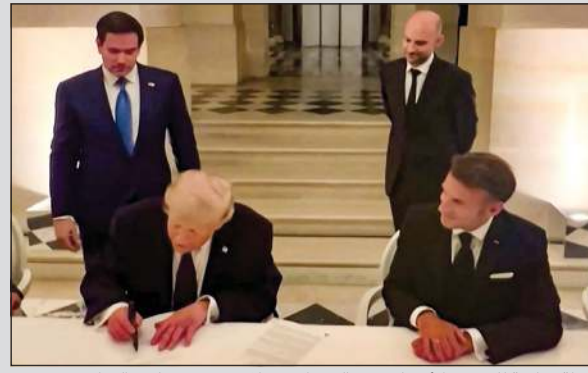
لقطة شاشة للرئيس الأميركي دونالد ترامب خلال توقيع مذكرات التفاهم بحضور الرئيس الفرنسي إيمانويل ماكرون ووزير الخارجية الأميركي ماركو روبيو ووزير الخارجية الفرنسي جان نويل بارو في قصر فرساي

توقيع مذكرة التفاهم الأميركية - الإيرانية رسمياً.. وترامب: إيران لن تمتلك سلاحاً نووياً والعالم سيكون آمناً