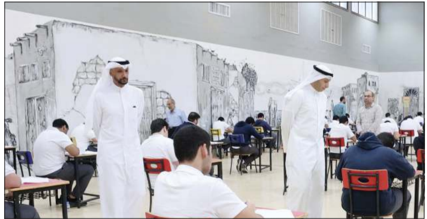
وكيل وزارة التربية د. خالد الرشيد ووكيل المساعد للشؤون التعليمية م. حمد الحمد خلال الجولة التفقدية

قام وكيل وزارة التربية د.خالد الرشيد، يرافقه الوكيل المساعد للشؤون التعليمية م.حمد الحمد، بجولة تفقدية شملت عدداً من لجان الامتحانات النهائية، حيث زارا مدرسة جابر المبارك التابعة لمنطقة العاصمة التعليمية، ومدرسة الإمام مالك الثانوية للبنين التابعة لمنطقة مبارك الكبير التعليمية، للاطلاع على سير الامتحانات ومتابعة الإجراءات التنظيمية المتبعة داخل اللجان.