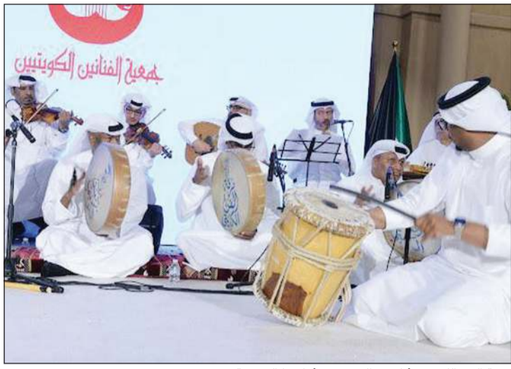
فرقة الفن الكويتي أطربت الحضور بأغانها الشعبية