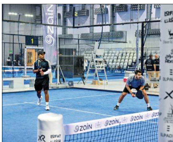
البطولة عكست النمو السريع لرياضة البادل في المنطقة