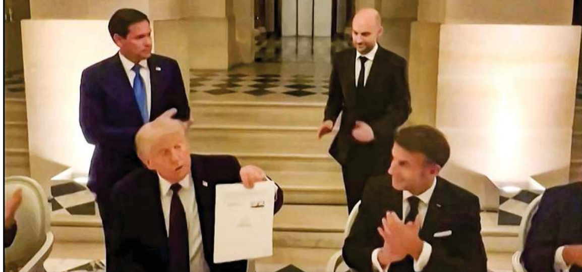
لقطة شاشة من فيديو من حساب نائب رئيس أركان البيت الأبيض دان سكافينو للرئيس الأميركي دونالد ترامب يعرض مذكرة التفاهم بعد توقيعها بحضور الرئيس الفرنسي إيمانويل ماكرون ووزير الخارجية الأميركي ماركو روبيو ووزير الخارجية الفرنسي جان نويل بارو في قصر فرساي

الحميدة الرامية إلى تعزيز الأمن والاستقرار الإقليمي، والتوصل إلى حلول مستدامة للقضايا العالقة عبر الحوار والوسائل السلمية، بما يتوافق مع مبادئ القانون الدولي وحسن الجوار ويسهم في فتح آفاق جديدة للتعاون والتنمية والأزدهار وبحقق المصالح المشتركة لشعوب المنطقة والعالم.