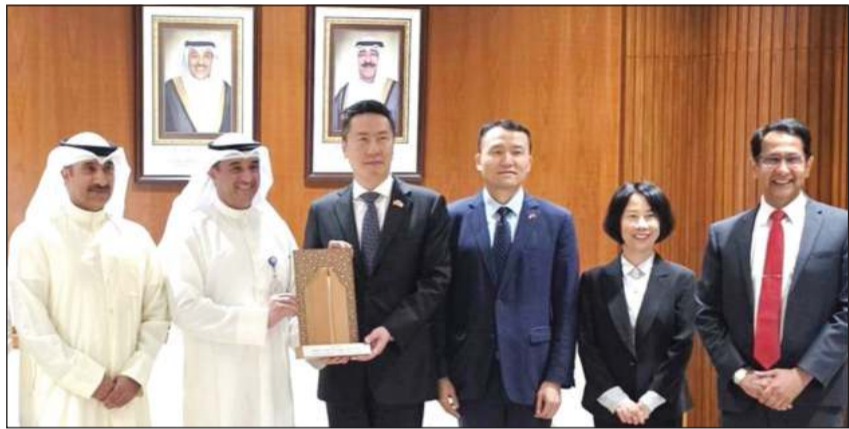
مدير عام الهيئة العامة للتعليم التطبيقي والتدريب د.حسن الفجاء مستقبلا سفير الصين يانغ شين ونائب رئيس البعثة المستشار ليو شيانغ والسكرتير الأول يانغ يانلينغ والملحق الديبلوماسي تشن هاوانان

المستقبل مدير عام الهيئة العامة للتعليم التطبيقي والتدريب د.حسن الفجاء مستقبلا سفير الصين يانغ شين ونائب رئيس البعثة المستشار ليو شيانغ والسكرتير الأول يانغ يانلينغ والملحق الديبلوماسي تشن هاوانان، ناقشا سبل تعزيز التعاون المشترك بين الجانبين، وفي ختام اللقاء، أكد الجانبان أهمية مواصلة التنسيق والتعاون المشترك، بما يعزز العلاقات الثنائية ويفتح آفاقا جديدة للشراكات التعليمية والتدريبية التي تخدم أهداف التنمية في البلدين الصديقين.