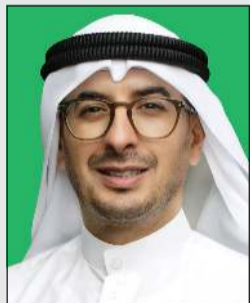
الشيخ أحمد الدجيج

ارتفاع الأرباح التشغيلية قبل المخصصات بنسبة 10.2% لتصل إلى 30.2 مليون دينار