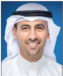
الشيخ نواف السعود

عملاتها لضمان أن يكون الانتقال إلى الكميات التعاقدية الكاملة سلساً وفعالاً ووفقاً للاتفاقيات ذات الصلة. وكان الرئيس التنفيذي لمؤسسة البترول الكويتية الشيخ نواف السعود قد صرح لوكالة بلومبرغ بأن الإصلاحات التي نفذتها الكويت تنتج لها تعزيز الإنتاج إلى مستويات ما قبل الحرب بوتيرة أسرع مما كان يعتقد سابقاً. وتابع: «مع توافر الشحن التجاري الدولي للوصول إلى الموانئ الكويتية، قد نتمكن من العودة إلى مستويات إنتاج ما قبل الحرب في غضون أسابيع».