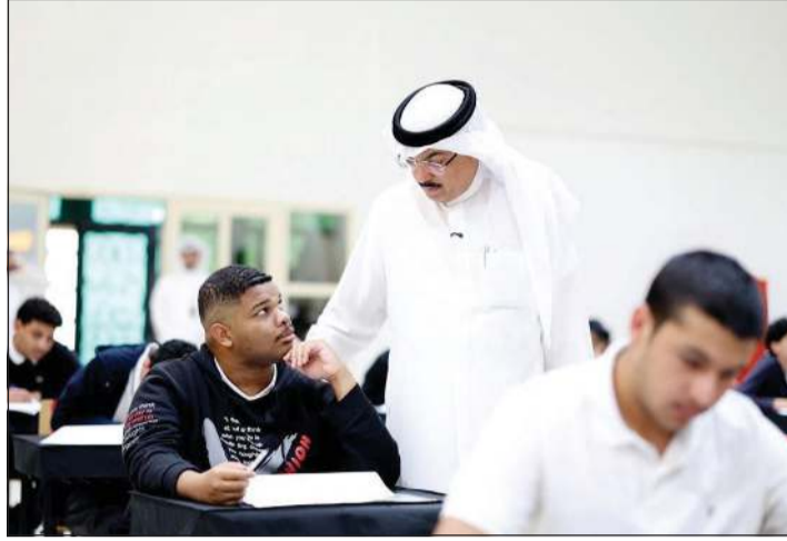
وزير التربية مسيد جلال الطيباني يفتتح لجان امتحانات الصف 12 في سيرة الامتحانات