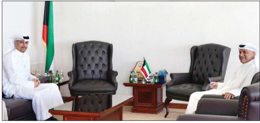
وزير التعليم العالي والبحث العلمي د.نادر الجلال خلال اللقاء مع وزير الدولة لشؤون الشباب والرياضة د.طارق الجلاهمة

وزير التعليم العالي والبحث العلمي د.نادر الجلال خلال اللقاء مع وزير الدولة لشؤون الشباب والرياضة د.طارق الجلاهمة، ناقشا سبل تعزيز قدراتهم وصقل مهاراتهم، بما يتوافق مع احتياجات سوق العمل ومتطلبات المستقبل، ممثنا التعاون مع وزارة الدولة لشؤون الشباب والرياضة. كما تناول اللقاء عددا من الموضوعات ذات الاهتمام المشترك، وبحث سبل تعزيز المبادرات والبرامج التي تسهم في تمكين الشباب الكويتي أكاديميا ومهنيًا، وتوسيع آفاق مشاركتهم في مختلف المجالات التنموية.