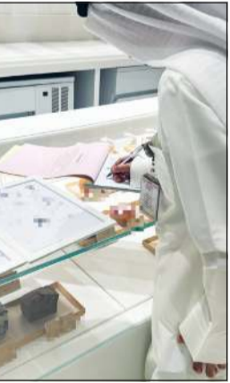
جانب من تحرير المخالفات

أعلنت إدارة العلاقات العامة عن حملات ميدانية للفرق الرقابية في إدارات التدقيق ومتابعة خدمات البلدية في جميع المحافظات للكشف على التراخيص الصحية للمحلات وتراخيص الإعلانات واتخاذ الإجراءات الرقابية بحق المخالفين والتأكد من مدى الالتزام بالاحتياجات والإعلانات وجميع أشطتها. وأكدت أن الحملة الميدانية الرابعة في محافظة حولي أسفرت عن تحرير 11 مخالفة إقامة إعلان من دون ترخيص إضافة إعلان دون ترخيص وعدم تجديد ترخيص الإعلان في منطقتي الجارية والسالمية. وأشارت إلى أن الحملة الرابعة ستستبعد عدة جولات ميدانية في جميع المحافظات حسب جدول زمني متضمنا مواعيد الحملات الميدانية الذي تم إعداده من قبل فريق إدارة العلاقات العامة بالتنسيق مع الإدارات المعنية لتنفيذ هذه الحملات طوال الأسابيع المقبلة.