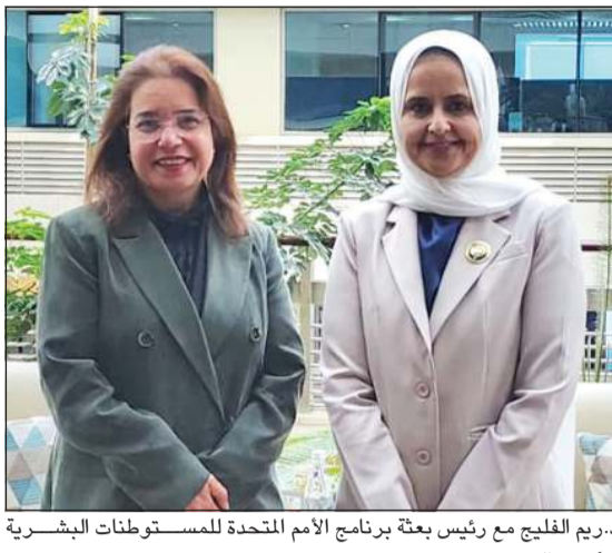
دريم الفليج مع رئيس بعثة برنامج الأمم المتحدة للمستوطنات البشرية د.أميرة الحسن