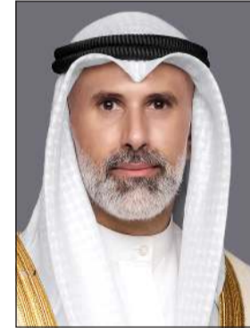
وزير الخارجية الشيخ جراح الجابر

اعتمد وكيل وزارة الصحة الشيخ د.سلمان خليفة الصباح ضوابط الزيارة ومرافقة المرضى وتطبيق ساعات الهدوء في الأقسام الداخلية للمرضى المنومين بالمستشفيات والمراكز التخصصية. وجاء في الضوابط التي تنشرها «الأنباء» أن يتولى مديرو المستشفيات ورؤساء