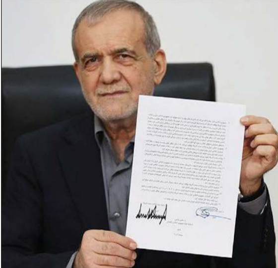
الرئيس الإيراني مسعود بزشكيان يعرض مذكرة التفاهم بعد توقيعها

وأفادت الخارجية الروسية بأن الوزير سيرغي لافروف أبلغ نظيره الإيراني عباس عراقجي في اتصال هاتفى بأن موسكو «تدعم التفاهمات التي تم التوصل إليها نتيجة للوساطة الفاعلة من قبل باكستان وقطر لخفض التوترات في المنطقة»، مضيفة أنه «تم التركيز على أهمية التزام كل الأطراف الضالعين في النزاع المسلح، بمن فيهم إسرائيل»، من جانبها، اعتبرت إسبانيا أن المذكرة تمثل فرصة لإعادة فتح مسار الدبلوماسية وخفض التوترات الإقليمية. وقال وزير الخارجية الإسباني خوسيه مانويل ألباريس في كلمة ألقاها خلال مشاركته في المنتدى الاقتصادي والاجتماعي المتوسطي الثالث بمدينة (برشلونة) أن توقيع المذكرة بين الجانبين «خبر جيد» من شأنه أن يضمن حرية الملاحة في مضيق هرمز بشكل آمن ومن دون أي رسوم أو قيود. واعتبر الباريس أن المذكرة تفتح الطريق أمام الحوار والتفاوض بشأن القضايا العالقة بين الأطراف بما في ذلك معالجة الملف النووي الإيراني، مشيراً إلى أن شأنها أيضاً المساهمة في احتواء أعمال العنف التي شهدتها المنطقة خلال الفترة الماضية وفتح باب للسلام والاستقرار. في السياق، قال مصدر دبلوماسي لـ «اكسيوس» إن المناقشات بشأن تسريع الجدول الزمني هدفت إلى فتح مضيق هرمز قبل يوم الجمعة، نظراً لاتفاق الطرفين على هذه المسألة، وأكد أن اجتماع وفدي أميركا وإيران قائم الجمعة في سويسرا حتى لو تم تقديم موعد توقيع مذكرة التفاهم.