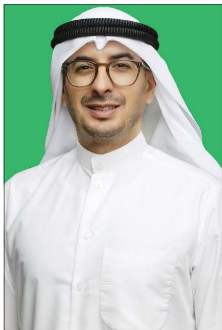
الشيخ أحمد الدعيج

أشار الشيخ أحمد الدعيج أن البنك يواصل تحقيق إنجازات سريعة ومتقدمة في رحلة التميز الرقمي، مع تعزيز منصفاته الرقمية وإطلاق خدمات مبتكرة للعملاء، وهو ما يعكس التزام البنك بتقديم