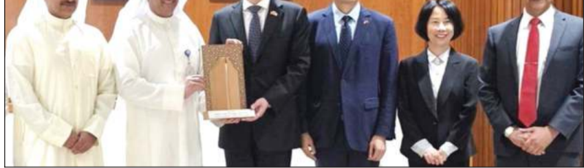
مدير عام الهيئة العامة للتعليم التطبيقي والتدريب د.حسن الفجاء مستقبلاً سفير الصين يانغ شين ونائب رئيس البعثة المستشار ليو شيانغ والسكرتير الأول يانغ يانغينغ والملحق الديبلوماسي تشن هاوانان

استقبل مدير عام الهيئة العامة للتعليم التطبيقي والتدريب د.حسن الفجاء سفير جمهورية الصين الشعبية لدى الكويت يانغ شين، في لقاء عكس عمق العلاقات الثنائية وتطلعات الجانبين لتوسيع آفاق التعاون المشترك، بحضور المستشار ليو شيانغ نائب رئيس البعثة بالسفارة الصينية، وليانغ يانغينغ السكرتير الأول وتشن هاوانان الملحق الديبلوماسي. وأكد الفجاء خلال اللقاء أن الهيئة تواصل توسيع آفاقها مع الشراكات العالمية عبر الصين، بما يجسد توجهها الاستراتيجي نحو الانفتاح على التجارب الرائدة في مجالات التعليم التطبيقي والتدريب التقني والمهني، وبناء جسور تعاون فاعلة مع المؤسسات الصينية المرموقة تعزز من حضور الهيئة على الساحة الدولية. وتناول اللقاء بحث سبل تعزيز التعاون المشترك بين الهيئة والجامعات والشركات الصينية، لاسيما في مجالات التعليم والتدريب التقني والمهني، والبرامج الأكاديمية والتدريبية المتطورة التي تلبي متطلبات سوق العمل وتواكب أحدث التطورات التكنولوجية. وفي هذا الإطار، قدمت الهيئة عرضاً تعريفياً شاملاً استعرضت من خلاله برامجها الأكاديمية والتدريبية، وأعداد طلبتها ومدربيها، والتخصصات التي تطرحها كليتها ومعاهدها، إلى جانب جهودها المتواصلة في تطوير منظومة التعليم والتدريب وتعزيز جودة مخرجاتها بما يتماشى مع المعايير العالمية. كما استعرض الفريق الصيني عدداً من التجارب الناجحة للشراكات والتعاون بين المؤسسات التعليمية والتدريبية في دول الشرق الأوسط ونظيراتها في جمهورية الصين، حيث جرى بحث فرص الاستفادة من هذه التجارب وتوسيع آفاق التعاون