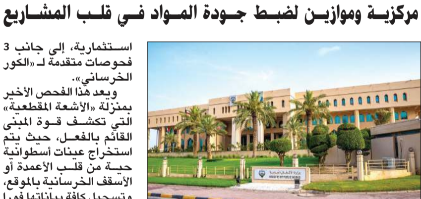
مبنى وزارة الأشغال

استثمارية، إلى جانب 3 فحوصات متقدمة لـ «الكور الخرسانتي». ويعد هذا الفحص الأخير بمنزلة «الأشعة المقطعية» التي تكشف قوة المبنى القائم بالفعل، حيث يتم استخراج عينات أسطوانية آخذة من قلب الأعمدة أو الأسقف الخرسانية بالموقع، وتسجيل كافة بياناتها فوراً لمنع التداخل. وتنقل هذه العينات مباشرة إلى «مختبر الخرسانة» لاستكمال إجراءات التحضير، حيث تخضع لعملية معالجة مائية وحرارية مكثفة تستمر لـ 48 ساعة متواصلة، وهذه المعالجة لأجهزة تسخير رئيسية و20 جهازاً فرعياً، لضمان أن تظل لغة الأرقام في المختبر دقيقة بنسبة 100٪ عند إصدار التقارير الهندسية. وفي الشق المتعلق بالمباني الاستثمارية والتجارية، نفذ القسم 5 كشوفات إنشائية كاملة على شريان البناء في البلاد، نفذ مهندسو القسم 166 عملية معاينة للخلاطات المركزية والموازين الإضافية في مختلف مواقع العمل والمصانع، وهذه المعاينة الدقيقة تضمن أن نسب الرمل، والأسمنت، والماء، والمواد الكيميائية المضافة تخلط بمقاييس ميكرومترية لا تقبل الخطأ، مما يمنع إنتاج «خرسانة ضعيفة» قد تهدد سلامة المباني مستقبلاً، ويقطع الطريق أمام أي محاولات للغش التجاري.