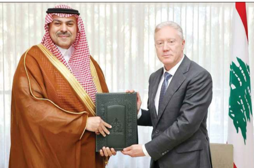
وزير الخارجية يوسف رجي يتسلم أوراق اعتماد سفير خادم الحرمين الشريفين المعين لدى لبنان فهد بن عبدالرحمن الدوسري

قفز إلى واجهة الاهتمام اللبناني المثقل بالملفات، تقديم سفير خادم الحرمين الشريفين، المعين لدى لبنان فهد بن عبدالرحمن الدوسري أوراق اعتماده إلى وزير الخارجية والمغتربين يوسف رجي سفيروا للمملكة العربية السعودية في بيروت. وكان اللقاء مناسبة لاستعراض عمق العلاقات الثنائية بين البلدين وأفاقها، والتأكيد على متانتها، بحسب بيان لوزارة الخارجية.