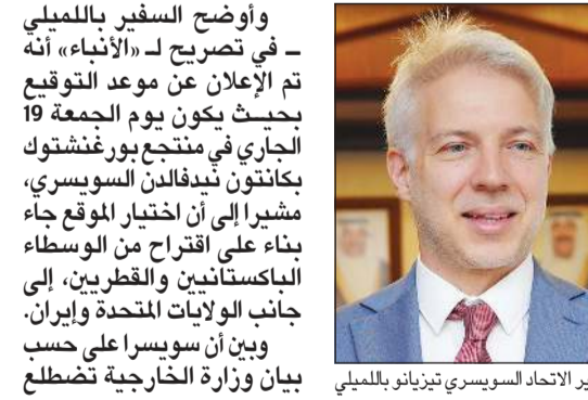
سفير الاتحاد السويسري تيزيانو باللميلي

وأوضح السفير باللميلي - في تصريح لـ «الأنباء» أنه تم الإعلان عن موعد التوقيع بحيث يكون يوم الجمعة 19 الجاري في منتجع بورغنشتوك بكانتون نيودالين السويسري، مشيراً إلى أن اختيار الموقع جاء بناء على اقتراح من الوسطاء الباكستانيين وقطريرين إلى جانب الولايات المتحدة وإيران. وبين أن سويسرا على حسب بيان وزارة الخارجية تضطلع