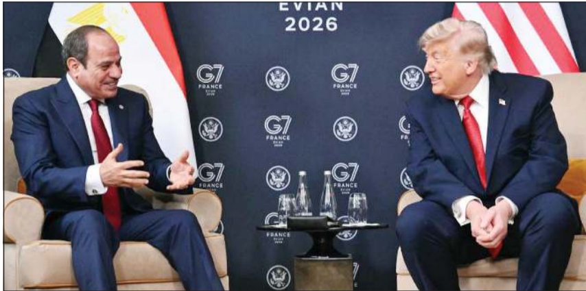
الرئيسان الأميركي دونالد ترامب والمصري عبدالفتاح السيسي يعقدان اجتماعًا ثانيًا على هامش قمة مجموعة السبع في إيفيان الفرنسية.

كما تطرقا إلى الاتفاق الإيراني الأخير لوقف الحرب في الشرق الأوسط. وهدد ترامب إيران باستئناف العمليات العسكرية في حال عدم التزامها بتعهداتها، وذلك قبل يومين من توقيع المرتقب على مذكرة التفاهم التي توصل إليها البلدان لإنهاء الحرب في الشرق الأوسط.