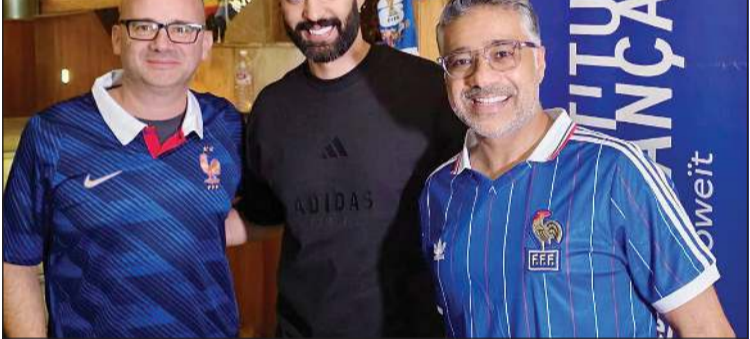
السفير الفرنسي أوليفييه غوفان ومهند يوسف عبدالرحمن خلال متابعة أحداث المباراة

أعرب سفير الجمهورية الفرنسية لدى دولة الكويت أوليفيه غوفان عن تهنئته للمنتخب الفرنسي بمناسبة فوزه المقنع في مباراته الافتتاحية بكأس العالم، مشيداً بالأداء المتميز الذي قدمه اللاعبون والروح الجماعية التي أظهرتها كتيبة «الديوك». وقال السفير غوفان: «أهنئ المنتخب الفرنسي على هذا الانتصار المستحق في مستهل مشواره بالمونديال. لقد جسّد الهذيان التاريخيان لكيليان مبابي، اللذان جعلاه الهدف التاريخي لمنتخب فرنسا برصيد 58 هدفاً دولياً، إلى جانب هدف براندلي باركولا، حجم الموهبة والإصرار والروح الجماعية التي يتمتع بها المنتخب الفرنسي».