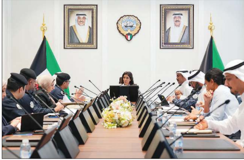
وزيرة الأشغال، م.نورة المشعان خلال مشاركتها في لجنة وزراء النقل والواصلات بدول مجلس التعاون

الأعضاء إلى تزويد الأمانة العامة بكافة البيانات والمعلومات والدراسات والمعلومات التي تدعم إعداد الدراسة الشاملة الخاصة بتعزيز التكامل اللوجستي الخليجي إضافة إلى تزويدها بالإجراءات والخطوات العملية التي تم اتخاذها لتنفيذ التوجيهات السامية المتعلقة بمشروع سكة حديد دول مجلس التعاون. وأكدت اللجنة في ختام اجتماعها أن تعزيز منظومة النقل والخدمات اللوجستية الخليجية يمثل ركيزة أساسية لدعم التنمية الاقتصادية المستدامة وتعزيز التنافسية الإقليمية وترسيخ التكامل بين دول مجلس التعاون بما يحقق طموحات قادة وشعوب دول المجلس نحو مزيد من الترابط والأزدهار المشترك.