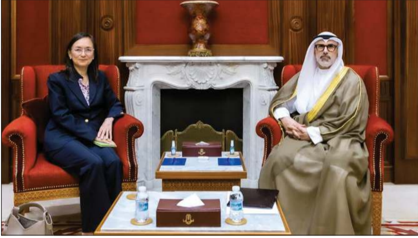
وزير الخارجية الشيخ جراح الجابر مستقبلا الممثلة العليا للأمين العام للأمم المتحدة ماري ياماشيتا

وذلك باعتبارها من القضايا التي تحظى بأولوية قصوى لدى دولة الكويت لما لها من أبعاد وطنية وإنسانية.