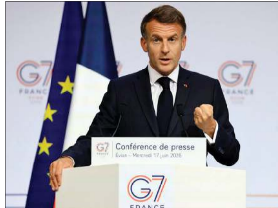
الرئيس الفرنسي إيمانويل ماكرون متحدًا في مؤتمر صحفي في ختام قمة مجموعة السبع «G7».

أشاد الرئيس الفرنسي إيمانويل ماكرون بالموقف الموحد في قمة مجموعة السبع «G7»، التي استضافتها مدينة إيفيان الفرنسية بعد أشهر من «التباينات»، وقال في مؤتمر صحفي في اليوم الأخير من القمة إنها: «عقدت في ظروف معقدة وشهدت اختلافات وتباينات في وجهات النظر» وأضاف: «نحن جازمون للمساهمة في عملية إزالة الألغام» وبدلة لمضيق هرمز لإخراج النفط والغاز من الشرق الأوسط. وعلى هامش القمة التقى الرئيس الأميركي دونالد ترامب الرئيس المصري عبدالفتاح السيسي، حيث تناولوا العلاقات الثنائية وقضية سد النهضة،