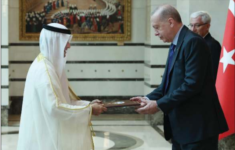
الرئيس التركي رجب طيب أردوغان يتسلم أوراق اعتماد سفيرنا لدى تركيا محمد الشبو

إسطنبول - كونا: قدم سفيرنا لدى الجمهورية التركية محمد الشبو أوراق اعتماده للرئيس التركي رجب طيب أردوغان خلال مراسم عقدت بالقصر الرئاسي بالعاصمة أنقرة. وندرت سفارتنا في أنقرة في بيان صحفي أن السفير الشبو نقل خلال مراسم تقديم أوراق الاعتماد صاحب السمو الأمير الشيخ مشعل الأحمد وسمو ولي العهد الشيخ صباح الخالد إلى أخيهما الرئيس التركي رجب طيب أردوغان.