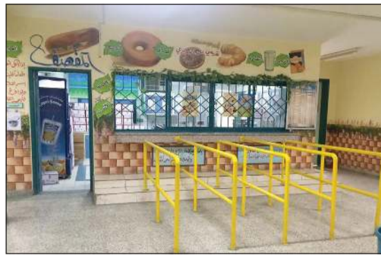
صورة أرشيفية لأحد المقاصف المدرسية

التجارية للمدرسة بالإضافة إلى رخصة من قوة الإطفاء العام على مواقع بيع أو تحضير أو تصنيع لأي نشاط إضافي داخل مبنى المدرسة، لافتة إلى ضرورة الإطلاع على قائمة المنتجات الغذائية المسموح طرحها داخل المقصف المدرسي، شريطة أن تكون مطابقة لقائمة المنتجات الغذائية والاشتراطات الموضحة في بنود لائحة المقاصف المدرسية.