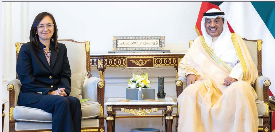
سمو ولي العهد الشيخ صباح الخالد مستقبلا الممثلة العليا للأمين العام للأمم المتحدة ماري ياماشيتا

مجلس الوزراء أحيط علماً بفحوى الرسالة الخطية الموجهة إلى صاحب السمو من رئيس أرمينيا والمتضمنة دعوة سموه للمشاركة بقمة القادة 16 أكتوبر المقبل