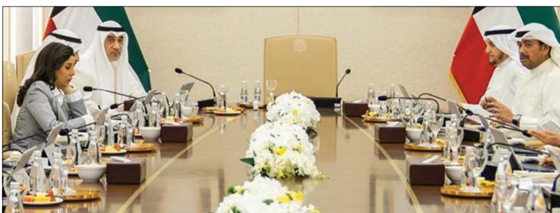
رئيس مجلس الوزراء بالإنابة ووزير الداخلية الشيخ فهد اليوسف مترشحا لاجتماع مجلس الوزراء

التواصل إلى هذا التفاهم المهم. وجد دعم دولة الكويت لكل الجهود الرامية إلى تسوية الخلافات والنزاعات بالوسائل السلمية ووفقاً لمبادئ القانون الدولي وميثاق الأمم المتحدة، معرباً عن تطلع دولة الكويت إلى أن يشكل هذا التفاهم خطوة مهمة نحو مقاربات أوسع لمعالجة القضايا العالقة عبر حلول مستدامة من شأنها ترسيخ مبادئ حسن الجوار وتعزيز الثقة وعدم التدخل في الشؤون الداخلية للدول وعدم