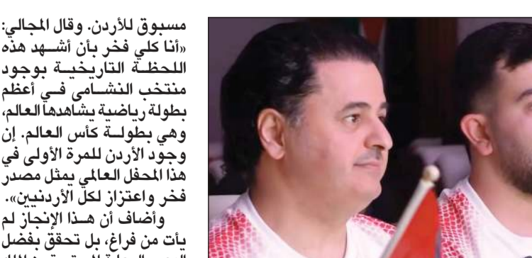
سفير المملكة الأردنية لدى البلاد ستان المجالي يتابع أحداث المباراة

من جهته، أعرب سفير المملكة الأردنية الهاشمية لدى دولة الكويت ستان المجالي عن فخره واعتزازه بتماهل المنتخب الأردني لكرة القدم «النشامي» إلى نهائيات كأس العالم، مؤكداً أن هذه المشاركة تمثل لحظة تاريخية وإنجازاً وطنياً غير