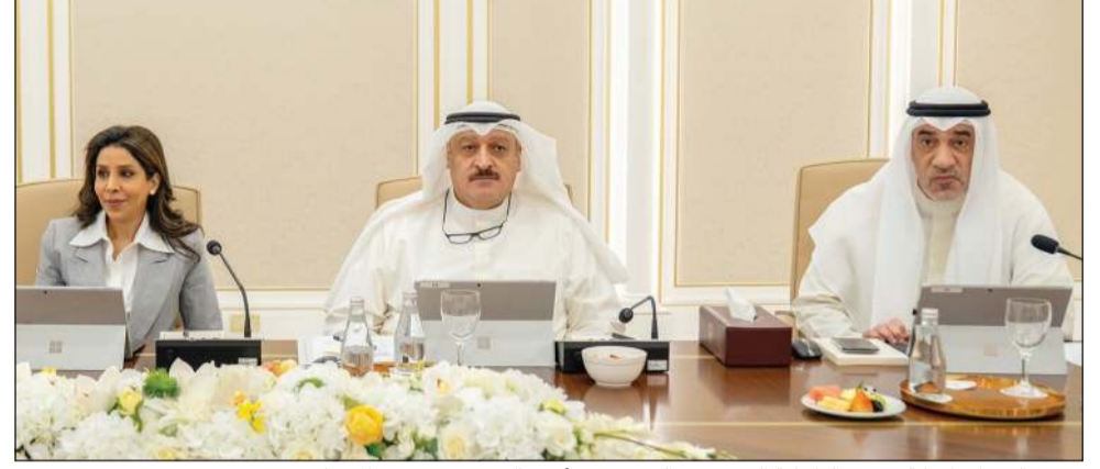
رئيس الوزراء بالإتابة ووزير الداخلية الشيخ فهد يوسف ود. أحمد العوضي ود. نورة المشعان