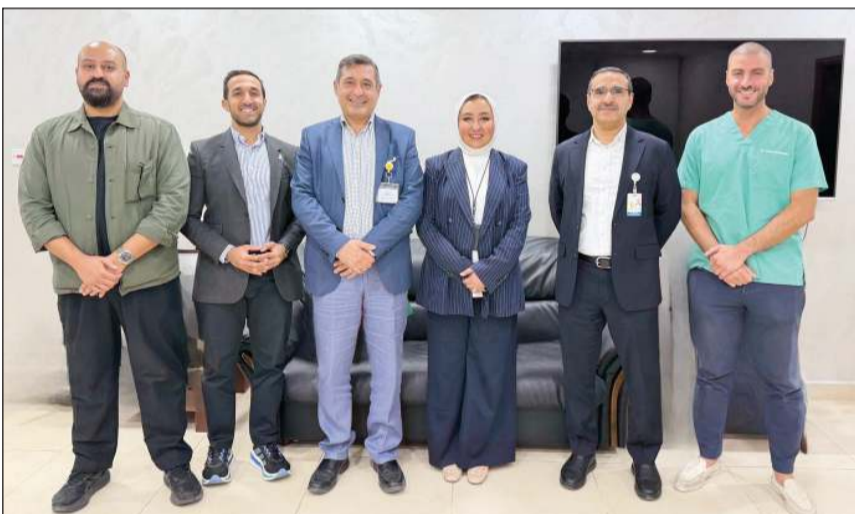
رئيسة مجلس أقسام الأمراض الجلدية بوزارة الصحة د.أطال الافي مع الأطباء المشاركين في تدشين العيادة