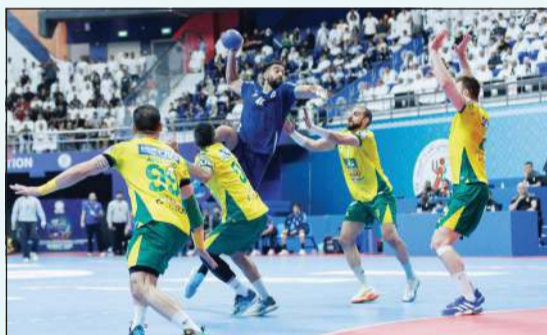
برقان صاد للقب

فاز الدحيل القطري على «الكويت» الكويتي مستضيف البطولة بنتيجة 36-34 في مباراة تحديد المركز الثالث والتي جمعتها على صالة مجمع الشيخ سعد العبدالله في ضاحية صباح السالم مساء أمس، وبذلك يحصد الدحيل الميدالية البرونزية فيما خرج الكويت بالمركز الرابع.