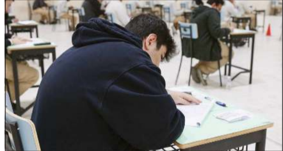
إجراءات تنظيمية متكاملة خلال اختبارات الثاني عشر