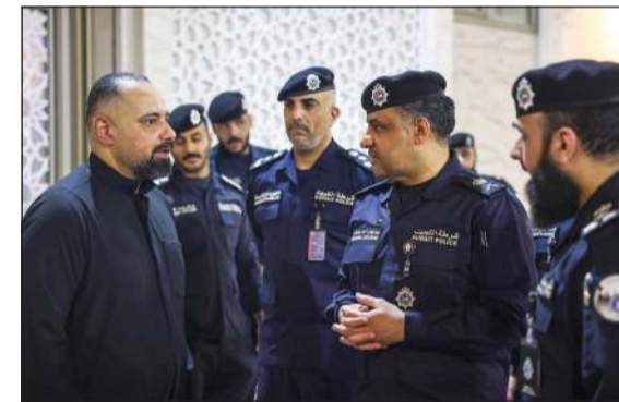
وكيل وزارة الداخلية اللواء عبدالوهاب الوهيب لدى تفقده عدداً من الحسينيات

وحث القائمين على الحسينيات على التعاون مع منتسبي وزارة الداخلية، وتيسير مهامهم الميدانية، مؤكداً أن وجود رجال الأمن يأتي حرصاً على سلامة الجميع وحفاظاً على أرواحهم وممتلكاتهم. ودعا القائمين على الحسينيات إلى عدم التردد في التواصل مع الأجهزة الأمنية وطلب المساعدة متى دعت الحاجة، مؤكداً أن «الداخلية» ستواصل تكثيف حضورها الميداني طوال شهر محرم. وثمن تعاون القائمين على الحسينيات واللجان المنظمة في تسهيل مهام الأجهزة الأمنية وتحقيق أعلى معدلات السلامة للجميع.