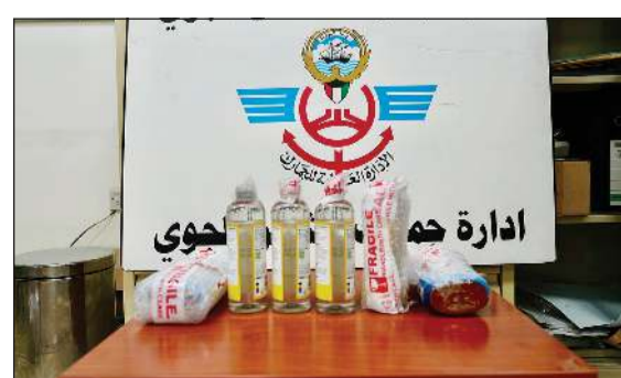
المضبوطات من المواد المخدرة داخل جمارك الشحن الجوي

وأكدت الإدارة أن هذه الضريبة جاءت نتيجة بظلمة مفتشي الجمارك وخبرتهم وجهودهم المتواصلة في كشف أساليب التهريب المستحدثة، بما يعزز كفاءة المنظومة الرقابية في المنافذ الجمركية. وأوضحت أنه تم اتخاذ الإجراءات القانونية اللازمة بشأن الشحنات المضبوطة، وإعداد محضر بالواقعة لتجهيزها لإحالة المضبوطات إلى الجهات المختصة لاستكمال الإجراءات المتبعة.