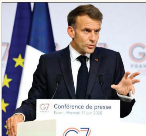
الرئيس الفرنسي إيمانويل ماكرون متحدثاً في مؤتمر صحفي في ختام قمة مجموعة السبع (G7).

البيان الختامي لقمة قادة «G7» يرحب بالاتفاق الأميركي - الإيراني: فرصة لمنع إيران من امتلاك سلاح نووي