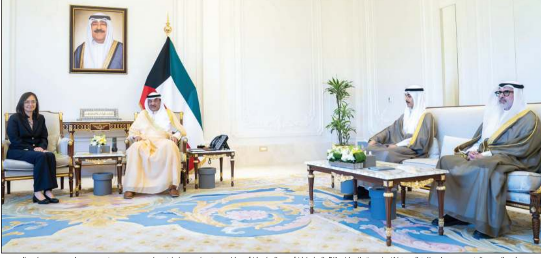
سمو ولي العهد الشيخ صباح الخالد خلال استقبال الممثلة العليا للأمين العام للأمم المتحدة ماري ياماشيتا بحضور رئيس ديوان سمو ولي العهد الشيخ ثامر الجابر ووزير الخارجية الشيخ جراح الجابر

الخالد ببرقية تهنئة إلى الرئيسة هالا توماسدوتير رئيسة جمهورية آيسلندا الصديقة ضمنها سموه خالص تهنائه بمناسبة ذكرى تأسيس الجمهورية، وراجيا لها دوام الصحة والعافية.