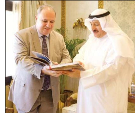
وزير الصحة د. أحمد العوضي خلال اللقاء مع سفير أذربيجان إميل كريموف

الصحة وتعزيز حضورها الإقليمي والدولي من خلال التعاون البناء مع مختلف الشركاء الدوليين. وشهد اللقاء بحث فرص التعاون المشترك في عدد من المساور الصحية ذات الأولوية وفي مقدمتها التدريب والتأهيل الطبي وتبادل الخبرات والكفاءات المتخصصة والاستفادة من التجارب الناجحة والتقنيات الصحية الحديثة بما يسهم في تعزيز كفاءة المنظومة الصحية والارتقاء بجودة الخدمات المقدمة وفق أفضل المعايير والممارسات الدولية. ويأتي اللقاء ضمن مساعي وزارة الصحة المتواصلة لتوسيع شبكة علاقاتها الدولية وتعزيز التعاون مع الدول الصديقة بما يسهم في دعم خطط التطوير الصحي وترسيخ مكانة دولة الكويت مركزاً إقليمياً رائداً في تقديم خدمات الرعاية الصحية المتقدمة.