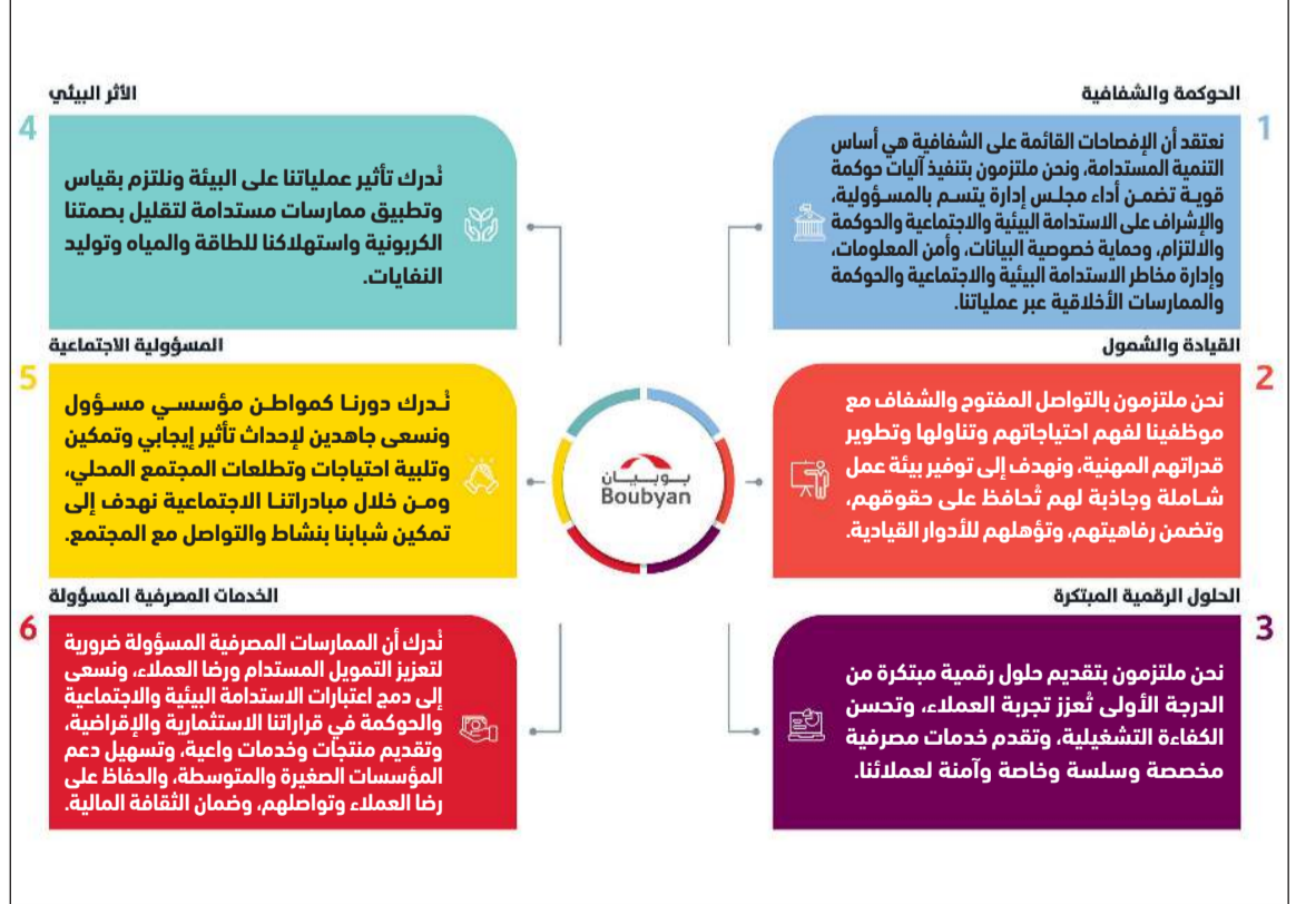
بيان استراتيجي للاستدامة البيئية والاجتماعية والحوكمة