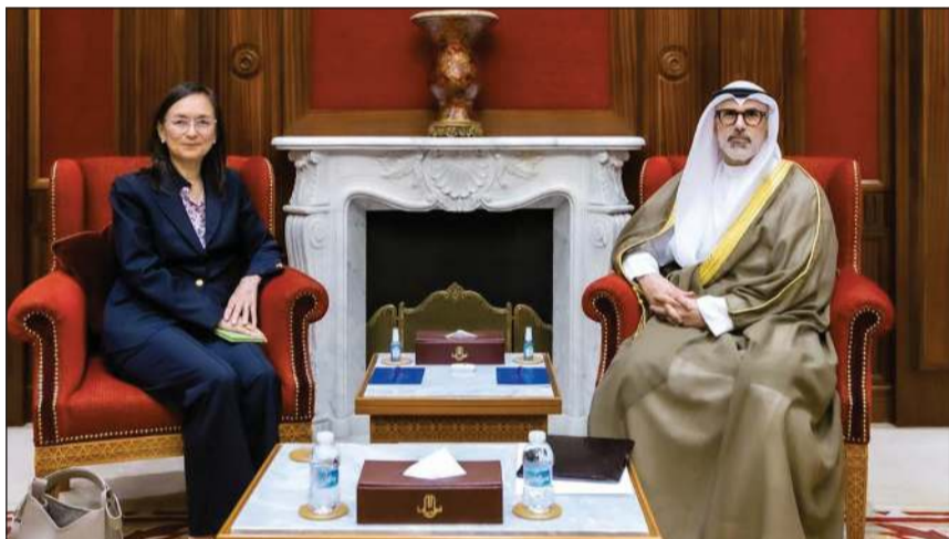
وزير الخارجية الشيخ جراح الجابر مستقبلا الممثلة العليا للأمين العام للأمم المتحدة ماري ياماشيتا

وذلك باعتبارها من القضايا التي تحظى بأولوية قصوى لدى دولة الكويت لما لها من أبعاد وطنية وإنسانية.