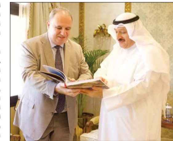
وزير الصحة د. أحمد العوضي خلال اللقاء مع سفير أذربيجان إميل كريموف

الصحة وتعزيز حضورها الإقليمي والدولي من خلال التعاون البناء مع مختلف الشركاء الدوليين. وشهد اللقاء بحث فرص التعاون المشترك في عدد من المساور الصحية ذات الأولوية وفي مقدمتها التدريب والتأهيل الطبي وتبادل الخبرات والكفاءات المتخصصة والاستفادة من التجارب الناجحة والتقنيات الصحية الحديثة بما يسهم في تعزيز كفاءة المنظومة الصحية والارتقاء بجودة الخدمات المقدمة وفق أفضل المعايير والممارسات الدولية. ويأتي اللقاء ضمن مساعي وزارة الصحة المتواصلة لتوسيع شبكة علاقاتها الدولية وتعزيز التعاون مع الدول الصديقة بما يسهم في دعم خطط التطوير الصحي وترسيخ مكانة دولة الكويت مركزاً إقليمياً رائداً في تقديم خدمات الرعاية الصحية المتقدمة.