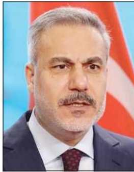
وزير خارجية تركيا د.هاكان فيدان