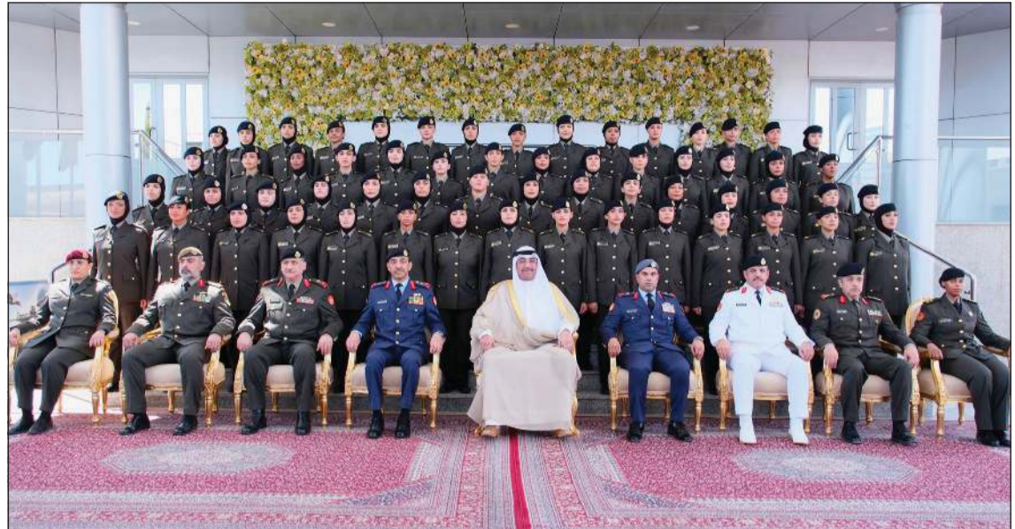
وزير الدفاع الشيخ عبدالله العلي ورئيس الأركان العامة للجيش الفريق الركن خالد الشريعان ونائب رئيس الأركان العامة للجيش اللواء الركن طيار الشيخ صباح الجابر مع الضباط الخريجات

المؤسسة العسكرية حريصة على الاستفادة من الكفاءات الوطنية المؤهلة لدعم تنفيذ المهام والواجبات