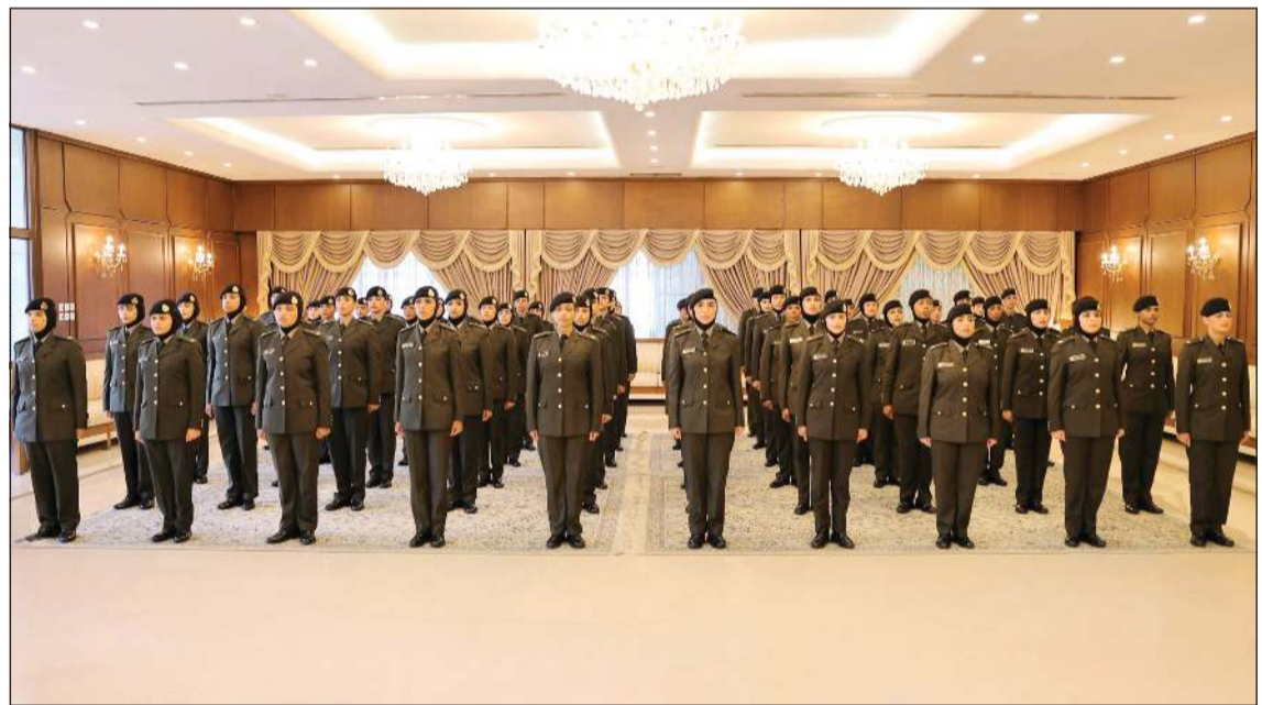
الدفعة الأولى للعنصر النسائي من حملة الشهادة الجامعية خلال أداء القسم القانوني

قلد وزير الدفاع الشيخ عبدالله العلي كوكبة جديدة من الدفعة الأولى للعنصر النسائي من حملة الشهادة الجامعية، وذلك بعد صدور المرسوم الأميري بتوليهم ضباطا في الجيش الكويتي، واستهلّت مراسم التولية بقرأة المرسوم الأميري، ثم أدى الضباط الخريجات القسم القانوني. وقد هذا الشيخ عبدالله العلي الضباط الخريجات بهذه المناسبة، مؤكداً أن نيلهن الثقة الأميرية الغالبة من صاحب السمو الأمير القائد الأعلى للقوات المسلحة الشيخ مشعل الأحمد