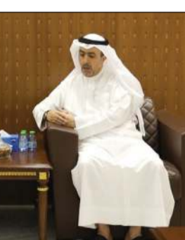
رئيس مركز مجلس التعاون لإدارة حالات الطوارئ العميد حقوقي د. راشد المري خلال اللقاء مع السفير القطري علي بن عبدالله آل محمود

كونا: أكد رئيس مركز الطوارئ التعاون لإدارة حالات المري مواصلة المركز تنفيذ مهامه وبرامجه وفق توجيهات قادة دول مجلس التعاون وبدعم ومتابعة من الأمين العام للمجلس بما يسهم في تعزيز الجاهزية المشتركة ورفع كفاءة الاستعداد والاستجابة لختلف الطوارئ والأزمات. وقال المري في تصريح لـ «كونا»، عقب استقباله سفير دولة قطر لدى دولة الكويت علي بن عبدالله آل محمود، إن المركز يعمل على تطوير منظومات الرصد والإنذار المبكر وتبادل المعلومات والتنسيق بين الجهات المختصة بدول المجلس. وأضاف أن المركز يعمل أيضا على تنفيذ المبادرات والمشاريع الخليجية المشتركة