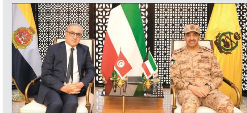
رئيس الأركان الفريق الركن خالد الشريعان مستقبلا السفير التونسي محمد كريم البودالي

استقبل رئيس الأركان العامة للجيش الفريق الركن خالد الشريعان، سفير الجمهورية التونسية لدى دولة الكويت محمد كريم البودالي. وخلال اللقاء تمت مناقشة المواضيع ذات الاهتمام المشترك وسبل تطوير وتعزيز التعاون العسكري بين البلدين الشقيقين. حضر اللقاء الملحق العسكري التونسي لدى دولة الكويت.