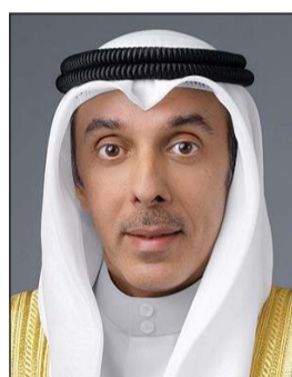
نائب وزير الخارجية السفير حمد المشعان

كونا: تلقى نائب وزير الخارجية السفير حمد المشعان اتصالا هاتفيا من الممثل الخاص للأمين العام لحلف شمال الأطلسي لدول الجوار الجنوبي خافيير كولومينا قدم خلاله التهنئة بمناسبة تعيينه نائبا لوزير الخارجية. وبحسب بيان صادر عن وزارة الخارجية جرى خلال الاتصال بحث أوجه