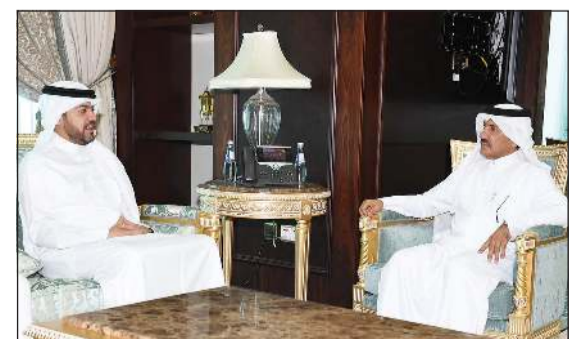
سفيرنا لدى قطر مع الأمين العام لوزارة الخارجية القطرية أحمد الحمادي

بين البلدين في مختلف المجالات والسبل الكفيلة بدعمها وتطويرها ودفعها إلى آفاق أرحب في مختلف المجالات. وأشاد السفير الشريف بعقد العلاقات المشتركة بين البلدين في المجالات كافة. وأضاف السفير الشريف أنه اجتمع يوم أمس الأول مع الأمين العام لوزارة الخارجية القطرية أحمد الحمادي، حيث تناول الاجتماع تعزيز العلاقات الثنائية