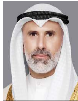
وزير الخارجية الشيخ جراح الجابر

كونا: أجرى وزير الخارجية الشيخ جراح الجابر اتصالا هاتفيا مع وزير خارجية الجمهورية التركية الصديقة د.هاكان فيدان. وذكرت وزارة الخارجية في بيان أنه جرى خلال الاتصال استعراض آخر التطورات التي تشهدها المنطقة والجهود المبذولة حيالها، لا سيما التوصل إلى اتفاق حول مذكرة التفاهم بين الولايات المتحدة الأمريكية والجمهورية الإسلامية الإيرانية التي تقضي بوقف العمليات العسكرية بشكل فوري ودائم وتضمن حرية الملاحة في مضيق هرمز ومعالجة عدد من القضايا.