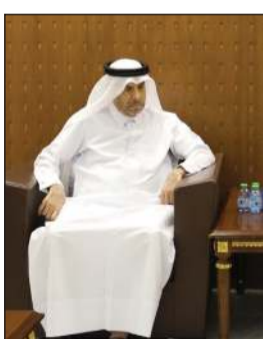
رئيس مركز مجلس التعاون لإدارة حالات الطوارئ العميد حقوقي د. راشد المري خلال اللقاء مع السفير القطري علي بن عبدالله آل محمود

الممارسات والمعايير الدولية. واطلع السفير القطري والوفد المرافق خلال الزيارة، على مهام المركز واختصاصاته ودوره في تعزيز منظومة العمل الخليجي المشترك في مجالات إدارة الطوارئ والأزمات إلى جانب الجهود التي يبذلها في دعم التنسيق والتكامل بين الجهات المختصة بدول مجلس التعاون. كما استمع السفير إلى شرح حول آليات الرصد والمتابعة وتبادل المعلومات ومنظومات الإنذار المبكر والإجراءات التشغيلية المعتمدة للتعامل مع الأحداث الطارئة فضلا عن المشاريع أبرز المبادرات والمشاريع الخليجية المشتركة التي ينفذها المركز لتعزيز القدرات الوطنية والإقليمية في مجالات الاستجابة وإدارة الأزمات.