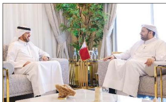
سفيرنا لدى قطر مع وزير الدولة بوزارة الخارجية القطرية د.محمد الخليفي