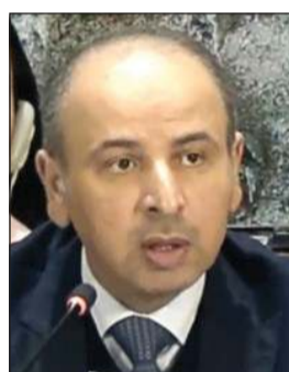
مندوبنا لدى الأمم المتحدة

جنيث - كونا: أكد مندوبنا الدائم لدى الأمم المتحدة والمنظمات الدولية الأخرى في جنيف السفير ناصر الهين موقف دولة الكويت الثابت والمبدئي في دعم القضية الفلسطينية واستنكارها للانتهاكات المستمرة التي تقوم بها مسؤولو القوة القائمة بالاحتلال والمستوطنون المتطرفون باقتحام المسجد الأقصى المبارك ورفع علم الاحتلال الإسرائيلي في باحاته تحت حماية قوات الاحتلال. وقال السفير الهين في كلمة ألقاها خلال حوار تفاعلي مع لجنة تقصي الحقائق حول