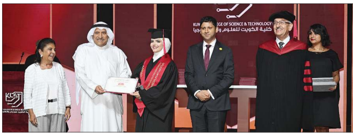
رئيسة مجلس أمناء كلية الكويت للعلوم والتكنولوجيا السفيرة نبيلة الملا والأمين العام للأمانة العامة لمجلس الجامعات الخاصة د.جاسم العلي وسفير المملكة المتحدة قديسي رشيد ورئيس الكلية البروفيسور خالد البقاعين خلال تكريم إحدى الخريجات

أهمها حصول الكلية على المركز 51 في قائمة تصنيف الجامعات العربية من أصل 450 جامعة حسب مؤسسة التصنيف العالمي التايمن بالتعليم العالي وخصوصاً كونها الجامعة الأقل عمراً ضمن أول 100 جامعة في القائمة. مشيداً بالإنجازات الجذرية المتميزة لأعضاء هيئة التدريس وخاصة في الأبحاث والتأثير المباشر على الاقتصاد والمجتمع ومنها ما يتعلق بالأمن السيبراني والذكاء الاصطناعي