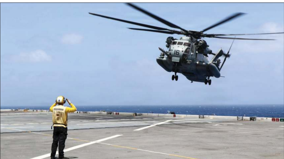
مروحية من طراز 53-CH تابعة لسلاح مشاة البحرية الأمريكية تستعد للهبوط على متن قاعدة إس إس ميغيل كيث (5 ESB) البحرية المتحركة (ستنوكوم)

إعادة بناء برنامجها النووي، وإفاد مصدر دبلوماسي وكالة «فرانس برس» أمس بأن الولايات المتحدة وإيران ستعقدان لقاءات غير مباشرة في الدوحة قبل التوقيع الرسمي على الاتفاق. في المقابل، قال الرئيس الإيراني مسعود بزشكيان إن طهران قررت، بعد تنسيق، توقيع مذكرة التفاهم مع الولايات المتحدة يوم الجمعة المقبل. وقد أعلنت إيران أنها ستسعى للحصول على تصديق من مجلس الأمن التابع للأمم المتحدة على الاتفاق النهائي مع الولايات المتحدة. وقال المتحدث باسم وزارة الخارجية الإيرانية إسماعيل باقائي في مؤتمره الصحفي الأسبوعي «من المتوقع أن تتم المصادقة على الاتفاق النهائي بقرار من مجلس الأمن التابع للأمم المتحدة بعد فترة 60 يوماً»، مضيفاً أن طهران «استخلصت عبرا من التجارب السابقة».