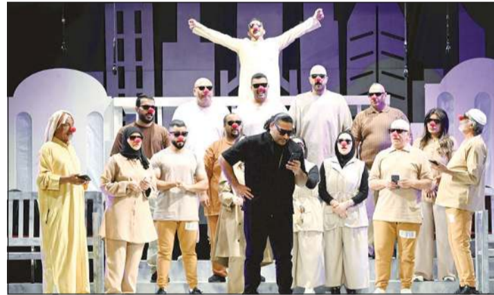
من عروض المسرحية على خشبة «الشامية»