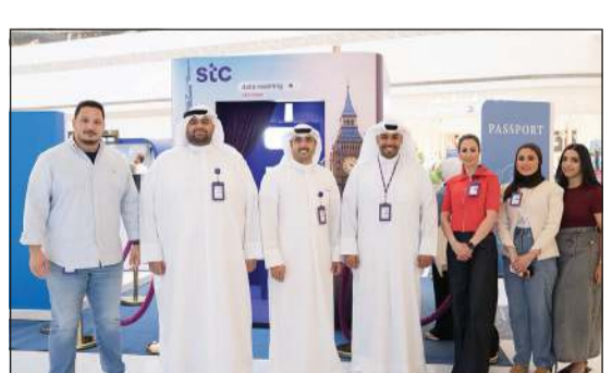
فريق عمل إدارة العلاقات العامة خلال افتتاح المعرض

رعت شركة الاتصالات الكويتية stc، معرض Tourista Expo 2026 في العاصمة مول، حيث عرضت خدماتها وبقايتها الشاملة للتجوال وحلول الاتصال الخاصة بها. ومن خلال مشاركتها، تواصلت stc مع الزوار انطلاقاً من التزامها بدعم عملائها بحلول اتصال موثوقة وسلسة تساهم على البقاء على اتصال أينما كانوا، استعداداً لموسم السفر. وتقدم stc خدمات التجوال حول العالم لتشمل أكثر من 150 دولة، فضلاً عن باقاتها المصممة خصيصاً لدول مثل الخليج وتركيا مع إنترنت لامحدود، ويمكنهم الاستفادة من خلال خدمة esim التي يتوافر الاشتراك فيها عبر موقع الشركة أو من خلال التطبيق.