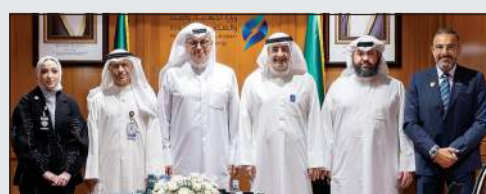
وزير الكهرباء والماء والطاقة المتجددة د.صبيح المخزييم خلال استقبله رئيس مجلس إدارة بنك وحدة حرمه السيدات بحضور وكيل وزارة الكهرباء والطاقة المتجددة د.عادل الزامل ودمحمد بركات

«ووب» يؤكد دعمه لجهود ترشيح الكهرباء والمياه