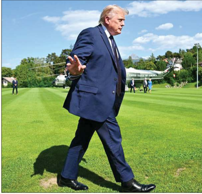
الرئيس الأميركي دونالد ترامب لدى وصوله إلى مدينة إيفيان الفرنسية لحضور قمة مجموعة السبع

ترامب: تم الاتفاق مع إيران.. فتح مضيق هرمز دون رسوم مرور ورفع فوري للحصار البحري الأميركي.. فليتدفق النفط