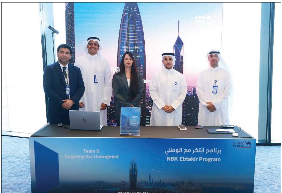
أحد الفرق المشاركة في البرنامج

ويعد البرنامج، الذي أطلقه البنك بالتعاون مع منصة الابتكار العالمية «بلج أند بلاي» Plug and Play، الأول من نوعه في الكويت، ويهدف إلى ترسيخ الابتكار كجزء أصيل من ثقافة البنك المؤسسية، إذ يتيح للموظفين من مختلف الإدارات تصميم حلول أعمال مبتكرة بالاعتماد على منهجيات العمل المرن وأطر التفكير التصميمي، كما يسهم في تعزيز التعاون بين الإدارات المختلفة وتنمية روح المبادرة لدى الموظفين في معالجة التحديات، إلى جانب تحويل الأفكار إلى نماذج أولية ذات قيمة مضافة، بما يدعم مسيرة البنك في التحول الرقمي ويطلق الإمكانيات الكامنة لمواهبه البشرية. وشهد يوم العروض التقديمية النهائية مشاركة 5 فرق تأهلت إلى هذه المرحلة