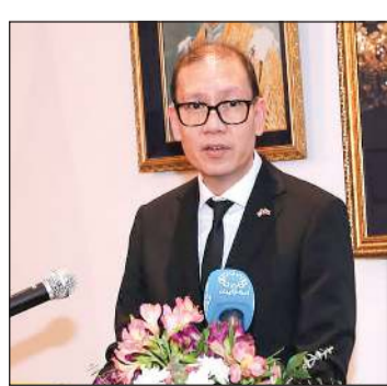
سفير تايلند سونغتشاي تشايباتيبوت خلال اللقاء

زخما متجددا خلال السنوات الأخيرة، إذ اجتمع رئيس الوزراء التايلندي آنذاك مع سمو ولي العهد الشيخ صباح الخالد على هامش القمة الخالفة لحوار التعاون الآسيوي في الدوحة عام 2024، فيما شهد ديسمبر من العام نفسه انعقاد الجولة الأولى من المشاورات السياسية التايلندية - الكويتية في بانكوك، في إطار تأكيد التزام البلدين بتعزيز التعاون في مجالات التجارة، والأمن الغذائي، والرعاية الصحية، والتعليم. وأشار إلى أن هذه المجالات لا تقتصر على السياسات الرسمية، بل تعكس عمق الروابط الإنسانية بين الشعبين، مؤكداً أن تايلند طالما حظيت بثقة المواطنين الكويتيين باعتبارها وجهة موثوقة للرعاية الصحية والعلاج، وهو ما يجسد مستوى الثقة الكبيرة التي يوليها الكويتيون للقطاع الصحي التايلندي، وبين أن نحو 6% من الشعب الكويتي زاروا تايلند خلال عام 2025، مستفيدين من التنوع الثقافي، والمكولات الحلال، والمقومات السياحية المتعددة.