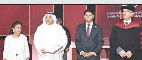
رئيسة مجلس أمناء كلية الكويت للعلوم والتكنولوجيا السفيرة نبيلة الملا والأمين قنسي رشيد والبروفيسور خالد البقاعين خلال الحفل

كلية الكويت للعلوم والتكنولوجيا حُرّجت الدفعة السابعة واحتفت بعقد من العطاء