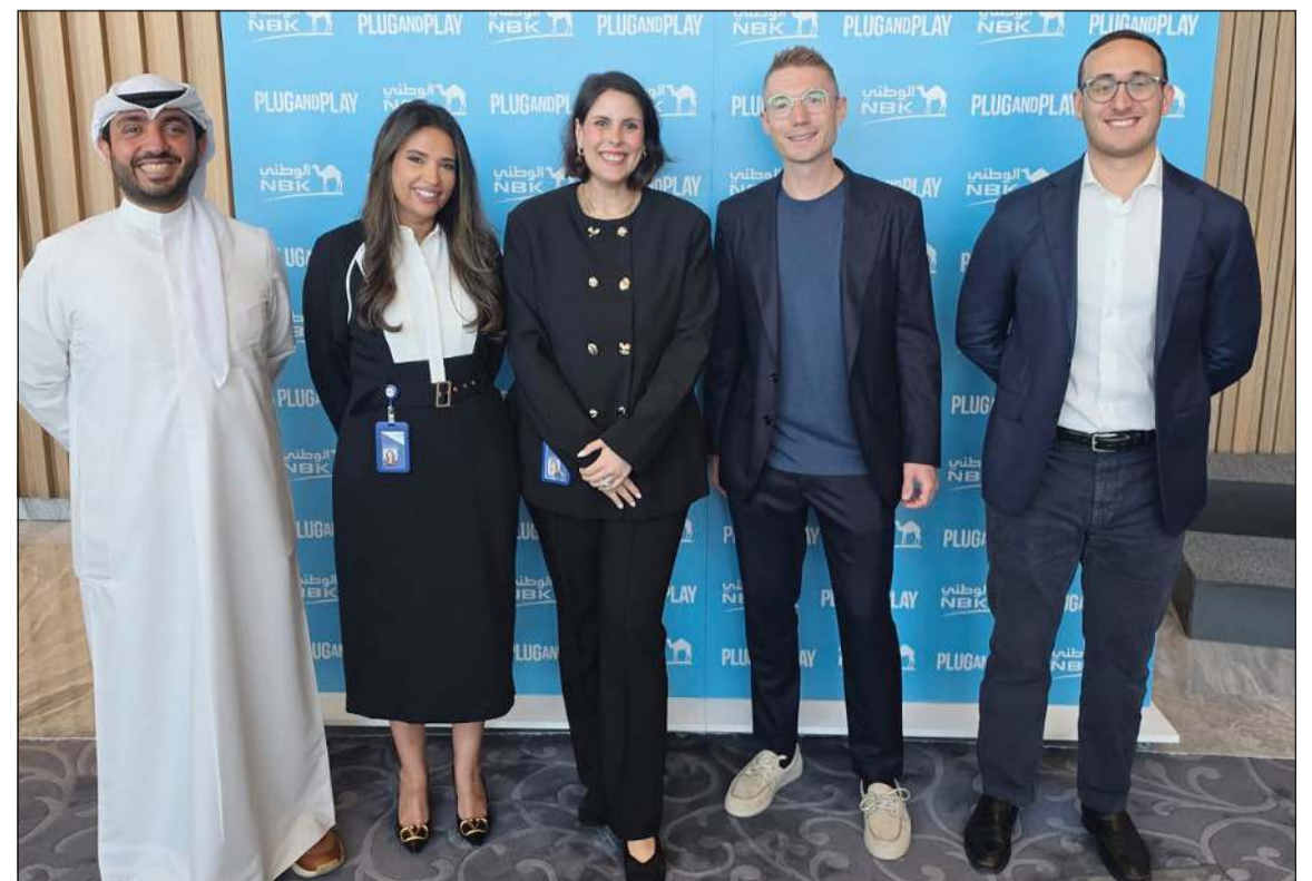
فريق «الوطني» مع شركة Plug and Play