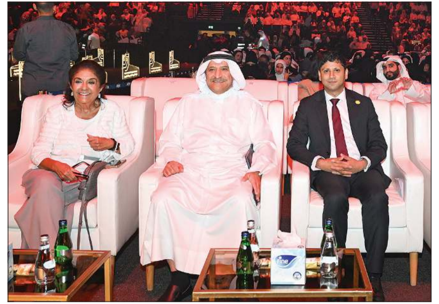
رئيسة مجلس أمناء كلية الكويت للعلوم والتكنولوجيا السفيرة نبيلة الملا والأمين العام للأمانة العامة لمجلس الجامعات الخاصة د.جاسم العلي وسفير المملكة المتحدة قديسي رشيد في مقدمة الحضور

شملت 396 خريجاً في 3 تخصصات هندسية وتقنية.. والملا: نسبة الحاصلين على وظائف خلال فترة قصيرة تجاوزت 90%