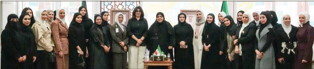
وكيلة وزارة العدل عواطف السند خلال اللقاء مع المعينات الجدد في وظيفة أمين سر جلسة بحضور الوكيل المساعد للشؤون الفنية والإدارية بالتكليف نوف القبندي

للمرة الأولى.. «العدل» تعين 27 امرأة في وظيفة أمناء سر الجلسات