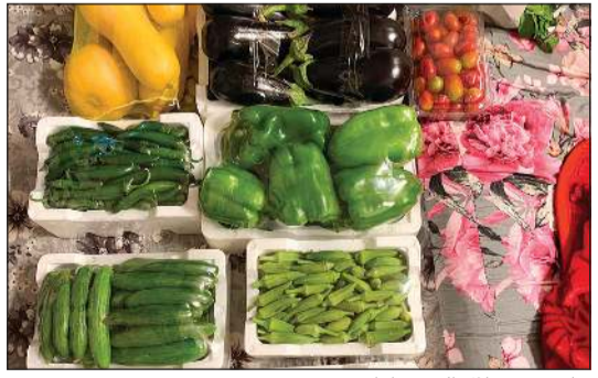
جانب من سلال الخضراوات

في إطار دورها المجتمعي وحرصها على دعم الفئات الأكثر احتياجاً،واصلت جمعية المنابر القرآنية مبادراتها لتوزيع سلال الخضار على عدد من الأسر المتعففة داخل الكويت، وذلك ضمن جهودها الرامية إلى المساهمة في توفير الاحتياجات الأساسية للأسر المستفيدة وتعزيز قيم التكافل والتراحم في المجتمع. وأكد المدير العام لجمعية المنابر القرآنية، د.محمد العمران أن هذه المبادرة تأتي استجابة لاحتياجات عدد من الأسر التي تتابع الجمعية أوضاعها بصورة مستمرة، وتسعى إلى مساعدتها من خلال برامج ومبادرات متنوعة تسهم في تخفيف الأعباء المعيشية عنها. وقال: انطلاقاً من مسؤوليتنا المجتمعية، سارعت جمعية المنابر القرآنية إلى تنفيذ هذه المبادرة النوعية التي تستهدف توفير سلال من الخضراوات الطازجة والمتنوعة للأسر المتعففة، بما يلبي جانباً من احتياجاتها الغذائية الأساسية ويعزز استقرارها المعيشي، مضيفاً أن الجمعية حرصت على تخصيص هذه المبادرة لشريحة من الأسر التي تحظى بمتابعة مستمرة من قبل فرق العمل.