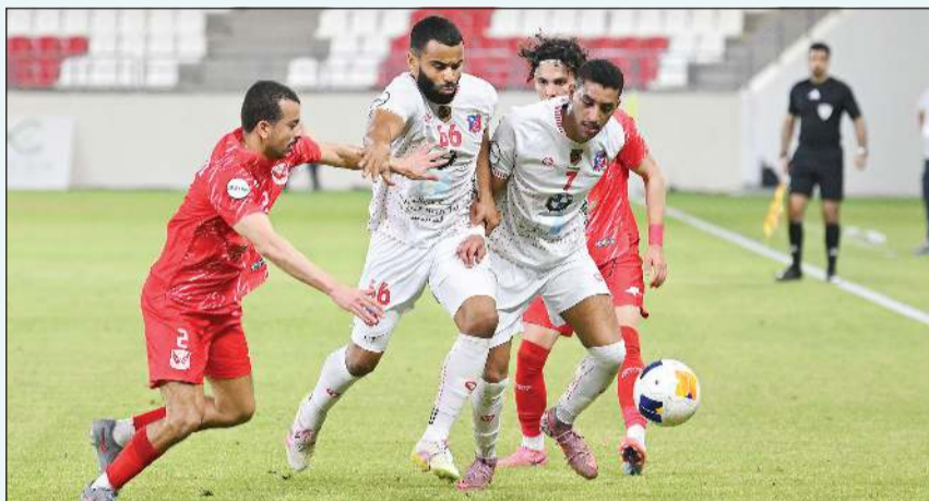
الكويت لتجاوز الفحيحيل مرة أخرى