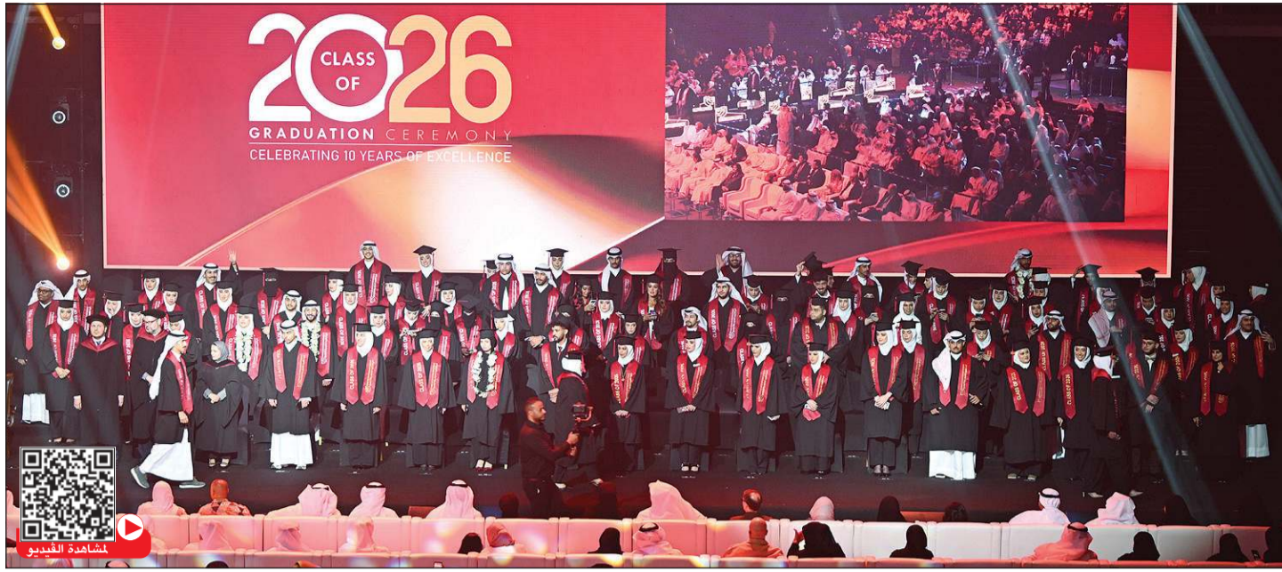
جانب من خريجي الدرجة السابعة من كلية الكويت للعلوم والتكنولوجيا (رديليش كومار)