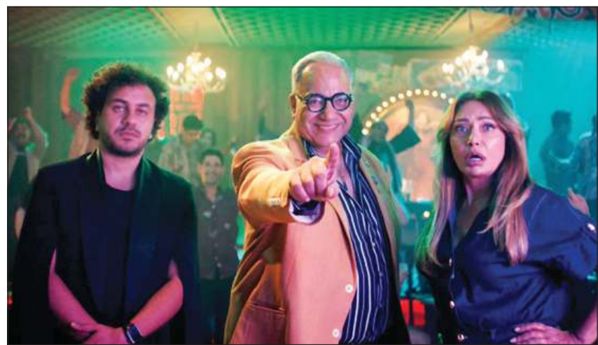
مشهد من «ابن مين فيهم؟»