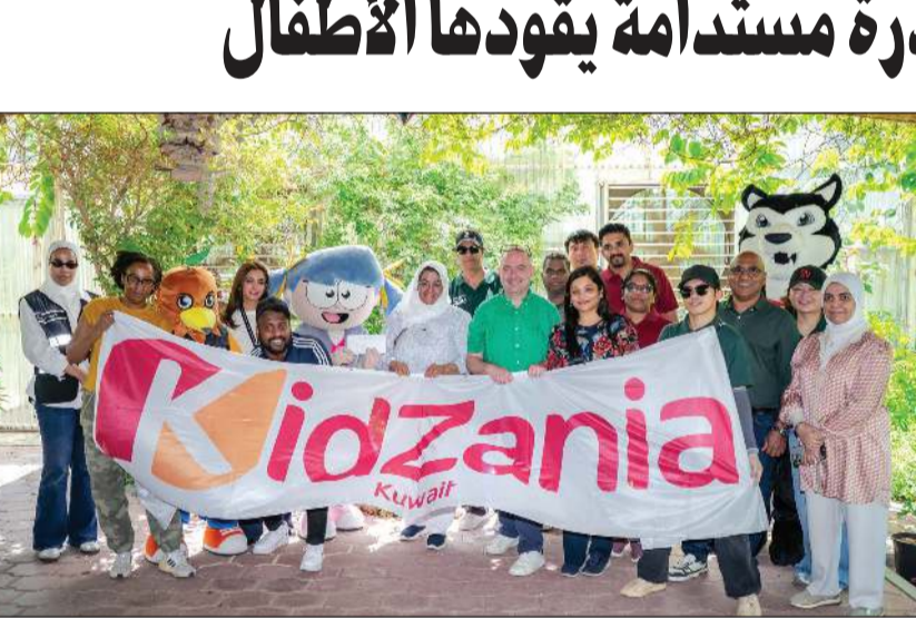
مبادرة مستدامة يقودها الأطفال

اختتمت كيدزانيا الكويت بنجاح فعالياتها الخاصة بيوم البيئة العالمي 2026، من خلال برنامج تفاعلي استمر لمدة 9 أيام، هدف إلى تعزيز الوعي البيئي وتشجيع العمل المناخي لدى الأطفال. وتضمن البرنامج مجموعة متنوعة من الأنشطة التي شملت التجهيزات المناخية، والتحديات البيئية، وورش العمل الإبداعية باستخدام المواد المعاد تدويرها، إلى جانب تجارب تعليمية تتمحور حول مفاهيم الاستدامة، ما أتاح للأطفال فرصة فهم أهمية حماية البيئة واتخاذ خطوات إيجابية نحو مستقبل أفضل. وفي قلب هذه المبادرة، أطلقت كيدزانيا الكويت حملة للتبرع بـ «كيدزوس» على مستوى المدينة، حيث ساهم المواطنون الصغار في 13,000 كيدزوس دعماً للجهود البيئية. وبالتعاون مع شركاء المبادرة: American University of Kuwait, Asnan Tower, Hassan, Environmental VI and Public Authority Markets، تم تحويل هذه المساهمة إلى أثر ملموس