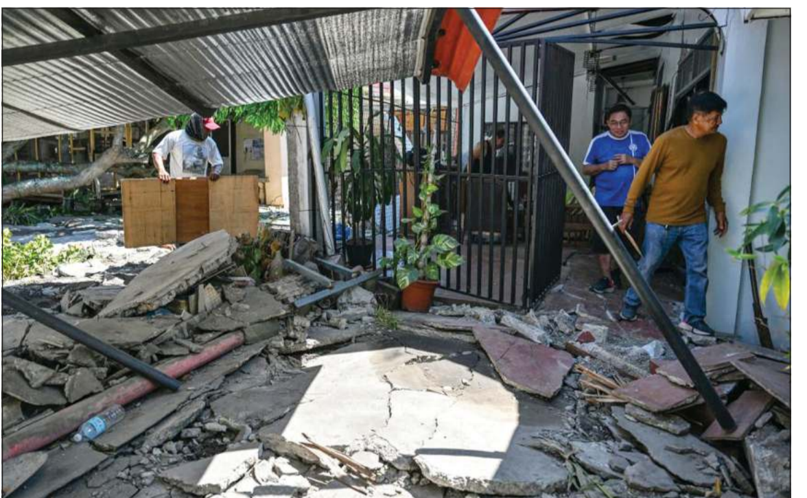
صورة أرشيفية للزلزال الذي ضرب جنرال سانتوس جنوب الفلبين الأسبوع الماضي

حصيلة ضحايا الزلزال إلى 65 قتيلاً أمس، فيما لا يزال 36 شخصاً على الأقل في عداد المفقودين. وأفادت وزارة البيئة الأحد بأن زلزال 8 يونيو تسبب أيضاً في ارتفاع قاع البحر بنحو مترين في إحدى المناطق الساحلية، ما أدى إلى انكشاف الشعاب المرجانية وامتداد خط الساحل بما يصل إلى 200 متر في بعض المناطق. وتضرب الزلازل بوتيرة شبيهة يومية العظمى الواقعة على ما يعرف بـ «حلقة النار» في المحيط الهادئ، وهي قوس من النشاط الزلزالي الكثيف يمتد من اليابان مروراً بجنوب شرق آسيا وصولاً إلى حوض المحيط الهادئ.