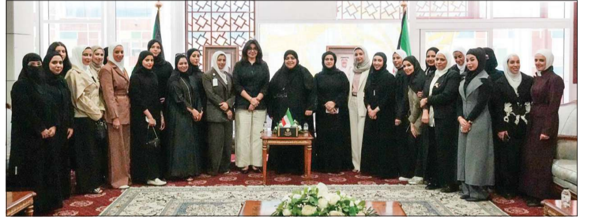
وكيلة وزارة العدل عواطف السند خلال اللقاء مع المعينات الجدد في وظيفة أمين سر جلسة بحضور الوكيل المساعد للشؤون الفنية والإدارية بالتكليف نوف القبندي

وفق متطلبات الكفاءة والانضباط وحسن سير الجلسات. وأوضح أن وظيفة أمين سر الجلسة تعد من الوظائف المهمة في العمل القضائي، لما يرتبط بها من إثبات إجراءات الجلسات، وتحرير محاضرها، ومتابعة ما يصدر خلالها من قرارات. وأكدت وزارة العدل استمرارها في تطوير بيئة العمل داخل قطاعاتها المختلفة، بما يعزز كفاءة مرفق العدالة، ويحسن جودة الخدمات المقدمة للمتناقضين، ويدعم مسيرة التطوير المؤسسي في الوزارة.