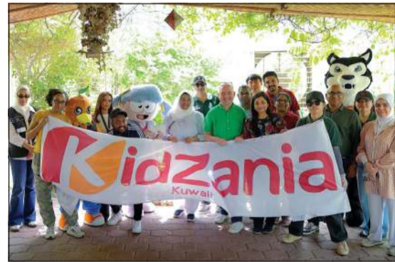
جانب من فعالية اليوم العالمي للبيئة