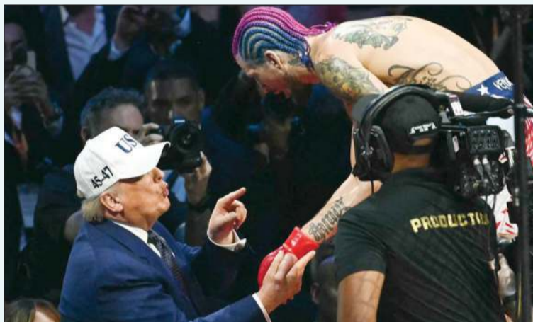
الرئيس الأمريكي ترامب يتحدث إلى أحد المشاركين في الزفال

شهد البيت الأبيض أمس عرضاً غير مسبوق لفنون القتال المختلطة تزامناً مع احتفال الرئيس الأمريكي دونالد ترامب بعيد ميلاده الثمانين، ليشاهد الزفال في الحديقة الجنوبية للبيت الأبيض.