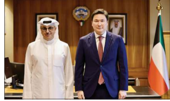
وزير الكهرباء والماء والطاقة المتجددة د. صبيح المخيزيم مستقبلاً سفير جمهورية كازاخستان يرزهان يلكيف