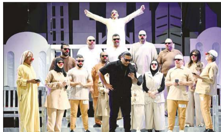
من عروض المسرحية على خشبة «الشامية»