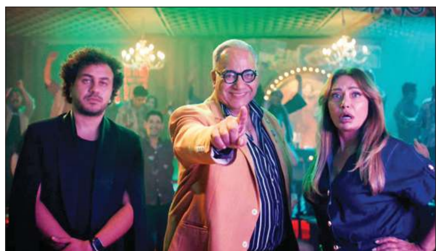
مشهد من «ابن مين فيهم؟»