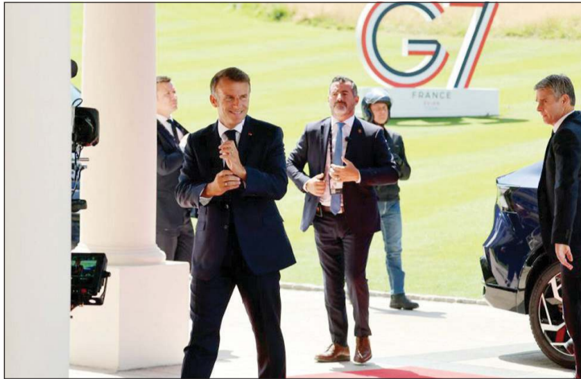
الرئيس الفرنسي إيمانويل ماكرون يصل إلى مقر انعقاد قمة مجموعة السبع في إيفيان

الارض بأسره». وأكد أن هذا الموضوع سيكون محل نقاش خلال القمة، وانتهم الايرانيين بانهم «يلعبون على الكلمات. يقولون «إنها لقاء خدمات» سترى ذلك». وأشار ماكرون إلى أن من الممكن نشر حاملة الطائرات الفرنسية شارل ديغول في مضيق هرمز «في غضون يومين أو ثلاثة أيام بعد تثبيت» الاتفاق، للمساعدة في إطار مهمة دولية على إعادة فتح الممر. واعتبر ماكرون أن الأولوية هي أن يكون هناك «اتفاق متين وجدي للطاقة الذرية».