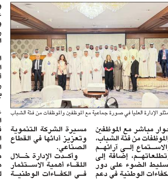
ممثلو الإدارة العليا في صورة جماعية مع الموظفين والموظفات من فئة الشباب

في إطار حرصها على تعزيز التواصل المؤسسي وتطوير بيئة العمل، نظم قطاع الإدارة المالية والخدمات المساندة «إدارة الموارد البشرية» في شركة الصناعات الوطنية بالتعاون مع الإدارة العليا ملتقى الصناعات، والذي جمع عدداً من الموظفين الكويتيين حديثي التعيين في الشركة، بهدف تعزيز جسور التواصل، وتبادل المعرفة، وترسيخ قيم الانتماء المؤسسي، والمساهمة في بناء مستقبل أكثر ابتكاراً وتميزاً. وشهد الملتقى حضور عدد من ممثلي الإدارة العليا، حيث تم خلاله فتح