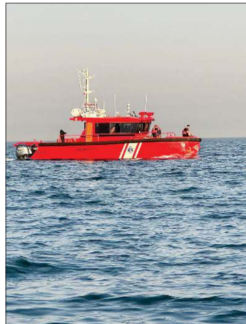
لكية تابعة لمركز «المهلب»، تعاملت مع الحادث

أصدرت قوة الإطفاء العام بيانا قالت فيه إن شخصا أصيب اثر تصادم وقع بين زورق ودراجة مائية، وذكرت قوة الإطفاء أن فريق الإنقاذ البحري التابع لمركز المهلب البحري تعامل مساء أمس الأول مع حادث تصادم وقع بين زورق ودراجة مائية في بحر منطقة الزور، مشيرة إلى أن الشخص المصاب تم تسليمه إلى الطوارئ الطبية.