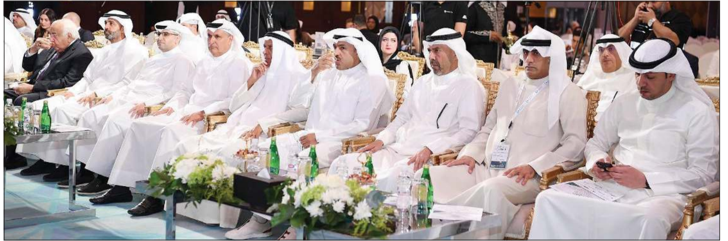
وزير الدولة لشؤون البلدية ووزير الدولة لشؤون الإسكان م.عبداللطيف المشاري متوسماً الرئيس التنفيذي لمجموعة بنك الوطني عصام الصقر والرئيس التنفيذي لمجموعة بيت التمويل الكويتي خالد الشعلان والرئيس التنفيذي للمجموعة في شركة العقارات المتحدة مشاري المحيلان ورئيس اللجنة المنظمة للملتقى م. بدر السلطان

■ نتطلع بثقة إلى المرحلة المقبلة للانتقال بالاقتصاد الكويتي من إدارة التحديات إلى تسريع وتيرة النمو المستدام ■ الإصلاحات الاقتصادية ورفع مستويات الإنفاق الاستثماري محركان رئيسيان لتعزيز تنافسية الاقتصاد الوطني