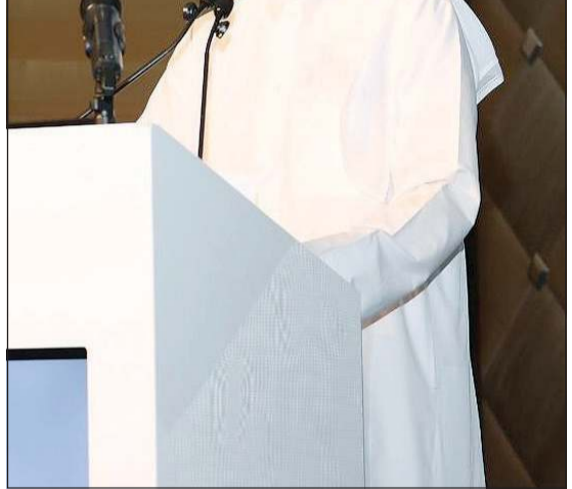
عصام الصقر ملياً كلمته

الكويت، وترسيخ مكانته كشريك أول للحكومة في تمويل المشاريع الاستراتيجية الكبرى، إلى جانب دوره في تمكين القطاع الخاص وتوفير الحلول التمويلية التي تدعم النمو الاقتصادي. واختتم الصقر كلمته بتوجيه الشكر إلى القائمين على الملتقى، معرباً عن تطلعه إلى مستقبل أكثر إشراقاً وازدهاراً للكويت.