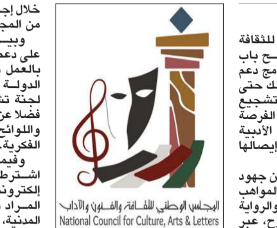
المجلس الوطني للثقافة والفنون والآداب National Council for Culture, Arts & Letters

خلال إجازة التفرغ الأبوي الممنوحة من المجلس الوطني. وبين أن المؤلف الذي يحصل على دعم الطباعة لا يحق له التقدم بالعمل ذاته للمشاركة في جائزة الدولة للإبداع أو طلب دعم من لجنة تشجيع المؤلفات المحلية، فضلاً عن ضرورة الالتزام بالقوانين واللوائح المنظمة للنشر والملكية الفكرية. وفيما يتعلق بأكبة التقديم، اشترط المجلس إرفاق نسخة إلكترونية PDF من مسودة العمل المراد دعمه، وصورة البطاقة المدنية، وسيرة ذاتية لمقدم الطلب، إلى جانب كتاب موجه للأمين العام واستكمال استمارة الدعم المعتمدة. ويؤكد هذا البرنامج استمرار المجلس الوطني للثقافة والفنون والآداب في تبني المبادرات الداعمة للمبدعين الكويتيين، وحرصه على توفير بيئة ثقافية تساهم في تعزيز الإنتاج الأدبي المحلي وإثراء المكتبة الكويتية بإصدارات جديدة تعكس تنوع التجارب الفكرية والإبداعية لأبناء الكويت.