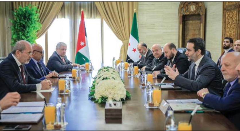
جانب من المباحثات السورية-الأردنية في قصر تشرين بدمشق

مختلف المجالات. كما تمثل الزيارة محطة جديدة في مسار الشراكة المؤسسية المستدامة القائمة على المصالح المشتركة والمتابعة الدورية للملفات ذات الاهتمام المتبادل بين البلدين الجارين، بحسب قناة الإخبارية السورية.