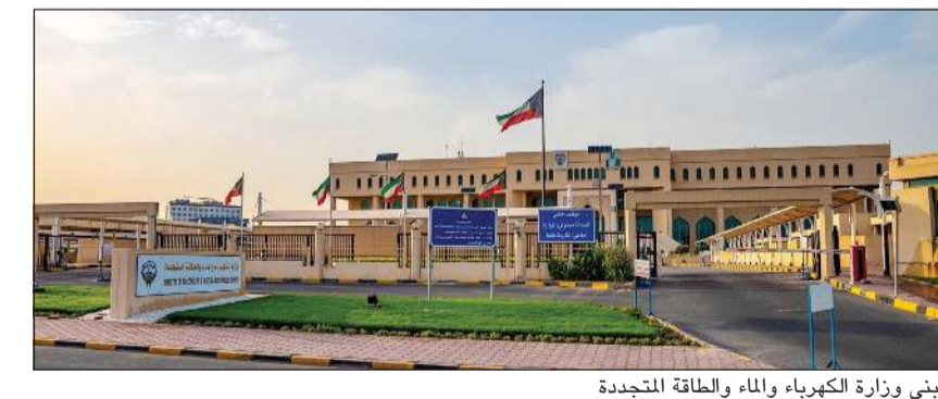
مبنى وزارة الكهرباء والماء والطاقة المتجددة

الذي يشهد زيادة خلال أشهر الصيف. وتنتظر وزارة الكهرباء والماء موافقة ديوان المحاسبة على مشروع محطة الدوحة لإنتاج المياه بالتناضح العكسي في مرحلته الثانية تمهيداً لبدء الإجراءات الخاصة بتنفيذه.