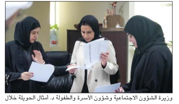
وزيرة الشؤون الاجتماعية وشؤون الأسرة والطفولة د. أمثال الحويطة خلال الجولة في إدارة الشؤون المالية