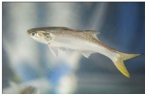
أسماك الشيم المستزرعة في الأحواض

ولفتت إلى أن نظام «الأكوابونك» يقوم على استخدام مياه الأحواض