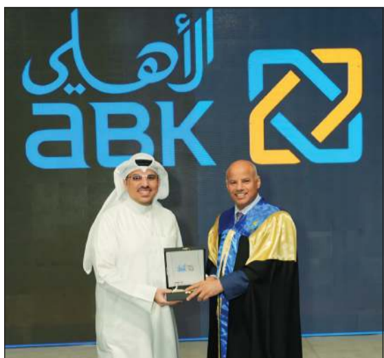
تكريم البنك على رعايته للحفل