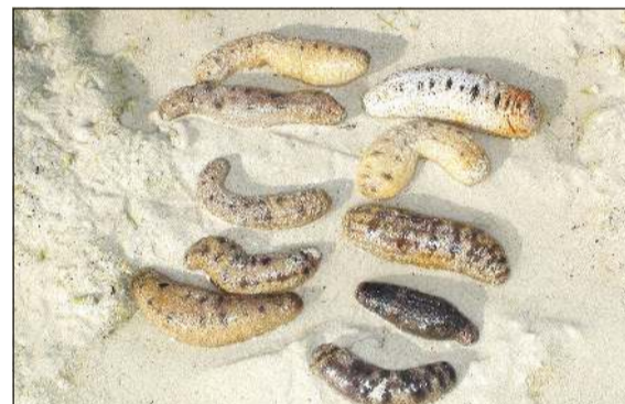
خيار البحر مهم لصناعة الأدوية والصناعات التجميلية