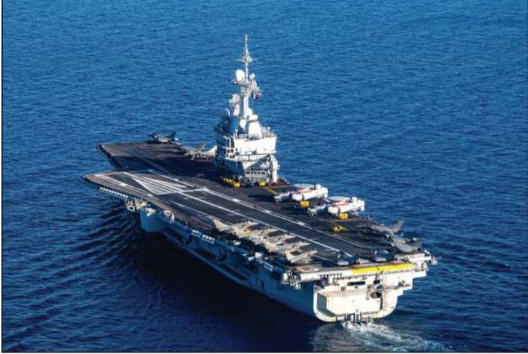
صورة أرشيفية لحاملة الطائرات الفرنسية شارل ديغول قبالة جزيرة كريت اليونانية في إبريل الماضي