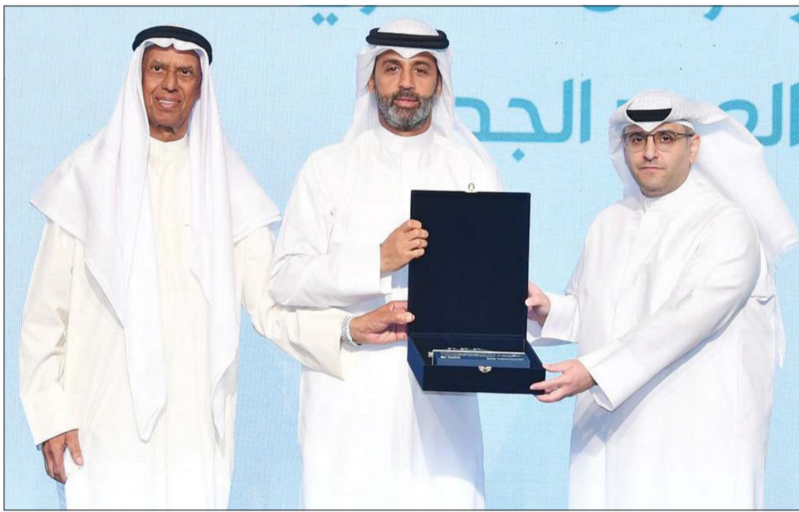
وزير الدولة لشؤون البلدية ووزير الدولة لشؤون الإسكان م. عبد اللطيف المشاري يسلم خالد الشملان درعا تكريمية بحضور م. بدر السلطان

المجموعة تواصل دعم مشروعات الإسكان والتنمية في الكويت