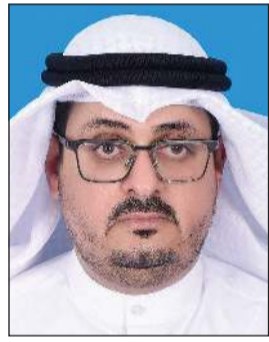
د. فيصل العدواني

أعلن الوكيل المساعد لشؤون البعثات والمعادلات والعلاقات الثقافية بوزارة التعليم العالي د. فيصل العدواني عن فتح باب التسجيل في خطة البعثات الخارجية السنوية للعام الجامعي 2026/2027 اعتبارا من أمس الأحد 14 الجاري حتى الثلاثاء 7 يوليو، داعيا الطلبة الراغبين في الابتعاث إلى الاطلاع على الشروط والضوابط المعتمدة واستكمال إجراءات التسجيل عبر الموقع الإلكتروني للوزارة.