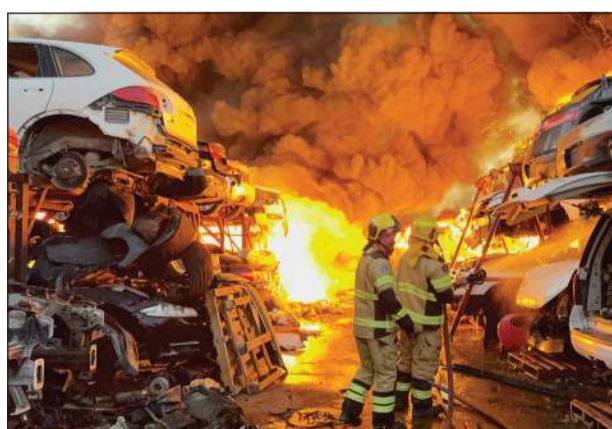
رجال إطفاء مراكز الشقاييا والجهراء الحرفي وكاظمة والبعد والإسناد والاستقلال تعاملوا مع حريق سكراب النعائم

أعلنت قوة الإطفاء العام عن تمكن 6 فرق تابعة لها من السيطرة فجر أمس على حريق اندلع في سكراب النعائم بمنطقة السالمي دون تسجيل أي إصابات.