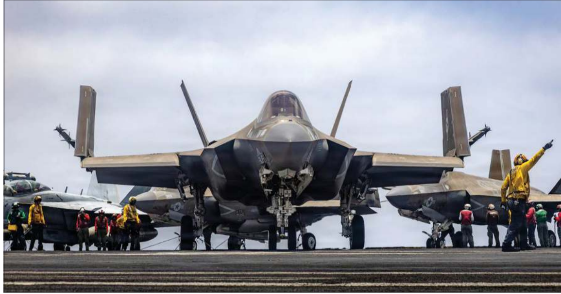
مقاتلات تابعة للبحرية الأميركية تستعد للإقلاع من حاملة الطائرات يو إس إس أبراهام لينكولن أثناء عبورها بحر العرب