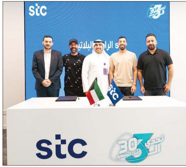
جانب من حفل توقيع الرعاية في مقر الشركة