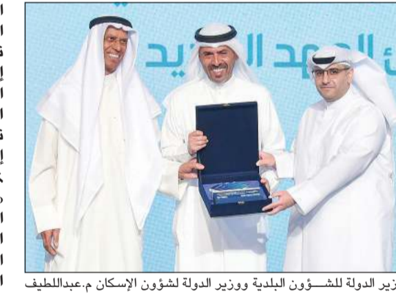
وزير الدولة لشؤون البلدية ووزير الدولة لشؤون الإسكان م. عبد اللطيف المشاري مكرم طارق العبدساني

العبدساني نائب الرئيس التنفيذي لشركة المباني، تقديراً للمساهمة في إنجاح ملتقى الكويت الثاني لمشروعات الدولة التنموية (ENCON5)، وتقديرًا لمساهمة الشركة في إنجاح ملتقى الكويت الثاني لمشروعات الدولة التنموية (ENCON5)، وتعكس الرعاية الذهبية للمباني التزامها بدعم الجهود الوطنية الرامية إلى تطوير القطاع الإسكاني وتعزيز الشراكة بين القطاعين العام والخاص، انطلاقاً من أهمية التنمية الإسكانية كأحد المحركات الرئيسية للتنمية الاقتصادية والاجتماعية في دولة الكويت. كما تتطلع الشركة إلى أن تساهم مخرجات الملتقى في دعم مسيرة التنمية الوطنية وتعزيز جهود التطوير العمراني والإسكاني في الكويت.