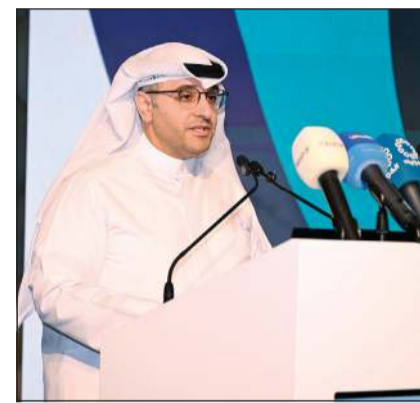
م.عبداللطيف المشاري (أحمد علي)

أكد وزير الدولة لشؤون البلدية ووزير الدولة لشؤون الإسكان م.عبداللطيف المشاري، أن الملف الإسكاني يمثل أولوية وطنية ثابتة ويحظى باهتمام ودعم القيادة السياسية نظراً لأهميته في تحسين جودة حياة المواطنين وتسريع وتيرة التنمية العمرانية في البلاد.