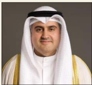
المستشار ناصر السميطة

والتشريعات والانتهاج من عدد كبير منها، والتي يبلغ عددها 982 قانوناً ساريًا في البلاد. وشدد الوزير السميطة على أن الظروف التي مرت بها المنطقة واستهداف الكويت لم تعطل اجتماعات اللجان، وهي حالياً تعمل بأقصى قدرة ممكنة لإنجاز عدد كبير من تلك القوانين التي سنعلن عنها قريباً.