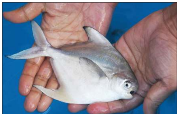
أسماك الزبيدي المستزرعة في معهد «الأبحاث»