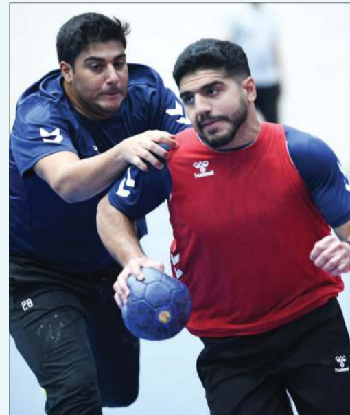
جانب من تدريبات منتخبنا الوطني لشباب اليد