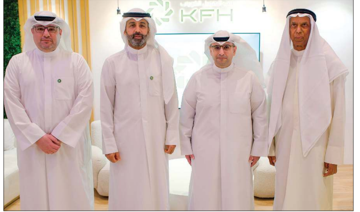
وزير الدولة لشؤون البلدية ووزير الدولة لشؤون الإسكان م. عبد اللطيف المشاري وخالد الشملان ويوسف الرويح وم. بدر السلطان

تقديم حلول تمويلية متكاملة تساهم في نمو القطاع العقاري واستدامته