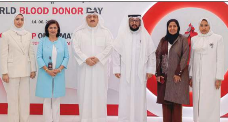
وزير الصحة د. أحمد العوضي ووكيل وزارة الصحة الشيخ د. سلمان خليفة الصباح ومديرة الإدارة المركزية للدم والعلاج الخلوي بوزارة الصحة د. ريم الرضوان مع عدد من الحضور

ريم الرضوان في تصريح مماثل، أن الإدارة تؤدي دوراً محورياً في تنظيم وتطوير خدمات التبرع بالدم والعلاج الخلوي وضمان استمرارية الإمدادات وتوفير مخزون آمن ومستدام من الدم ومشتقاته بما يلبي احتياجات النظام الصحي في مختلف الظروف. وأضافت الرضوان أن اليوم العالمي للتبرع بالدم يمثل مناسبة إنسانية رائعة تجدد فيها قيم العطاء والتكافل المجتمعي ويجسد الدور الحيوي الذي يؤديه المتبرعون في دعم المنظومة الصحية وإنقاذ الأرواح، مشيرة إلى أن التبرع بالدم يقوم على ثقافة المبادرة الإنسانية والعطاء دون مقابل ويعزز ركيزة أساسية في استدامة خدمات الدم وتعزيز جاهزية النظام الصحي.