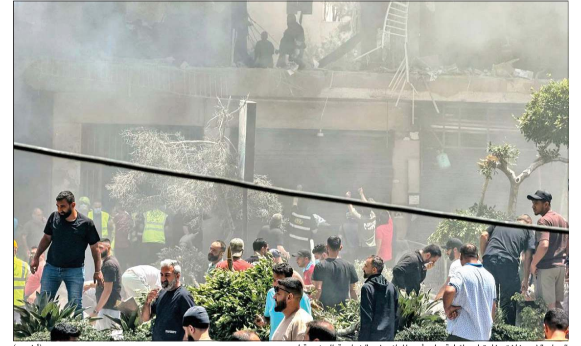
الدمار الذي خلفته غارة إسرائيلية على أحد المباني في الضاحية الجنوبية لبيروت (أ.ف.ب)

لهذه الاعتداءات المتكررة، وضمان الامتثال لميثاق الأمم المتحدة والقرارات الدولية ذات الصلة». وتابع: «في الوقت الذي تجري فيه المفاوضات بين لبنان وإسرائيل في واشنطن، برعاية أميركية، ويتم طرح إجراءات لبناء الثقة وتثبيت وقف الأعمال العدائية وتهيئة الظروف اللازمة للتوصل إلى حل سلمي ومستدام يضمن الأمن والاستقرار في المنطقة، وانسحاب إسرائيل إلى ما وراء الحدود المعترف بها دولياً، فإن استهداف إسرائيل لعناصر الجيش اللبناني يقوض بصورة مباشرة الجهود الدبلوماسية المذكورة، ويهدد المساعي الرامية إلى تعزيز سلطة الدولة اللبنانية وبسط سيادتها على كامل أراضيها بقواها الذاتية حصراً». في المقابل، أكد البطريك الماروني الكاردينال بشارة الراعي، في عظة الأحد ببيروت، أن: «الأحداث تتكرر بطريقة غير مقبولة والمواطن ينتظر بارقة أمل، وما يضاعف الوجد سقطت أرياء من المدنيين يدفعون ثمن حرب لا يريدونها». وأشار إلى أن «الناس سئموا لغة الحرب والتهديد والانتظار الطويل لذلك نصلح لتتجج المفاوضات». أما متروبوليت بيروت