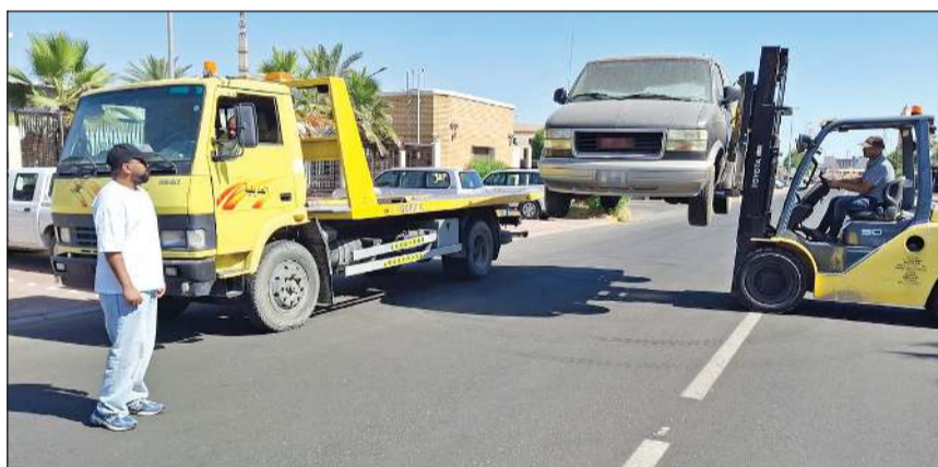
جانب من رفع السيارات المهملة

لسيارة وقارب مهملين تهبدا لإزالتها بعد انتهاء المدة المحددة، بالإضافة إلى تحرير 427 مخالفة نظافة عامة واستغلال مساحة.