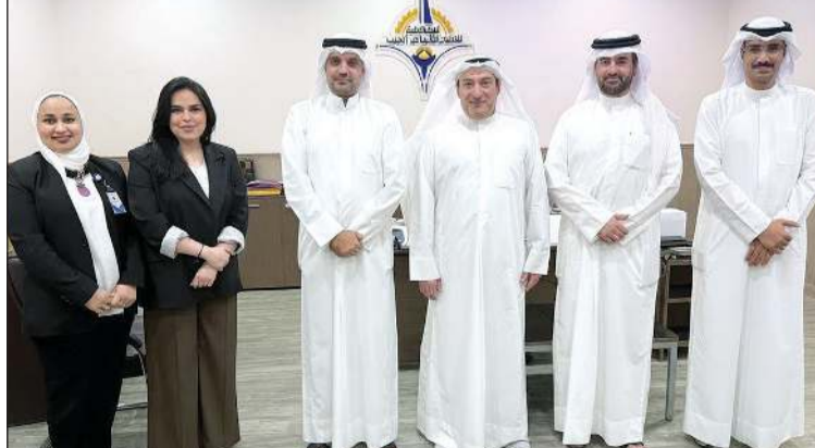
جانب من زيارة وفد أكاديمية سعد العبدالله للعلوم الأمنية إلى «التطبيقي»