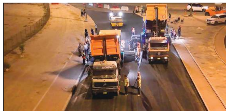
صورة أرشيفية لصيانة الطرق في إحدى المناطق