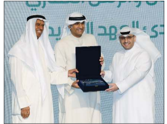
وزير الدولة لشؤون البلدية ووزير الدولة لشؤون الإسكان م. عبد اللطيف المشاري يكرم عبد اللطيف النصف بحضور م. بدر السلطان

الاقتصادية في الكويت. ونؤمن في «المركز» بأن القطاع المالي والاستثماري يؤدي دوراً محورياً في دعم هذه الأولويات من خلال تقديم حلول استثمارية وتمويلية مبتكرة تساهم في توجيه رؤوس الأموال نحو القطاعات الاستراتيجية وخلق قيمة مستدامة للاقتصاد الوطني. وختم النصف: تعكس مشاركة «المركز» في الملتقى استراتيجيته الرامية إلى الانخراط الفاعل في المبادرات التي تدعم التحول الاقتصادي وأهداف التنمية المستدامة في دولة الكويت، وبصفته إحدى المؤسسات الرائدة إقليمياً في إدارة الأصول والخدمات المصرفية الاستثمارية منذ أكثر من 50 عاماً، يواصل «المركز» الاستفادة من خبراته وإمكاناته لدعم الفرص الاستثمارية في القطاعات الاستراتيجية، وتعزيز تدفق رؤوس الأموال، وتشجيع مساهمة القطاع الخاص في المشاريع التي تساهم في تحقيق نمو اقتصادي مستدام وتعزيز مرونة الاقتصاد الوطني.