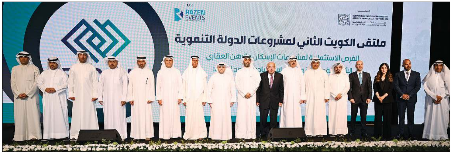
وزير الدولة لشؤون البلدية ووزير الدولة لشؤون الإسكان م.عبداللطيف المشاري ومتوسطا عصام الصفر وخالد الشلمان وم.بدر السلطان ويبدو طارق العدساني ومشاري المحيلان وأحمد الأنصاري وعمر الرويح وعبداللطيف النصف في لقطة جماعية مع المشاركين والمتحدثين في الملتقى