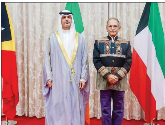
رئيس جمهورية تيمور الشرقية الديمقراطية د.خوسيه راموس هورتا خلال حفل تسليم أوراق اعتماد سفيرنا لدى إندونيسيا خالد جاسم الياسين

كوالالمبور - كونا: قدم سفيرنا لدى إندونيسيا خالد الياسين أوراق اعتماده سفيراً موقفاً فوق العادة وغير مقيم لدى جمهورية تيمور الشرقية إلى رئيس راموس هورتا، وذلك خلال مراسم رسمية أقيمت الجمعة.