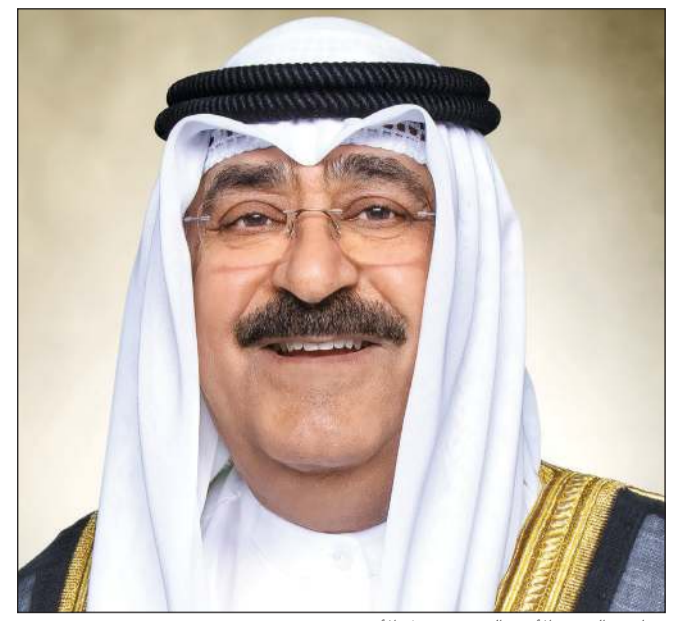
صاحب السمو الأمير الشيخ مشعل الأحمد

كونا: بعث صاحب السمو الأمير الشيخ مشعل الأحمد ببرقية تهنئة إلى الرئيس فلاديمير بوتين رئيس روسيا الاتحادية الصديقة عبر فيها سموه عن خالص تهانيه بمناسبة ذكرى العيد الوطني لبلاده، متمنيا سموه له موفور الصحة والعافية، ولروسيا الاتحادية وشعبها الصديق كل التقدم والازدهار. وبعث صاحب السمو الأمير الشيخ مشعل الأحمد ببرقية تهنئة إلى الرئيس فيريناندو رومالديز ماركوس الابن رئيس جمهورية الفلبين الصديقة عبر فيها سموه عن خالص تهانيه بمناسبة ذكرى الاستقلال لبلاده، متمنيا سموه له موفور الصحة والعافية ولجمهورية الفلبين وشعبها الصديق كل التقدم والازدهار.