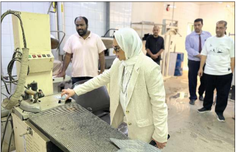
وزيرة الشؤون الاجتماعية وشؤون الأسرة والطفولة د.أمثال الحويلة خلال الزيارة المفاجئة إلى مركز رعاية وتأهيل المعاقين في الصحاحية

الملاحظات، ووجهت بإحالة عدد من المسؤولين إلى التحقيق للوقوف على أوجه القصور وتحديد المسؤوليات، مؤكدة أن أي تهاون بمسألة سلامة النزلاء أو سلامتهم لن يقبل أو يتم التغاضي عنه. وشددت الحويلة على أن سلامة النزلاء وجودة الرعاية المقدمة لهم فوق كل اعتبار، وأنها ستتابع بنفسها إجراءات التحقيق ومعالجة جميع الملاحظات، وستواصل الزيارات الميدانية المفاجئة للتأكد من الالتزام بالمعايير المطلوبة. وأكدت أن المسؤولية في مراكز الرعاية ليست شكلية، وأن أي تقصير سيقابل بإجراءات حازمة، مشددة على أن كرامة النزلاء وحقوقهم أمانة لا مجال للتهاون فيها.