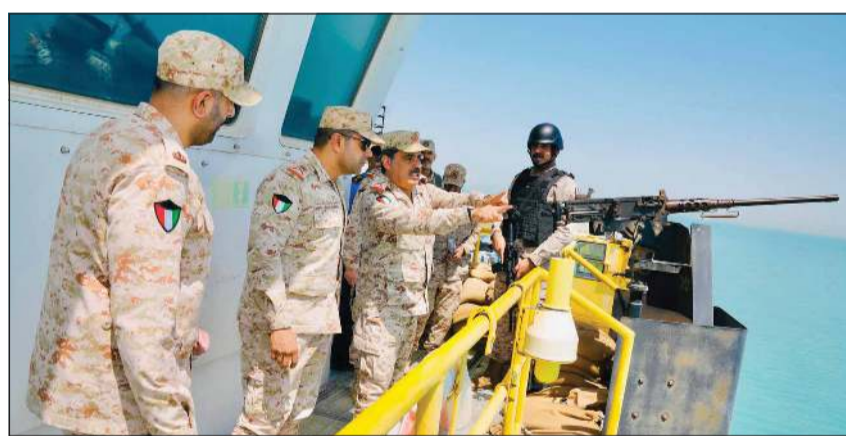
نائب رئيس الأركان العامة للجيش اللواء الركن طيار الشيخ صباح الجابر خلال الجولة التفقدية على أحد المواقع العسكرية

قام نائب رئيس الأركان العامة للجيش اللواء الركن طيار الشيخ صباح الجابر بجولة تفقدية شملت عدداً من المواقع العسكرية. وأعرب عن تقديره لما لمس من انضباط وجاهزية لدى منتسبي الجيش الكويتي، مؤكداً أن مواصلة أداء مهامهم بكل كفاءة وإقتدار في مختلف المواقع، يجسد روح المسؤولية والانتماء بالواجب الوطني، ويعكس حرصهم الدائم على صون أمن الوطن واستقراره.