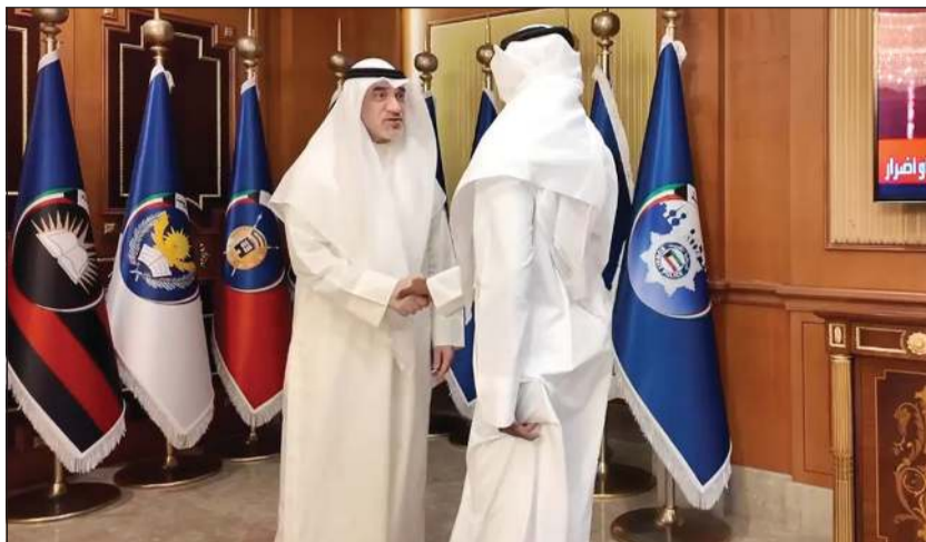
النائب الأول لرئيس مجلس الوزراء ووزير الداخلية الشيخ فهد اليوسف مكرما أحد ضباط الصف المرمقين

وأكدت وزارة الداخلية أن الترقية الاستثنائية تأتي تجسيدا لنهج الوزارة في تقدير المتميزين وتحفيز الكفاءات الأمنية.