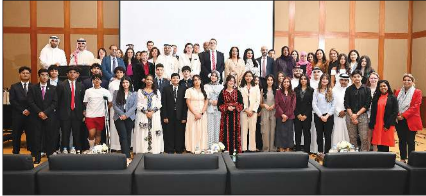
نائب مساعد وزير الخارجية لشؤون المنظمات الدولية المستشار عبدالمحسن المنصور والمنسقة القومية للأمم المتحدة في الكويت غادة الطاهر وسفيرة كندا تارا شورواتر ونائب رئيس البعثة البريطانية لدى الكويت ستيفوارت سمرز مع «السفراء الشباب»

الخضراء، والانتماء الاجتماعي، ما مكّنهم من تبني رؤية أكثر شمولاً واستدامة تجاه مجتمعاتهم. بدوره، أكد نائب رئيس البعثة البريطانية لدى الكويت ستيفوارت سمرز أن الشباب يمثلون محورا رئيسيا في التصدي للتحديات العالمية، لافتا إلى أن البرنامج أتاح للمشاركين فرصة التفاعل مع خبراء ومؤسّسات دولية، واكتساب خبرات عملية في القيادة والعمل الجماعي. وأوضح سمرز أن الأزمات والتحديات التي شهدها المنطقة والعالم خلال الفترة الماضية أبرزت أهمية النزوة والقدرة على التكيف، مشيدا على أن المجتمعات المستدامة تستمد قوتها من التعاون وروح المسؤولية المشتركة في مواجهة التحديات.