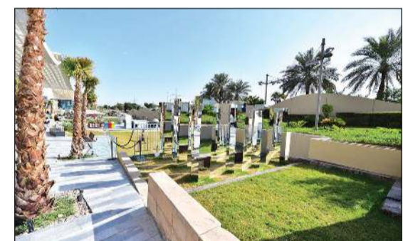
مناطق خضراء في المساحات الخارجية من الأبنية-الكويت

الأبنية-الكويت - الخبر وسوق صباح وأفتنورا مول نحو 4,4 مليون كيلواط ساعة سنوياً من الطاقة الشمسية، كذلك انخفض استهلاك الطاقة للمالك في الأبنية-الكويت بنسبة 5٪ خلال عام 2025 مقارنة بعام 2024، وانخفض استهلاك المياه بنسبة 3٪ دعماً للجهود الوطنية في ترشيد استهلاك المياه.