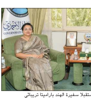
محافظ الأحمدى الشيخ حمود الجابر مستقبلا سفيرة الهند بارامياتا تريباتي

استقبل محافظ الأحمدى الشيخ حمود الجابر الأحمدي بمكتبه في ديوان عام المحافظة أمس، سفيرة جمهورية الهند لدى الكويت بارامياتا تريباتي، حيث جرى التعارف وتبادل الأحاديث الودية التي تناولت العلاقات الثنائية بين البلدين وسبل تعزيزها في جميع المجالات. ورحب المحافظ بالسفيرة، متمنيا لها التوفيق في مهام عملها والدفع بعلاقات البلدين إلى آفاق أرحب. من جهتها، أعربت السفيرة بارامياتا تريباتي عن سعادتها وامتنانها لحفاوة الاستقبال، متمنية الرعاية البالغة التي تحظى بها البعثة الدبلوماسية ومواطني بلادها على الصعيدين الرسمي والشعبي في بلدهم الكويت.