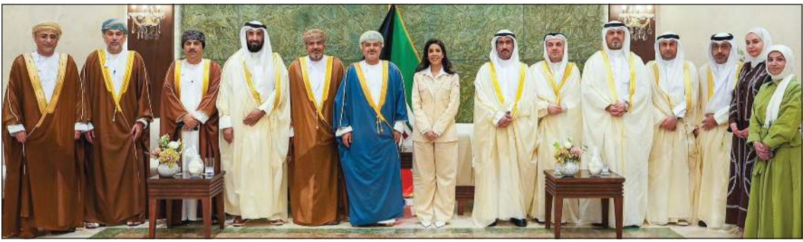
وزيرة الأشغال العامة د.نورة المشعان مستقبلة وزير النقل والاتصالات وتقنية المعلومات في سلطنة عمان م.سعيد بن حمود المعولي والوفد المرافق له بحضور وكيل وزارة الأشغال بالتكليف م. عبد الرشيد وقيادات «الأشغال»

المقيمين في البلدين الشقيقين. وأكدت أهمية توحيد الجهود وتبادل الخبرات بما يدعم مسيرة العمل الخليجي المشترك، ويعزز دول أواصر التكامل والتعاون بين دول مجلس التعاون لدول الخليج العربية تحقيقاً للمصالح المشتركة وتطلعات شعوب المنطقة نحو مزيد من التنمية والأزدهار.