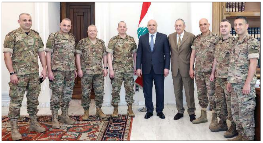
رئيس الجمهورية العماد جوزف عون مستقبلاً قائد الجيش العماد رودولف هيكل والوفد اللبناني إلى مفاوضات واشنطن

مقر المجلس بباريس، وتمحور اللقاء حول المستجدات الميدانية والدبلوماسية في ضوء مسار المفاوضات المباشرة بين لبنان وإسرائيل، فضلاً عن العلاقات التاريخية التي تربط البلدين والدور الفرنسي الثابت في دعم لبنان.