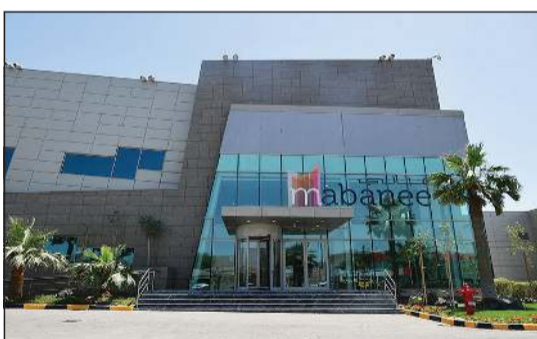
مقر شركة المباني