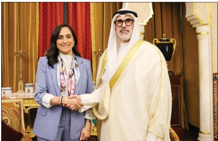
وزير الخارجية الشيخ جراح الجابر مع وزيرة خارجية كندا أنيتا أناند

الجابر اتصالا هاتفيا من نائب رئيس مجلس الوزراء وزير خارجية دولة الإمارات العربية المتحدة الشقيقة، سمو الشيخ عبدالله بن زايد حيث جرى خلال الاتصال إدانة الاعتداءات الإيرانية الأثمة والمتكررة ضد دولة الكويت.