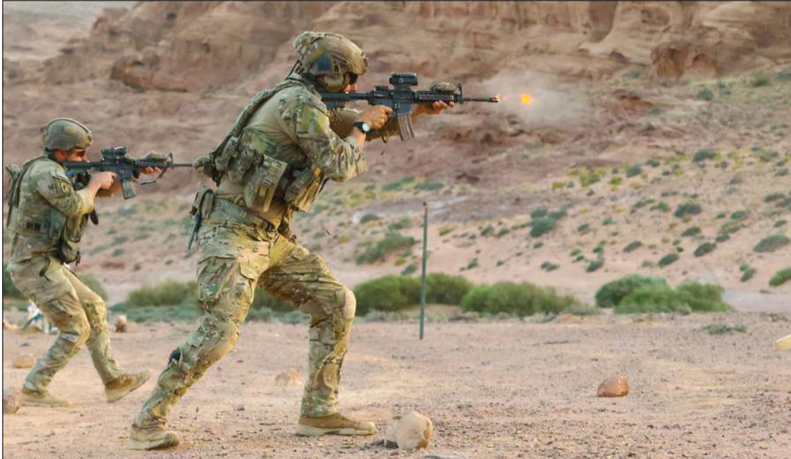
الجنود المظليون الأميركيون أجروا تدريبات على الأسلحة الخفيفة خلال تمرين بالخيرة الحية في الشرق الأوسط (ستكوم)

وكالات: أعلن الجيش الأميركي تعطيل ناقلة نفط في خليج عمان أمس الأول، بعد أن انتيكت السفينة الحصار المفروض على إيران بمحاولتها نقل نفط إيراني، لتكون بذلك ثالث سفينة تجارية تعطيلها القوات الأميركية هذا الأسبوع. وقالت القيادة المركزية الأميركية «ستكوم» أنها تحركت ضد ناقلة النفط «جليفير» التي ترافع علم غينيا بيساو، أثناء محاولتها نقل النفط من إيران عبر خليج عمان، وأطلقت طائرة أميركية صاروخين من طراز «هيفالير» على غرفة محركات السفينة بعد أن رفض طاقمها مرارا وتكرارا الامتثال لتوجيهات القوات الأميركية. وفي وقت سابق، عطلت طائرات أميركية سفينتين ترافعان علم بالو، هما «ماريفكس» و«سيتيبيلو»، يومي الاثنين والثلاثاء على التوالي. وقالت «ستكوم»: انتهكت «ماريفكس» الحصار بمحاولتها الإبحار إلى ميناء إيراني، بينما حاولت «سيتيبيلو» نقل نفط إيراني. وأضافت أن قوات «ستكوم» قامت بتعطيل تسع سفن مخالفة، وإعادة توجيه 135 سفينة ملتزمة، والسماح بمرور 42 سفينة تحمل مساعدات إنسانية منذ بدء الحصار في 13 أبريل.