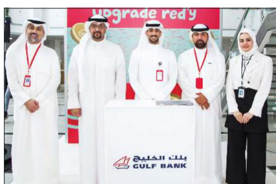
صورة جماعية لفريق مبيعات بنك الخليج

الميزانيات، واتخاذ قرارات مالية مدروسة. وقد أبدى الطلبة اهتماماً كبيراً بالمزايا التي يوفرها الحساب الرقمي، مثل التحكم ببطاقة الدفع، والعروض الحصرية، إلى جانب الدعوات لحضور فعاليات مختارة تعزز نمط حياتهم وتواكب تطوراتهم. ويمثل حساب red أساساً من إستراتيجية بنك الخليج الموجهة للشباب، إذ يوفر مزايا تتجاوز الخدمات المصرفية التقليدية، من خلال دمج المكافآت والترفيه والتجارب التعليمية، بما يشجع على تبني سلوك مالي مسؤول يتماشى مع أسلوب الجيل الرقمي. أما بطاقة red Plus مسيقة الدفع، فتوفر وسيلة دفع آمنة وسهلة الاستخدام تمنح الشباب تجربة مالية عملية ضمن إطار منظم وآمن.