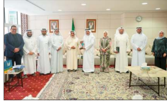
وكيل وزارة الشؤون د. خالد العجمي مستقبلاً وفد «النجاح الخيرية»

المثمر مع الوزارة في عدة مجالات، ومنها إسهامها في تطوير وتطبيق برنامج المساعدات المركزي، مشيداً بالدور الكبير الذي قامت به الجمعية في دعم هذا المشروع الوطني الحيوي، من جانبهم، أعرب أعضاء وفد جمعية النجاح الخيرية عن تقديرهم للدعم والتعاون الذي تقدمه وزارة الشؤون، مؤكداً استمرار الجمعية في توظيف جميع إمكانياتها الفنية والإدارية لخدمة المشاريع الوطنية التي تزيد فاعلية العمل الخيري.