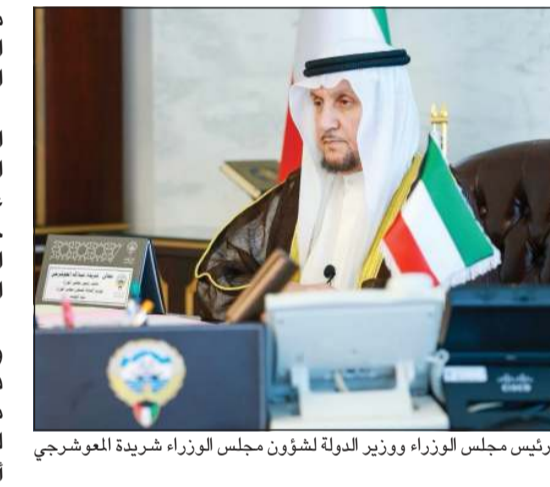
نائب رئيس مجلس الوزراء ووزير الدولة لشؤون مجلس الوزراء شريدة المعورج

ووجدد رفض البرلمان العربي وإدانته لهذه الاعتداءات، مؤكدا دعم الدول العربية في اتخاذ ما يلزم من إجراءات مشروعة لحماية أمنها وسيادتها وسلامة أراضيها.