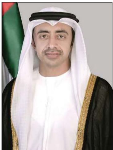
نائب رئيس الوزراء وزير خارجية الإمارات سمو الشيخ عبدالله بن زايد

جراح الجابر تلقى اتصالاً من نظيره الإماراتي: تأكيد حق الكويت في اتخاذ الإجراءات اللازمة لصون سيادتها