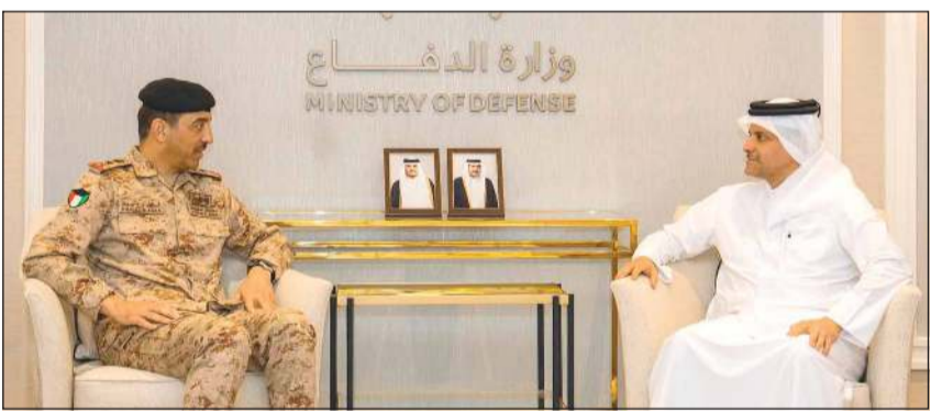
نائب رئيس الوزراء ووزير الدولة لشؤون الدفاع القطري الشيخ سعود بن عبد الرحمن ورئيس الأركان العامة للجيش الفريق الركن خالد الشريعان

الدوحة - كونا: بحث نائب رئيس الوزراء ووزير الدولة لشؤون الدفاع القطري الشيخ سعود بن عبد الرحمن آل ثاني ورئيس الأركان العامة للجيش الكويتي الفريق الركن خالد الشريعان عدداً من الموضوعات ذات الاهتمام المشترك، إلى جانب استعراض العلاقات الثنائية وسبل تطويرها وتعزيزها بما يعكس عمق العلاقات الأخوية التي تجمع البلدين الشقيقين.