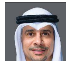
وزير الدولة لشؤون الشباب والرياضة د.طارق الجلاهمة

لجنة إزالة التعديلات تتولى بالتنسيق مع الجهات المختصة متابعة مدى الالتزام بشروط وضوابط الاستغلال المقررة واتخاذ الإجراءات القانونية وذلك عن طريق القيام بأعمال المعاينة والتفتيش والكشف الدوري وفقاً للأختصاصات المقررة قانوناً وبالتنسيق مع الجهات المعنية. وأكد أن اللجنة تعمل وفق منهجية واضحة تقوم على تطبيق القانون على الجميع دون استثناء، مبيناً أن الهدف هو حماية أملاك الدولة وضمان استخدامها بالشكل الذي خصصت من أجله بما يحفظ حقوق المستفيدين المتزمنين ويمنع أي ممارسات تؤدي إلى الإضرار بالمصلحة العامة أو الإخلال بالعدالة في توزيع واستغلال الحظائر والأسطبلات.