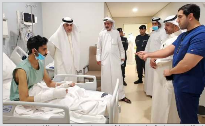
النائب الأول لرئيس مجلس الوزراء ووزير الداخلية الشيخ فهد اليوسف يطمئن على حالة المصاب عايض العنبيبي

اليوسف: توفير الرعاية الطبية لمصابي الاعتداء الإيراني الآثم