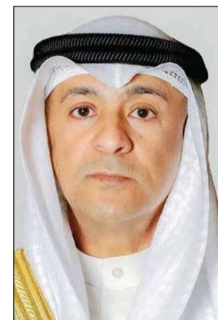
أمين عام مجلس التعاون لدول الخليج العربية جاسم الديوي

ودعت وزارة الخارجية السعودية في بيان إلى التهديد وتجنب التصعيد وتغليب الحكمة والعودة إلى العمل الدبلوماسي واستكمال المفاوضات البناءة التي ترعاها باكستان وما رافقها من جهود لدولة قطر بما يجنب المنطقة