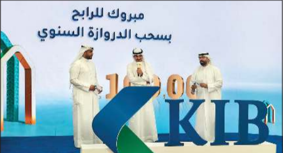
لحظة توزيع الفائز بجائزة 100 ألف دينار بسحب «الدروازه»