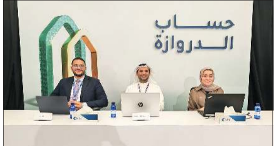
السحبوبات أجريت تحت إشراف شركتي تدقيق عالميتين وفرق الرقابة الداخلية في البنك