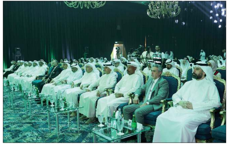
الإدارة التنفيذية في مقدمة الحضور