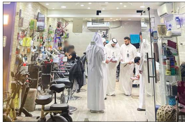
جانب من التفتيش على أحد الصالونات

وكونا: أعلنت وزارة الصحة عن تحرير 50 مخالفة بحق عدد من الصالونات والمعاهد الصحية المخالفة للاشتراطات الصحية المعتمدة، وذلك ضمن حملات تفتيش مشتركة نفذت في مختلف محافظات البلاد لحماية الصحة العامة وتعزيز الرقابة الوقائية على المنشآت ذات العلاقة بالمباشرة بصحة وسلامة الجمهور.