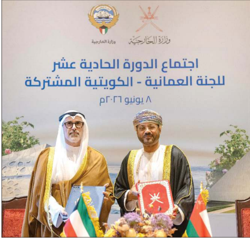
وزير الخارجية الشيخ جراح الجابر ووزير خارجية سلطنة عمان بدر البوسعيد

وزير خارجية عمان: انتظام انعقاد اللجنة المشتركة يعكس ما نحظى به من اهتمام من قيادتي البلدين