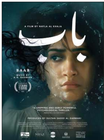
بوستر فيلم «باب»