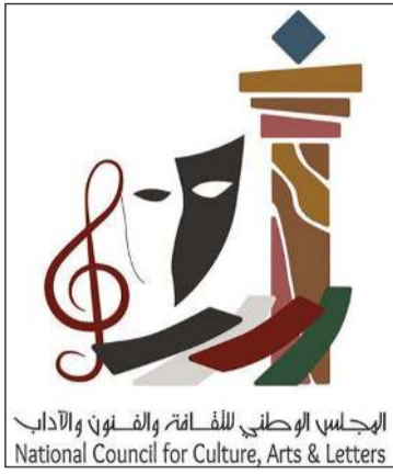
المجلس الوطني للأدب والفنون والآداب National Council for Culture, Arts & Letters

أو بإحدى اللغات العالمية، مع عدم قبول الأعمال المشتركة أو المؤلفات التي سبق أن حظيت بدعم من المجلس أو من جهات حكومية أخرى. وبين المجلس أن التقديم يتطلب توجيه كتاب إلى الأمين العام، وإرفاق صورة البطاقة المدنية والسيرة الذاتية، إضافة إلى تعبئة الاستمارة المخصصة والتوقيع على الإقرار، وتقديم ثمان نسخ من المؤلف، علماً بأن النسخ المقدمة غير مستردة. وأكد المجلس أن الطلب يعتبر ملغى في حال عدم استكمال المستندات المطلوبة أو مخالفة أي من الشروط المعلنة، داعياً المؤلفين الراغبين في الاستفادة من البرنامج إلى المبادرة بالتقديم خلال الفترة المحددة، بما يعزز حضور الكتاب الكويتي ويدعم استمرار الحراك الثقافي والإبداعي في البلاد.