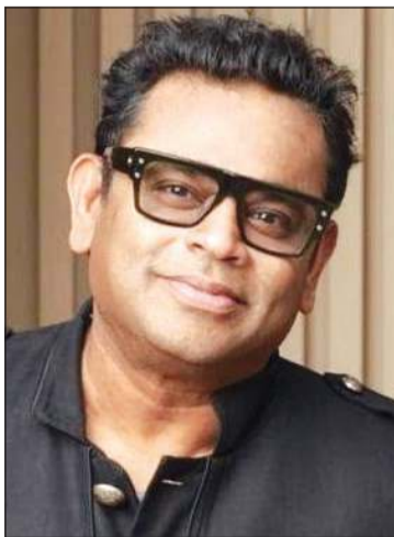
الموسيقار العالمي أي. آر. رحمان

الفاهرة - خلود ابوالمجد يستضيف مهرجان روتردام للفيلم العربي الموسيقار العالمي أي. آر. رحمان، الحائز على جائزة أوسكار وعدة جوائز غرامي، ضمن فعاليات دورته السادسة والعشرين. وستتزامن حضور رحمان مع عرض فيلم «باب» للمخرجة الإماراتية نائلة الخاجة، الذي وضع له موسيقى التصويرية الأصلية، على أن يعقب العرض لقاء حوارى معه أمام الجمهور. ويمثل فيلم «باب» نموذجاً للتعاون الإبداعي المتنامي بين صناع السينما في العالم العربي والهند، من خلال مشاركة أحد أبرز الأسماء في الموسيقى السينمائية العالمية في أول تجربة له مع فيلم عربي. كما يعكس هذا التعاون العلاقة الثقافية الطويلة بين الجمهور العربي والسينما الهندية وموسيقاها. يدور فيلم «باب» حول «وحيدة» التي تتكشف بعد وفاة شقيقتها