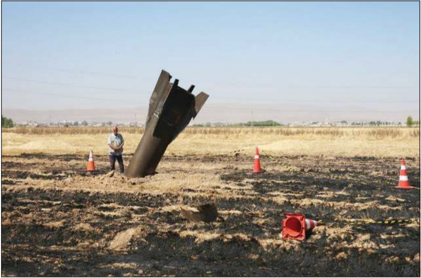
مواطن سوري يقف بجوار صاروخ إيراني سقط في نجها جنوب البلاد

وجاء سقوط الصواريخ الإيرانية في المنطقة الجنوبية نتيجة تصدي الدفاعات الإسرائيلية لصواريخ أطلقتها إيران باتجاه الأراضي المحتلة وعبرت الأجواء السورية لاسيما مناطق دمشق وريفها ومحافظتي درعا والقنيطرة. ونشرت وكالة الأنباء الفرنسية صورة لبقايا أحد الصواريخ سقط في أرض زراعية بمنطقة نجا بريف دمشق ويبدو أنه تسبب في احتراقها. ورصدت «الإخبارية» تحليقا مكثفا لطيران الاحتلال الإسرائيلي في أجواء محافظة درعا.