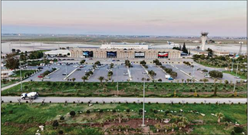
مطار دمشق الدولي

الجوي جاء عقب متابعة مستمرة للأوضاع وتقييم شامل للمخاطر من قبل اللجنة المختصة بالتنسيق مع الجهات المعنية بما يضمن الحفاظ على أعلى مستويات السلامة والأمن في الأجواء السورية وفق المعايير الدولية المعتمدة. وكانت الهيئة العامة للطيران المدني أعلنت مساء أمس الأول إغلاق الممرات الجوية الجنوبية بشكل مؤقت لمدة 12 ساعة على خلفية عودة القصف المتبادل بين إيران وإسرائيل عقب إطلاق إيران موجات من الصواريخ باتجاه إسرائيل. وأضافت الهيئة صباح أمس تمديد الإغلاق، قسلاً أن تعلن إعادة افتتاح المجال الجوي وتشغيل العمليات في مطار دمشق الدولي.