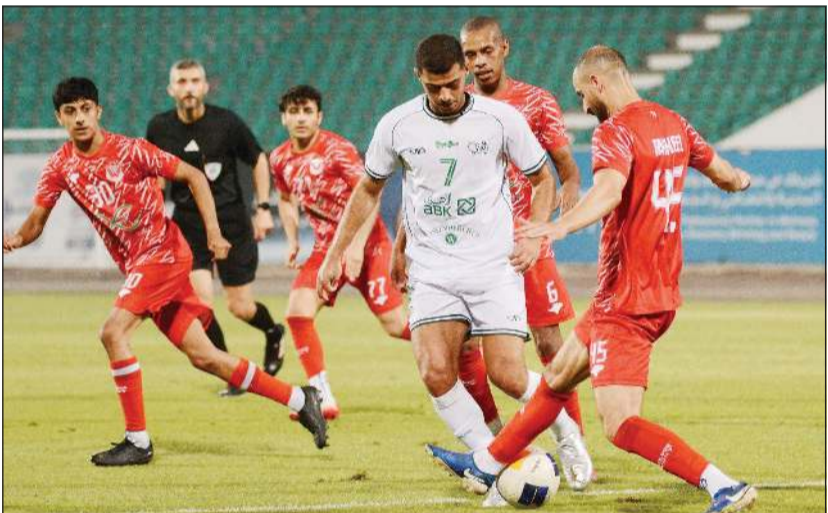
(المركز الإعلامي للعربي)