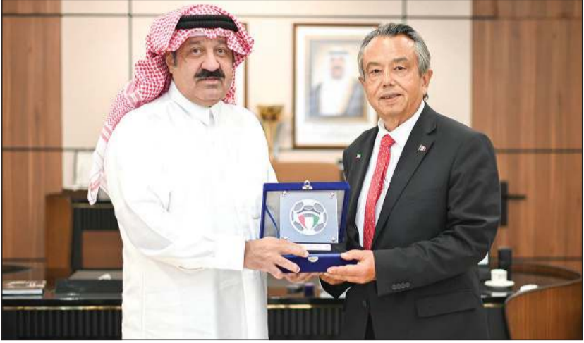
الشيخ أحمد يوسف خلال لقائه مع سفير المكسيك إدواردو هالر

ذات الاهتمام المشترك رياضياً. ويأتي هذا اللقاء قبل مغادرة يوسف إلى المكسيك اليوم، وذلك تلبية لدعوة رئيس الاتحاد الدولي لكرة القدم جيانى إنفانتينو، لحضور حفل افتتاح بطولة كأس العالم، والمباراة الافتتاحية التي ستقام في نيو مكسيكو الخميس المقبل.