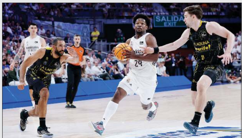
«سلة» ريال مدريد فشلت في تحقيق أي لقب

خرج نادي ريال مدريد لكرة السلة، بطل الدوري الإسباني، خالي الوفاض هذا الموسم للمرة الأولى منذ عام 2011، بعدما أقصى من ربع نهائي الأدوار الإقصائية (بلاي أوف) على يد لاغونا تينيريفي، وذلك بعد أسابيع قليلة من خسارته نهائي «يوروليج». وسقط العملاق المديريدي 2-1 في سلسلة الأولى منذ 16 عاماً. وتعد هذه صفة جديدة تختتم موسماً فوضوا.