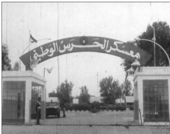
الحرس الوطني.. جهود كبيرة في دعم مؤسسات الدولة

■ قوة الواجب أثبتت خلال العدوان الإيراني الأثم جاهزيتها العالية وأدت مهامها بكل كفاءة واقتدار ■ إيداع الطيران العمودي ضمن منظومة التسليح للاستفادة منه في عمليات الإنقاذ والإخلاء الطبي