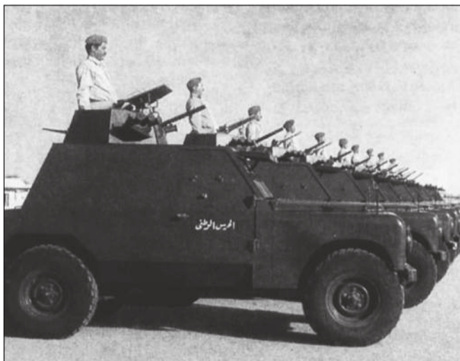
اتباع أحدث الأساليب في التسليح والتدريب

على استمرارية العمل في مختلف الظروف الاستثنائية وكأنت قيادة الحرس الوطني داعماً رئيسياً لمسيرة التأهيل العلمي والثقافي لمنتسبي الحرس إيماناً منه بأن الاستثمار في العنصر البشري هو الركيزة الأساسية للتطوير والتميز. وتجسد ذلك من خلال ابتعاث أعداد كبيرة من منتسبي الحرس الوطني إلى الجامعات والمعاهد داخل الكويت وخارجها للحصول على المؤهلات العلمية المتخصصة وتطوير وتنظيم منظومة الإبتعاث من خلال تشييد لجنة متخصصة للبعثات بما يضمن تحقيق العادلة وتكافؤ الفرص والاستفادة المثلى من البرامج التعليمية.