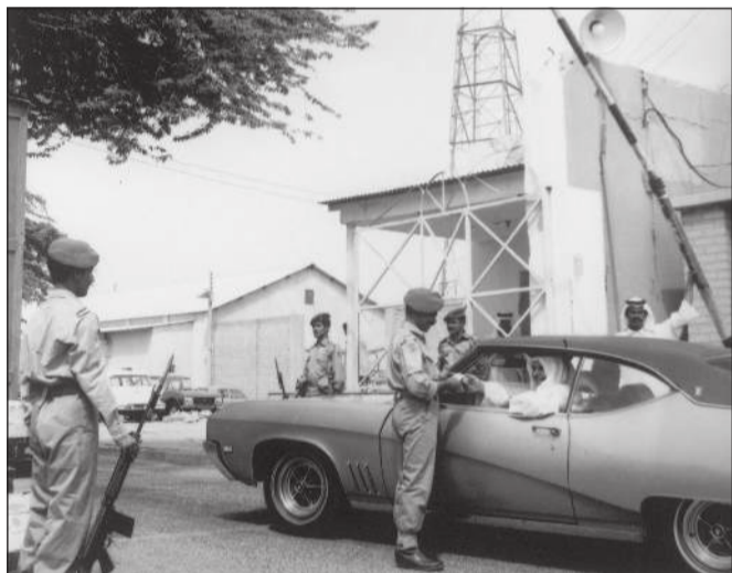
الحرس الوطني.. 59 عاماً من العطاء المتميز في الدفاع عن الوطن