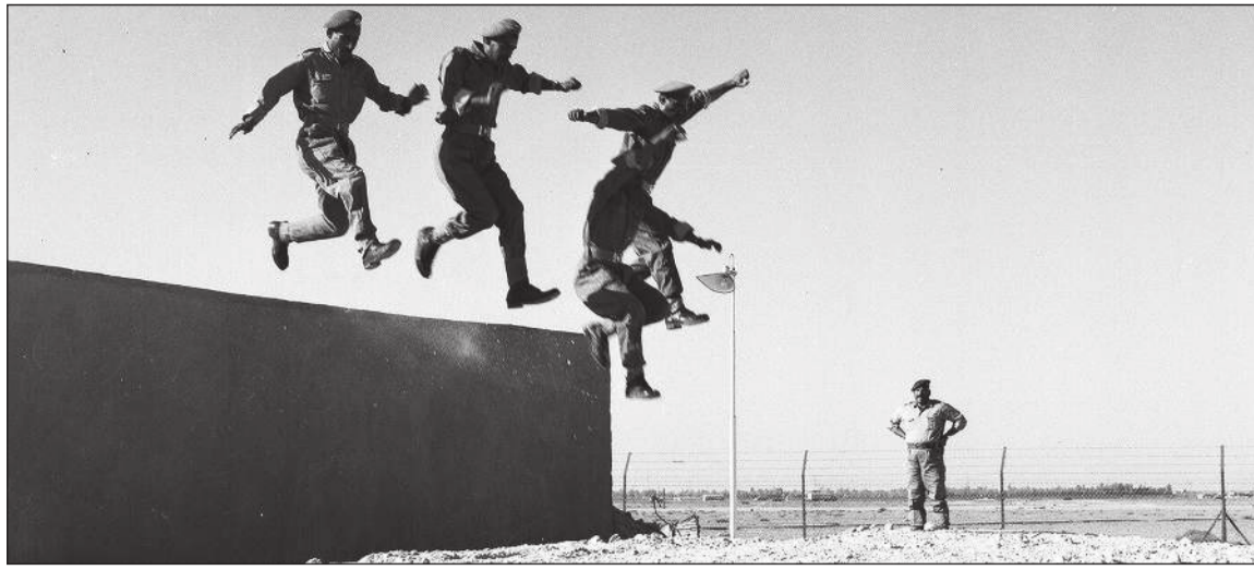
حرص على تعزيز كفاءة القوى البشرية