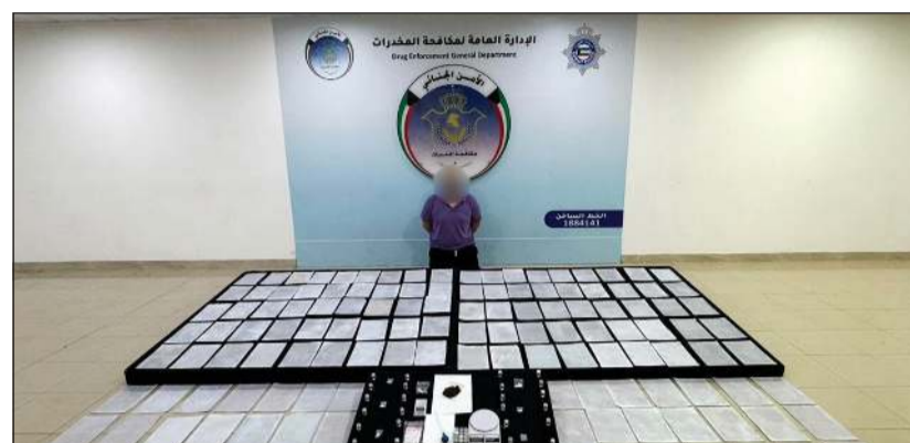
المتهم المصري وأمامه المضبوطات من المواد المخدرة

بوزن إجمالي يقارب 66 غراماً، و68 كيساً من مادة الحشيش بوزن يقارب 144 غراماً، إضافة إلى نحو 160 غراماً من مادة «الكانجا» المخدرة. وأضاف البيان ان عملية الضبط أسفرت أيضاً عن العثور على 265 حبة من المؤثرات العقلية معدة للترويج ومقسمة داخل أكياس صغيرة، إلى جانب 1750 حبة من المؤثرات العقلية، فضلاً عن أدوات ووسائل تستخدم في حفظ وتجهيز المواد المخدرة. وأشارت الوزارة إلى أنه بمواجهة المتهم بالمضبوطات أقر بحيازتها بقصد الاتجار والتعاطي، فتم اتخاذ الإجراءات القانونية اللازمة بحقه وإحالته إلى جهة الاختصاص.