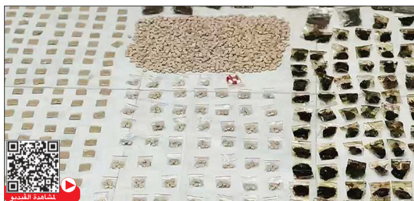
والضبطية الثانية شملت 66 غراماً من الهيروين و304 غرامات من الحشيش ومادة «الكانجا» المخدرة و2015 حبة مخدرة