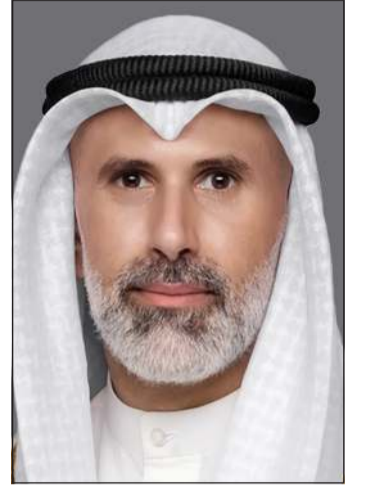
وزير الخارجية الشيخ جراح الجابر

تضامن كامل مع البلدين ودعم لكل ما يتخذانه من إجراءات تحفظ سيادتهما وأمنهما واستقرارهما