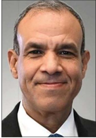
وزير الخارجية المصري د. عبد العاطي