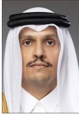
رئيس الوزراء وزير خارجية قطر الشيخ محمد بن عبد الرحمن

وذكرت «الخارجية»، في بيان أنه جرى خلال الاتصال إدانة الاعتداءات الإيرانية الأثمة