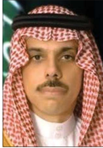
وزير الخارجية السعودي صاحب السمو الأمير فيصل بن فرحان

التي استهدفت دولة الكويت مؤخرًا، حيث أكد الجانبان حق دولة الكويت الكامل في اتخاذ جميع الإجراءات اللازمة لصون سيادتها والحفاظ على أمنها واستقرارها وحماية شعبها والمقيمين على أراضيها. كما تم خلال الاتصال مناقشة تطورات الأحداث الراهنة في المنطقة والجهود المبذولة بشأنها.