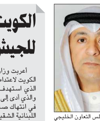
الأمين العام لمجلس التعاون الخليجي جاسم البديوي

وفي الدوحة، دانّت دولة قطر بشدة الهجمات الإيرانية المتكررة على دولة الكويت الشقيقة ومملكة البحرين باستهدافها انتهاكاً صارخاً لسيادة البلدين وخرقا