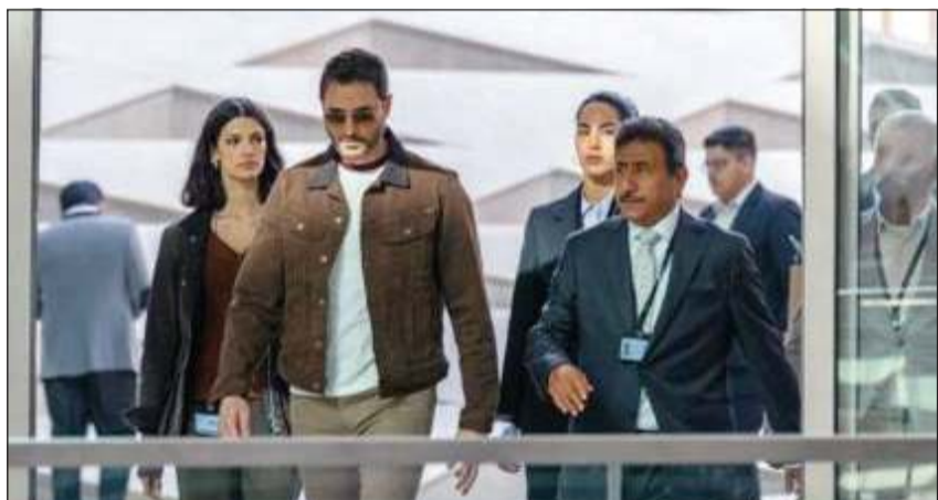
ناصر القصبي في مشهد من الفيلم

كبيرة وعض نسيبا بعض أوجه الصور الفنية. أما على مستوى الأداء التمثيلي فضاء أداء كريم عبدالعزیز وأحمد عز في الحدود المتوسعة، مع وضوح حرص المخرجين على تحقيق توازن كامل بينهما في مساحة الظهور على الشاشة، حتى إن معظم المشاهد جمعتها معا وصولا إلى النهاية. وفي المقابل، لم يكن ظهور النجم السعودي ناصر القصبي، رغم أهميته، بحجم قيمته الفنية الكبيرة، حيث يأتي حضوره محدودا وغير مؤثر بالشكل المتوقع، والأمير نفسه الذي ينطبق على الفنان المصري سيد رجب، إذ لم تنجح الشخصيتان في إقناع المشاهد بصفتهما قيادات أمنية ذات تأثير حقيقي في مجرى الأحداث. كما لم تقدم كل من المصرية تارا عماد واللبنانية ساندرا بيلاد الأداء المنتظر، خصوصا في مشاهد الأكشن التي بدت أقل إقناعا مقارنة ببقية عناصر العمل. في المحصلة، يبقى «7dogs» فيلما موجها بالدرجة الأولى لعشاق الأكشن والمطاردات والإثارة، وتجربة عربية لافتة من ناحية الإنتاج والتنفيذ التقني، لكنها في المقابل تعاني من ضعف واضح على مستوى السيناريو وبناء الشخصيات، ليخرج المشاهد مستمعا بالمغامرات والمشاهد الحركية، دون أن يتوقف كثيرا أمام منطق الأحداث أو عمق الحكاية.