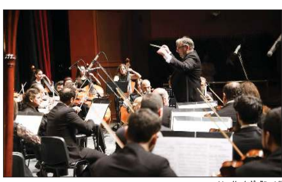
الفرقة أثناء الحفل

سورية ممزوجة بروح التجديد، وهذا ما أظهرته الفرقة السيمفونية الوطنية على مسرح الأوبرا بدمشق، بالإضافة لما قدمته الفرقة من مجموعة من المقطوعات الإيطالية الشهيرة، منها افتتاحية «أوبرا حلاق إسبيلية» لجواكينو روسيني بمشاركة بيزراتي في عزف مقطوع «فيغارو»، وأغننية «لاورينا» من أوبرا جاني سبكي لجاكومو بوتشيني، إضافة إلى مقطوع من «أوبرا توراندو». واختتمت الأمسية بلوحة من الرقصات السيمفونية العربية للموسيقار السوري الراحل نسوري الرحبان، تضمنت أغنيتي «طالعة من بيت أبوها»، و«بنت الشلمية»، في مزج فني جمع بين التراث السوري والألحان الإيطالية.