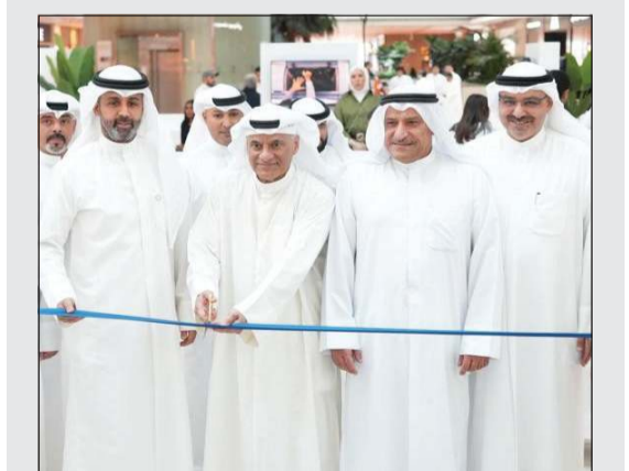
وزير التعليم العالي والبحث العلمي د. نادر الجلال وخالد الشعلان أثناء قص شريط افتتاح حملة «وجهني»

بيت التمويل الكويتي يعزز دعمه للطلبة ويمكّنهم أكاديمياً عبر حملة «وجهني» للابتعاث الخارجي