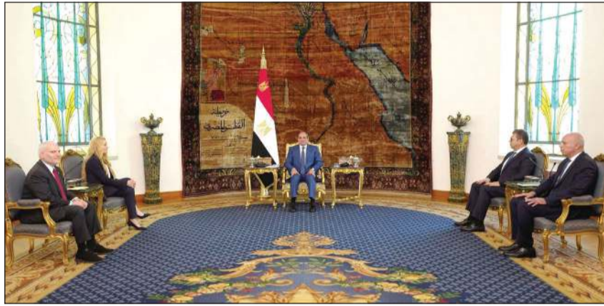
الرئيس عبدالفتاح السيسي مستقبلا وفدا من مؤتمر رؤساء المنظمات اليهودية الأميركية الكبرى