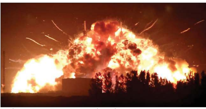
لحظة انفجار الصاروخ «نيو غلين» التابع لـ «بلو أوريفين» أثناء الاختبار التجريبي للمحرك

لوس أنجليس - شينخوا: قال مدير وكالة الفضاء الأميركية «ناسا» جاريث إسحاقمان، إن منصة الإطلاق التي تضررت جراء انفجار الصاروخ «نيو غلين» التابع لشركة «بلو أوريفين» أثناء الاختبار التجريبي للمحرك، قد لا يتم ترميمها قبل عام 2028. ووقع الانفجار حوالي الساعة التاسعة مساءً بالتوقيت الشرقي (01:00 بتوقيت غرينتش يوم الجمعة الماضي) في مجمع الإطلاق بقاعدة كيب كانافيرال الفضائية في فلوريدا، وهي المنشأة الوحيدة القادرة حالياً على دعم صاروخ «نيو غلين».