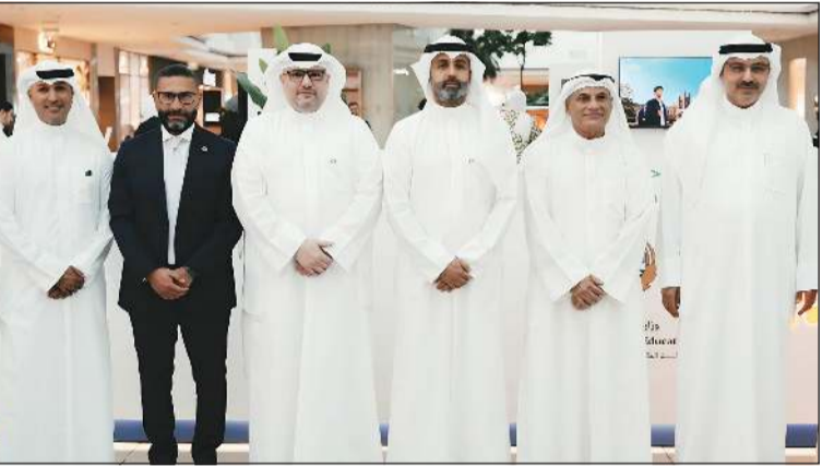
وزير التعليم العالي والبحث العلمي د.نادر الجلال ووكيل الوزارة د.بدر البصيري وقيادات بيت التمويل الكويتي

بين القطاعين الحكومي والخاص، بما يسهم في تحقيق الأثر الإيجابي المنشود على صعيد تنمية رأس المال البشري. وشدد على حرص بيت التمويل الكويتي على تقديم الدعم الفاعل لكافة المبادرات والأنشطة التي تطلقها مؤسسات التعليم العالي في الكويت، بما في ذلك جامعة الكويت، والجامعات الخاصة، والهيئة العامة للتعليم التطبيقي والتدريب، إلى جانب المكاتب الثقافية الكويتية في الخارج، دعماً لمسيره التعليم وتعزيزاً لفرص الطلبة في تحقيق طموحاتهم.