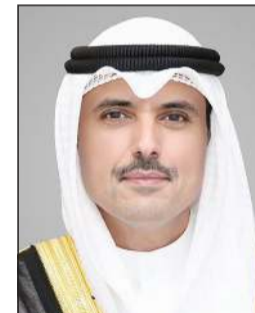
محافظ الاحمدي الشيخ حمود الجابر