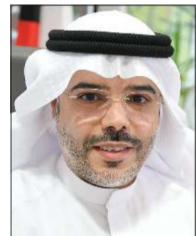
د. خالد العجمي

سجلا حافلا بالعطاء والعمل الدبلوماسي والسياسي، انعكس على حضوره في دعم مسيرة الدولة وتعزيز مكانة الكويت، إلى جانب حرصه على ترسيخ الوحدة الوطنية ودعم مؤسسات الدولة. وأكد أن ما تشهده الكويت من تطور وحراك تنموي يعكس الرؤية الحكيمة للقيادة وإيمانها بالاستثمار في الإنسان وتعزيز كفاءة المؤسسات، مبينا أن منتسبي وزارة