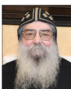
القمص يجول الأنا بيشوي

من عطاء مخلص في مواقع المسؤولية المختلفة، وبما عرف عنه من حكمة واتزان وخبرة سياسية وديبلوماسية رصينة. وأضاف أن سمو ولي العهد يجسد نموذجاً لرجل الدولة الذي جمع بين هدوء الأداء وعمق الرؤية، وبين الفؤاد والمسؤولية والحرص على المصلحة الوطنية، مشيراً إلى أن مسيرته تعكس جانباً مهماً من مدرسة كويتية أصيلة في العمل العام، قوامها الاعتدال، والحكمة، وخدمة الوطن بإخلاص. وأكد القمص يجول أن دولة الكويت، بقيادة صاحب السمو الأمير الشيخ مشعل الأحمد، وبمساندة سمو ولي العهد، تضي بذبات في ترسيخ دعائم