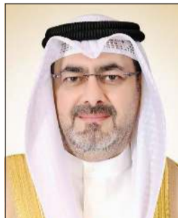
محافظ العاصمة الشيخ عبدالله السالم