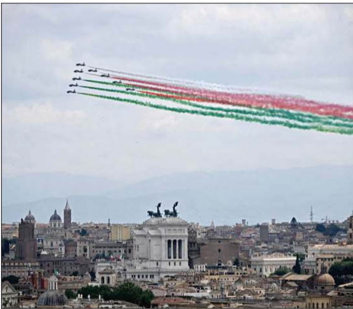
مقالات تطلق دخاناً باللون علم إيطاليا خلال احتفالات الجمهورية الـ 80

(وكالات): احتفلت إيطاليا بالذكرى الـ 80 لتأسيس الجمهورية بعرض عسكري وسط روما أمس. ووضع الرئيس سيرجيو ماتاريللا إكليلاً من الزهور عند نصب تذكاري في ميدان فينيسيا، في الوقت الذي رسمت فيه الطائرات العلم الإيطالي بألوانه الأخضر والأبيض والأحمر. وأطلقت وحدة الاستعراض الجوي التابعة للقوات الجوية الإيطالية «فريتشي تريكولوري» (السهم ثلاثية الألوان) دخاناً باللون العلم الإيطالي خلال استعراض جوي كجزء من الاحتفالات. يذكر أنه في استفتاء أجري في الثاني من يونيو 1946 اختار المواطنون الإيطاليون إلغاء الملكية وإقامة الجمهورية. وكان الاستفتاء أول انتخابات حرة بعد حكم بينيتو موسوليني الذي بدأ عام 1922 وانتهى عام 1945. كما كانت تلك المرة الأولى التي يسمح فيها للنساء بالتصويت. وقد حضرت رئيسة الوزراء جورجيا ميلوني وأعضاء من مجلس الوزراء هذه الفعاليات.