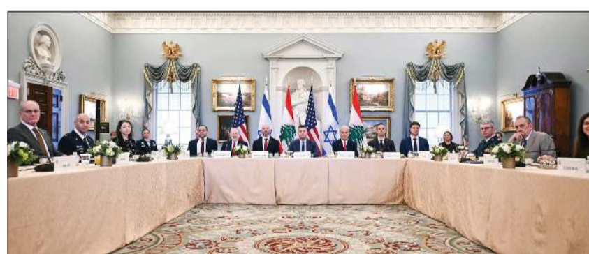
الوفدان اللبناني والإسرائيلي يعقدان جلسة مفاوضات مباشرة جديدة في وزارة الخارجية بواشنطن العاصمة

بين الإعلان عن وقف لإطلاق النار الذي صدر عن الرئيس الأميركي دونالد ترامب، واستئناف المفاوضات بين الوفدين اللبناني والإسرائيلي في مقر وزارة الخارجية الأميركية في واشنطن، بات الوضع في بيروت في هدأة بردت نسبياً الخوف مما لا يريده اللبنانيون من حرب تتوهم. والحالة في العاصمة اللبنانية التي تغص بالوان النزوح تعكس أملاً مرتجياً يخفف من حدة الخوف، وما يعزز ذلك استمرار المساعي التي برز في أهمها تأكيد رئيس الجمهورية العماد جوزف عون لوفد نقيب المهن الحرة الحرس «على السلم والاستقرار الداخلي في لبنان، ومنع الفتنة التي من شأنها أن تهدد بقاء لبنان لأن كل من يغذيها يقدم خدمة لإسرائيل». وأضاف عون أن «السلم الأهلي لا يمكن المساس به لأن اللبنانيين باتوا على اقتناع تام بأنه لا عودة إلى الوراء، كما أن الطبقة السياسية تعمل أيضاً على إبعاد هذه المشكلة وتأثيرها الكارثي، عبر خطاب واضح ومحدد». وشدد الرئيس اللبناني على أن العمود الفقري والأساس لبنع الفتنة هو الجيش والأجهزة الأمنية الذين يعرضون في بعض الأحيان للانتقاد والتهم فيما يواصلون تقديم أعلى درجات التضحيات والشهداء على مذبح الوطن، ويقومون بواجبهم على أكمل وجه على