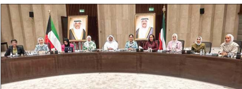
الأمين العام للمجلس الأعلى للتخطيط والتنمية بالتكليف م. أحمد الجناحي خلال ترؤسه الاجتماع بحضور الشخبة انتصار سالم العلي

تطوير السياسات والتشريعات لضمان دعم مكانة الكويت بالمؤشرات والتقارير الدولية