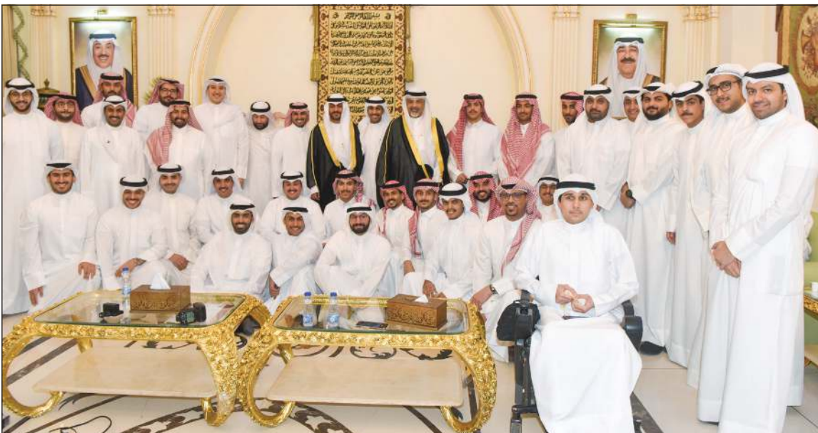
لقطة جماعية للمعرس ووالده مع الأصدقاء