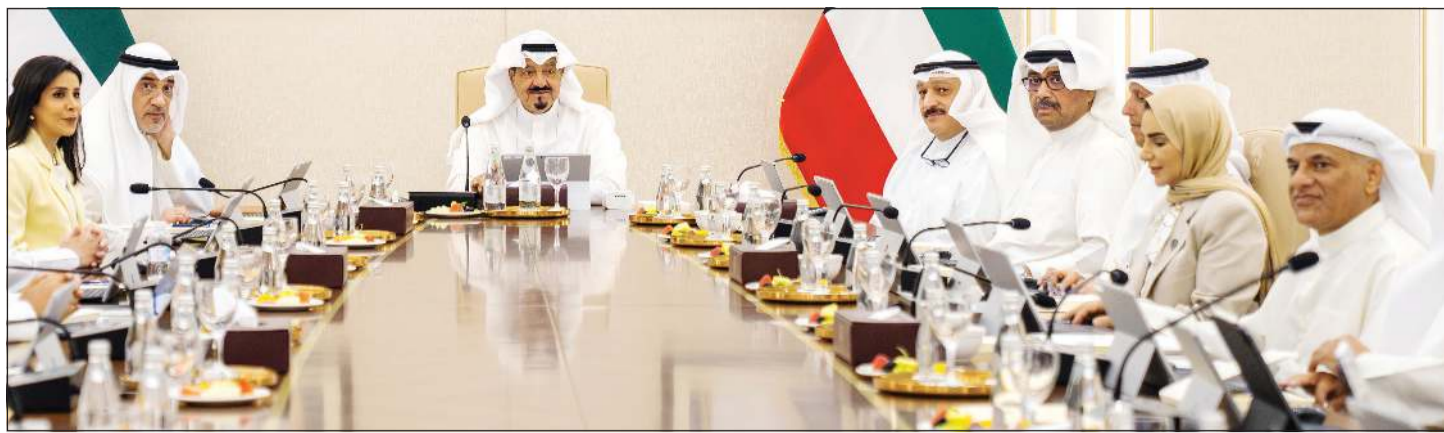
رئيس الوزراء سمو الشيخ احمد العبدالله مترشفا جلسة مجلس الوزراء

مجلس الوزراء هنأ سمو ولي العهد بمناسبة الذكرى الثانية لولاية العهد: وفقه الله وسدد خطاه وجعله ذخراً وعضداً وسنداً لصاحب السمو