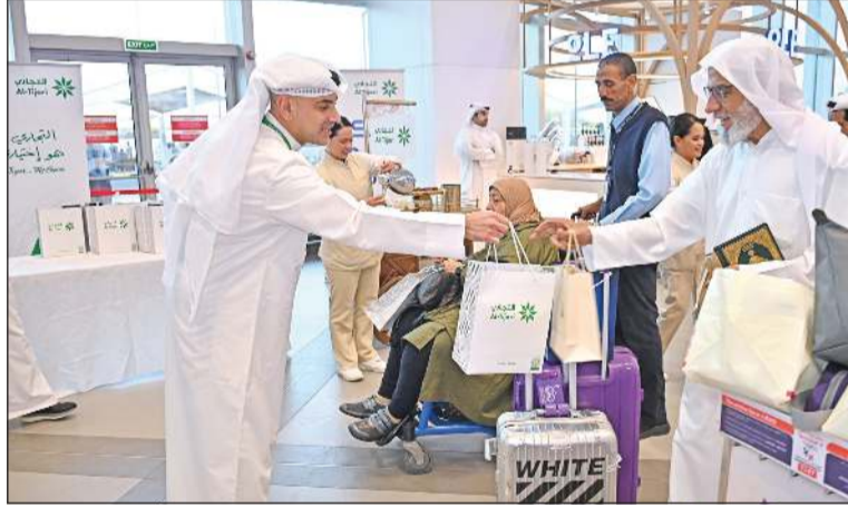
جانب من استقبال الحجاج وتقديم الهدايا التذكارية

إلى الهيئة العامة للطيران المدني وجميع القائمين على خدمة الحجاج في مطار الكويت الدولي، متمنية أن يتقبل الله من حجاج جههم وطاعاتهم، وأن يعيد هذه المناسبة المباركة على الكويت وأهلها بالخير واليمن والبركات.