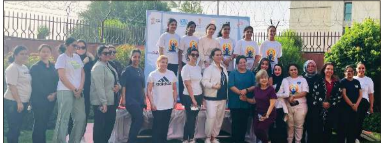
سفيرة الهند لدى الكويت باراميتا تريباتي متوسطة المشاركين في الفعالية

اليوم الدولي لليوغا في الكويت يوم 29 مايو الماضي من خلال فعالية صحية مخصصة للسيدات أقيمت في مقر «بيت الهند»، بحضور سفيرة الهند لدى الكويت باراميتا تريباتي، والشيخة شيخة الصباح، الحائزة جائزة «بادما شري» ومؤسسة «دار آتما» ورئيسة لجنة اليوغا الكويتية، إلى جانب عدد من أعضاء السلك الدبلوماسي وشخصيات من المجتمع الكويتي. وأكدت السفارة أن احتفالات هذا العام تتضمن برنامجاً متنوعاً من الأنشطة والفعاليات التي تهدف إلى نشر ثقافة اليوغا وإبراز فوائدها الصحية، مع الحرص على إشراك مختلف شرائح المجتمع في هذه