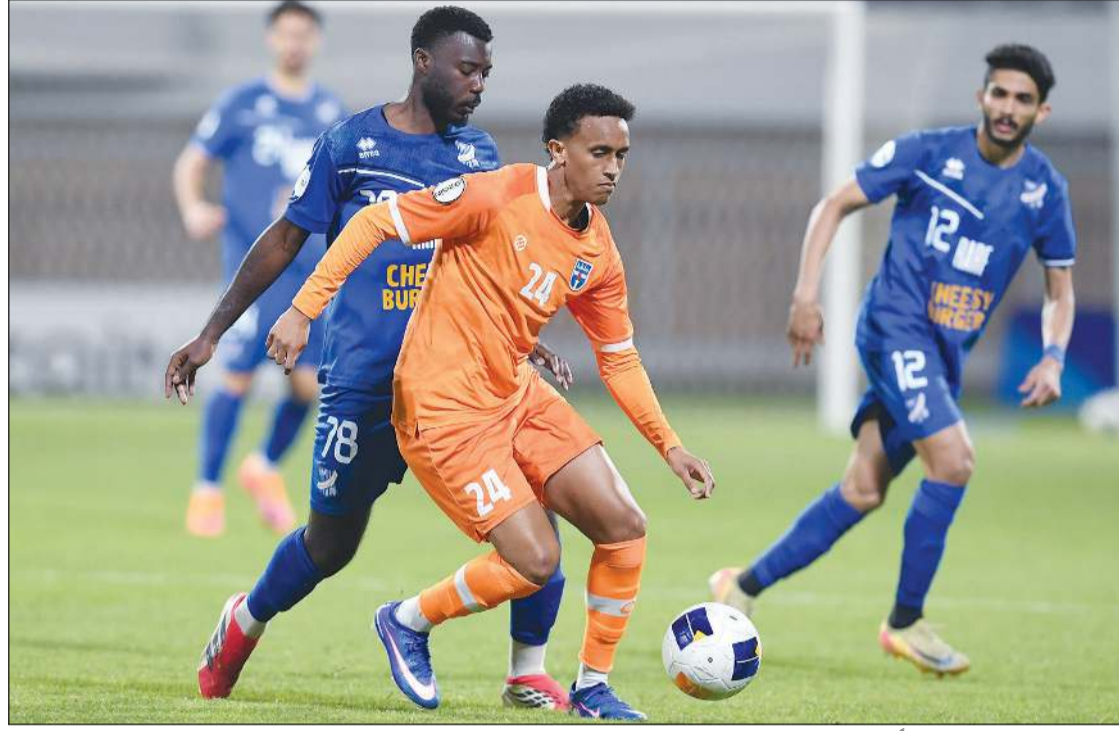
كأظمة والتضامن يلتقيان ودية السبت المقبل

وسيستكمل دوري زين الممتاز للموسم الحالي بعد فترة التوقف الدولي الحالية نظراً لخوض الأزرق ودية تايلند الجمعة المقبل في بانكوك، وستلعب الجولة الـ 18 الأخيرة 11 الشهر الجاري، على أن يقام بعدها مباشرة دوري مجموعة البطولة والهبوط، على أن يختتم الموسم 29 الجاري. ويأتي استئناف النشاط لتحديد المشاركات الخارجية