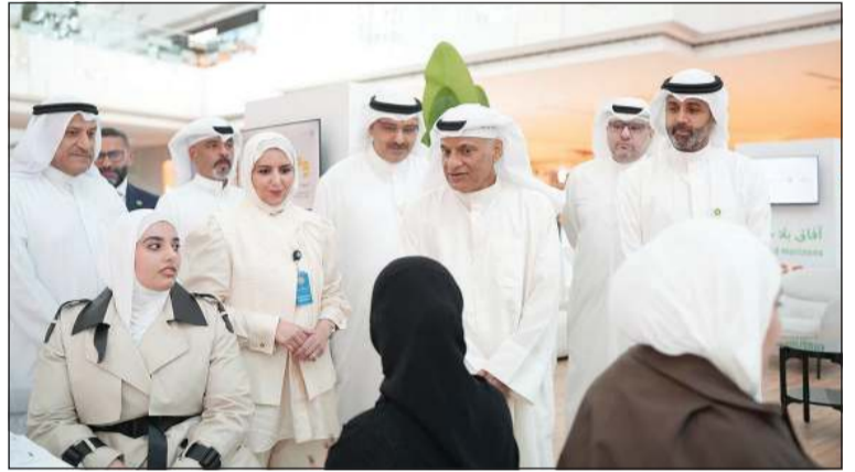
وزير التعليم العالي والبحث العلمي د.نادر الجلال خلال جولة في جناح حملة «وجهني»