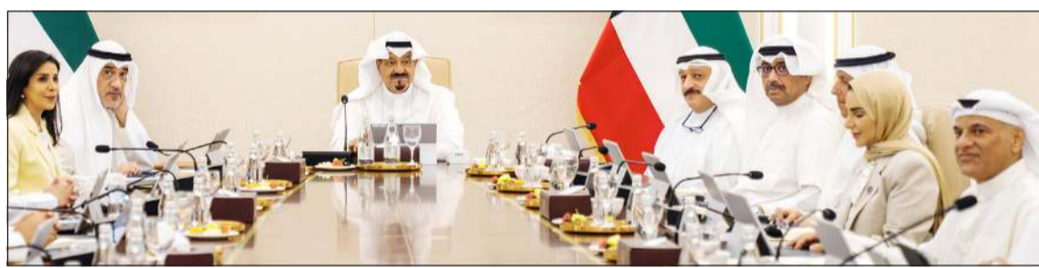
رئيس الوزراء سمو الشيخ أحمد عبدالله مترشحاً لجلسة المجلس أمس

مشروع مرسوم بقانون رقم 97 لسنة 2015 بشأن إنشاء الهيئة العامة للرياضة، حيث يستبدل مسمى الهيئة العامة للشباب والرياضة أيضاً وردت في القوانين واللوائح، كما وافق المجلس على مشروع مرسوم بقانون لتعديل بعض أحكام المرسوم بالقانون رقم 6 لسنة 1980 لإنشاء مؤسسة البترول الكويتية، بهدف تمكين المؤسسة من تعظيم الإيرادات النفطية والحفاظ على مكانتها الرائدة إقليمياً وعالمياً، واطلع