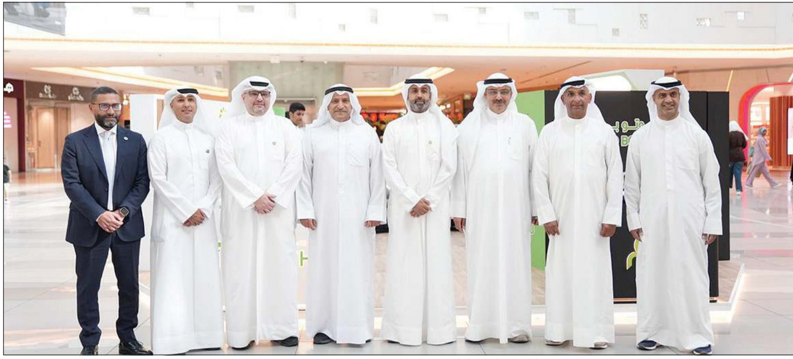
خالد الشمالان ووكيل وزارة التعليم العالي د.بدر البصيري مع مسؤولي وزارة التعليم العالي وبيت التمويل