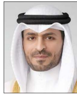
محافظ مبارك الكبير وحولي بالتكليف الشيخ صباح بدر السالم