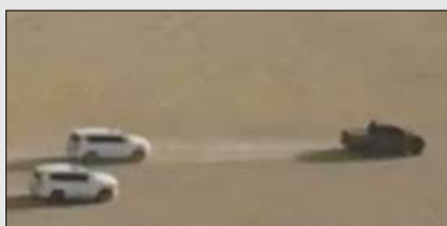
جناح الطيران التابع للشرطة تابع تحركات الهاربين

عثر بحوزتهم على سلاحين وتم توقيفهم عقب تحريات دقيقة