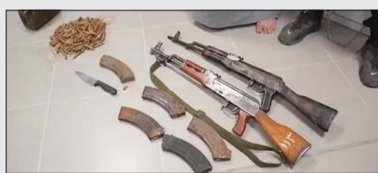
الأسلحة والذخيرة المضبوطة بحوزة الهاربين الثلاثة