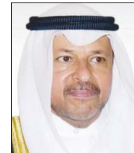
محافظ الفروانية الشيخ عذبي الناصر