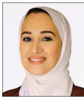
مدير عام الهيئة العامة لشؤون القصر بالتكليف علياء الصقر

ترسيخ دعائم الاستقرار والتطور وتعزيز مسيرة الإنجاز والتنمية في ظل القيادة الحكيمة لصاحب السمو الأمير الشيخ مشعل الأحمد. وأضافت أن سمو ولي العهد يتمتع بالقيادة والديبلوماسية العالية التي تدعم موقف دولة الكويت وتوجهاتها في كل الميادين وتعزز من