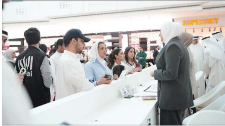
إقبال الطلبة على جناح حملة وجهني