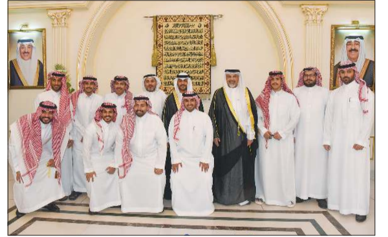
أصدقاء المعرس من المملكة العربية السعودية بياركان