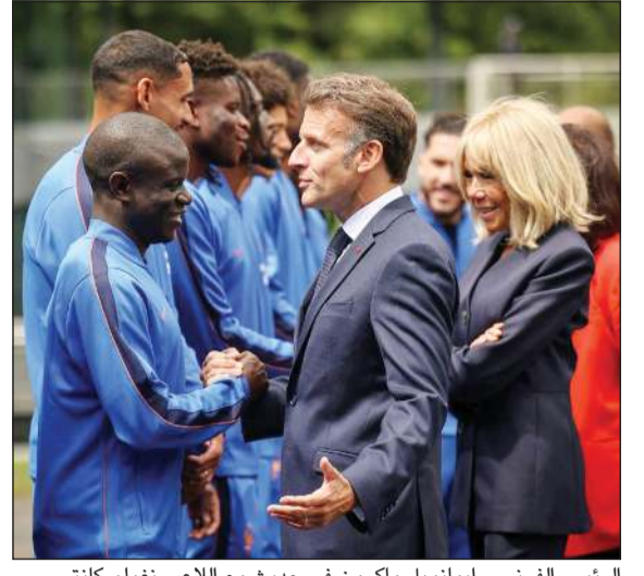
الرئيس الفرنسي إيمانويل ماكرون في حديث مع اللاعب نغولو كانتي

بإستعادة اللقب العالمي وإضافة إنجاز جديد إلى سجل «الديوك».