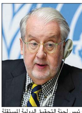
رئيس لجنة التحقيق الدولية المستقلة بشأن سورية بولولو سيرجيو بينهيرو

وكالات: أعلن رئيس لجنة التحقيق الدولية المستقلة بشأن سورية بولولو سيرجيو بينهيرو انتهاء ولايته بالانحسار بعد 15 عاماً، «لأسباب صحية» وقال بينهيرو في منشور على منصة «إكس» أمس الأول: «لقد كان شرفاً لي أن أقف إلى جانب الشعب السوري، وأن أرفع أصواتهم، وأن ألفت الانتباه إلى الانتهاكات المنهجية لحقوق الإنسان والقانون الإنساني التي ارتكبتها جميع الأطراف خلال هذه الفترة». وأضاف بينهيرو: إنه تم اعتقال مئات الآلاف من الأشخاص تعسفاً، واختفوا قسراً، وتعرضوا للنزوح أو القتل في سورية منذ عام 2011، لافتاً إلى أنه تم توثيق كل فئسة تقريبا من