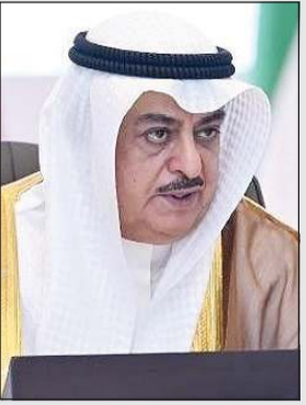
النائب العام المستشار سعد الصفران