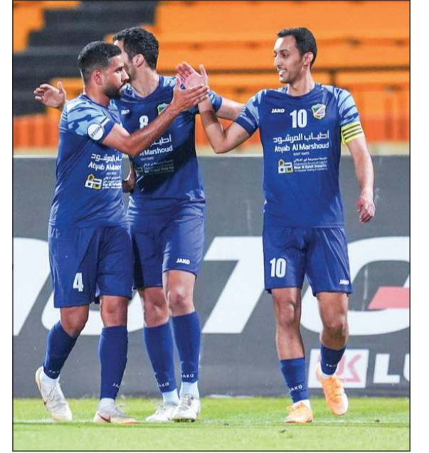
السالمية يسعى لتقديم صورة مغايرة في الفترة المقبلة

يدل على ثقتهم الكبيرة بي وأتمنى أن «نبيض الوجه» خلال فترة الموسمين ونقدم أفضل ما يمكن». وزاد قائلاً: «وجدت الكثير من التوافق بيني وبين مجلس إدارة السالمية خلال الفترة الماضية حول الآراء الفنية والأهداف المشتركة وشعرت براحة كبيرة في العمل داخل النادي، وأتمنى أن تنافس على جميع الألقاب الممكنة سواء المحلية أو الخارجية».