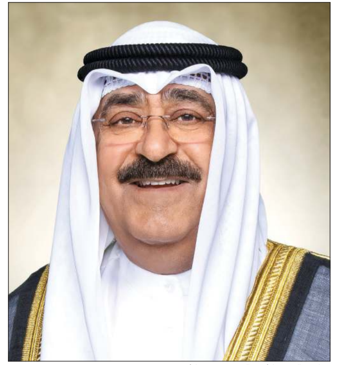
صاحب السمو الأمير مشعل الأحمد

كونا: بعث صاحب السمو الأمير مشعل الأحمد ببرقية تهنئة إلى الرئيس سيرجيو ماتاريلا رئيس الجمهورية الإيطالية الصديقة، عبر فيها سموه عن خالص تهنائه بمناسبة ذكرى يوم الجمهورية لبلاده، متمنيا سموه له موفور الصحة والعافية وللجمهورية الإيطالية وشعبها الصديق كل التقدم والأزدهار.