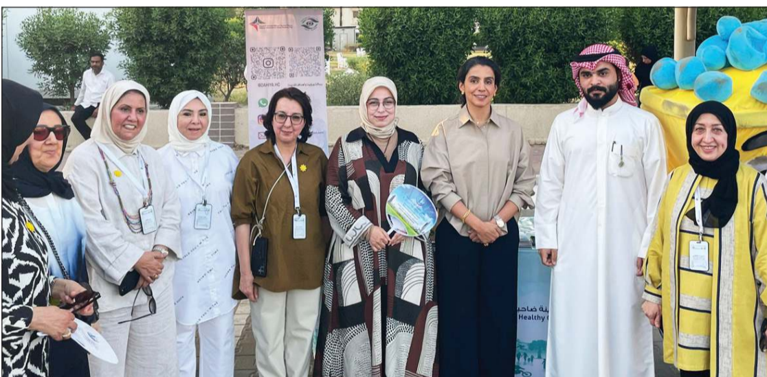
السفيرة التركية طوبى نور سونمز وعالية الخالد والمشاركون في فعالية إعادة تدوير النفايات

تبنت الممارسات المتوافقة مع مفهوم «صفر نفايات»، وتواصل أداء دورها بمسؤولية مؤسسية تجاه حماية البيئة وتعزيز مفاهيم الاستدامة.