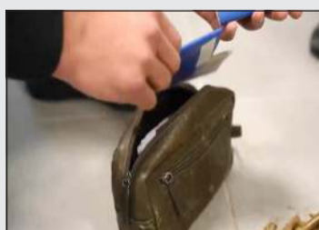
جوازات سفر ضبطت في حقيبة خاصة مع الهاربين

من يحاول مخالفة القانون أو الإخلال بالأمن والنظام العام، مؤكدة أن أمن المجتمع خط أحمر، وأن يد العدالة ستطول كل من يحاول الهروب من المساءلة القانونية، أو تقديم العون للمطلوبين والخارجين على القانون.