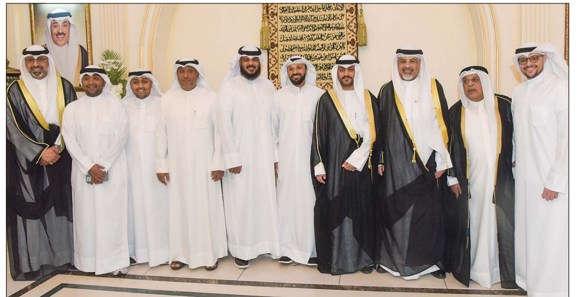
أهل العروس يهنئون بالمناسبة السعيدة