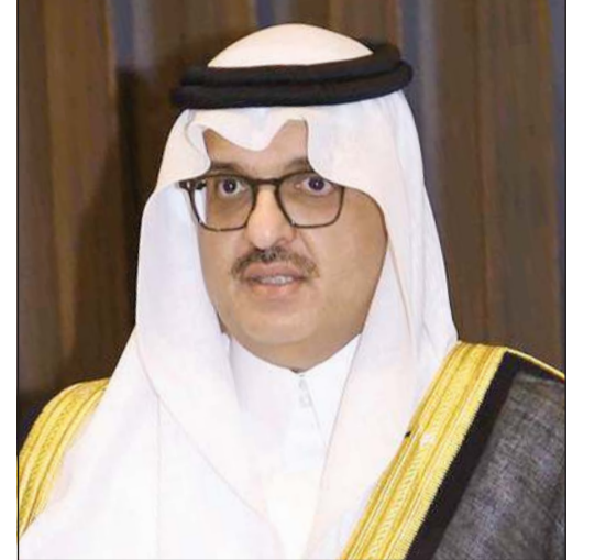
سفير خادم الحرمين الشريفين سمو الأمير سلطان بن سعد

قال سفير خادم الحرمين الشريفين لدى البلاد سمو الأمير سلطان بن سعد إن الذكرى الثانية لتولي سمو الشيخ صباح الخالد ولاية العهد تمثل مناسبة وطنية عزيزة أتقدم فيها إلى سموه بأصدق التهاني وأطيب التبريكات، داعيا المولى عز وجل أن يوفقه ويسدد خطاه، وأن يجعله خير سند وعضد لصاحب السمو الأمير الشيخ مشعل الأحمد في قيادة مسيرة الخير والتنمية والازدهار. وأكد السفير السعودي أن العلاقات الأخوية الراسخة بين المملكة العربية السعودية ودولة الكويت تمثل نموذجا استثنائيا يحتذى في التلاحم والتعاون والتنسيق المشترك، مستندة إلى روابط تاريخية متينة من المحبة والمودة والأخوة الصادقة عززتها حكمة قيادتي البلدين الشقيقين وعمق الروابط بين الشعبين. وأضاف أن المملكة تتطلع دائما إلى مواصلة ترسيخ هذه العلاقة المتميزة التي تستمد قوتها من عبق الماضي وروح الحاضر وآفاق المستقبل المشرق، بما يخدم المصالح المشتركة ويعزز أمن واستقرار وازدهار البلدين والشعبين الشقيقين.