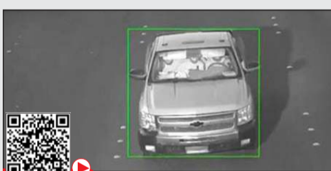
كاميرات المراقبة وثقت تنقلات الهاربين

علمت «الأنباء» أن ديوان الخدمة المدنية يستعد لإبلاغ المواطنين المسجلين في المرحلة الـ 94 للتوظيف الحكومي، والذين سجلوا خلال الفترة من 1 حتى 15 مايو، بأولوية ترشيحهم. وقالت مصادر لـ «الأنباء» إن دفعة التوظيف الجديدة التي يتم إعدادها حالياً بالتنسيق مع الاحتياجات الوظيفية للجهات الحكومية ستشتمل فئة المؤهلين لأول مرة الذين لم يسبق ترشيحهم من قبل. وردا على سؤال حول توقيت ترشيح المواطنين الراضين لترشيحاتهم السابقة، أجابت المصادر: «الأولوية في هذه الدفعة ستكون لترشيح الخريجين الجدد، على أن يتم ترشيح الراضين لاحقاً في التخصصات التي تتوافر لها شواغر وظيفية»، كاشفة في الوقت ذاته عن أن الديوان يواصل جهوده لإعلان ترشيح الراضين في دفعة تالية قريباً.