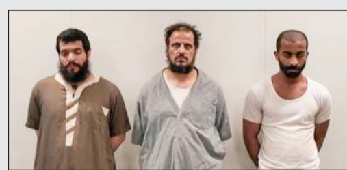
النزلاء الهاربون في قبضة «الداخلية»

«الداخلية» أكدت أن أمن المجتمع «خط أحمر» ويد العدالة ستطول الخارجين على القانون