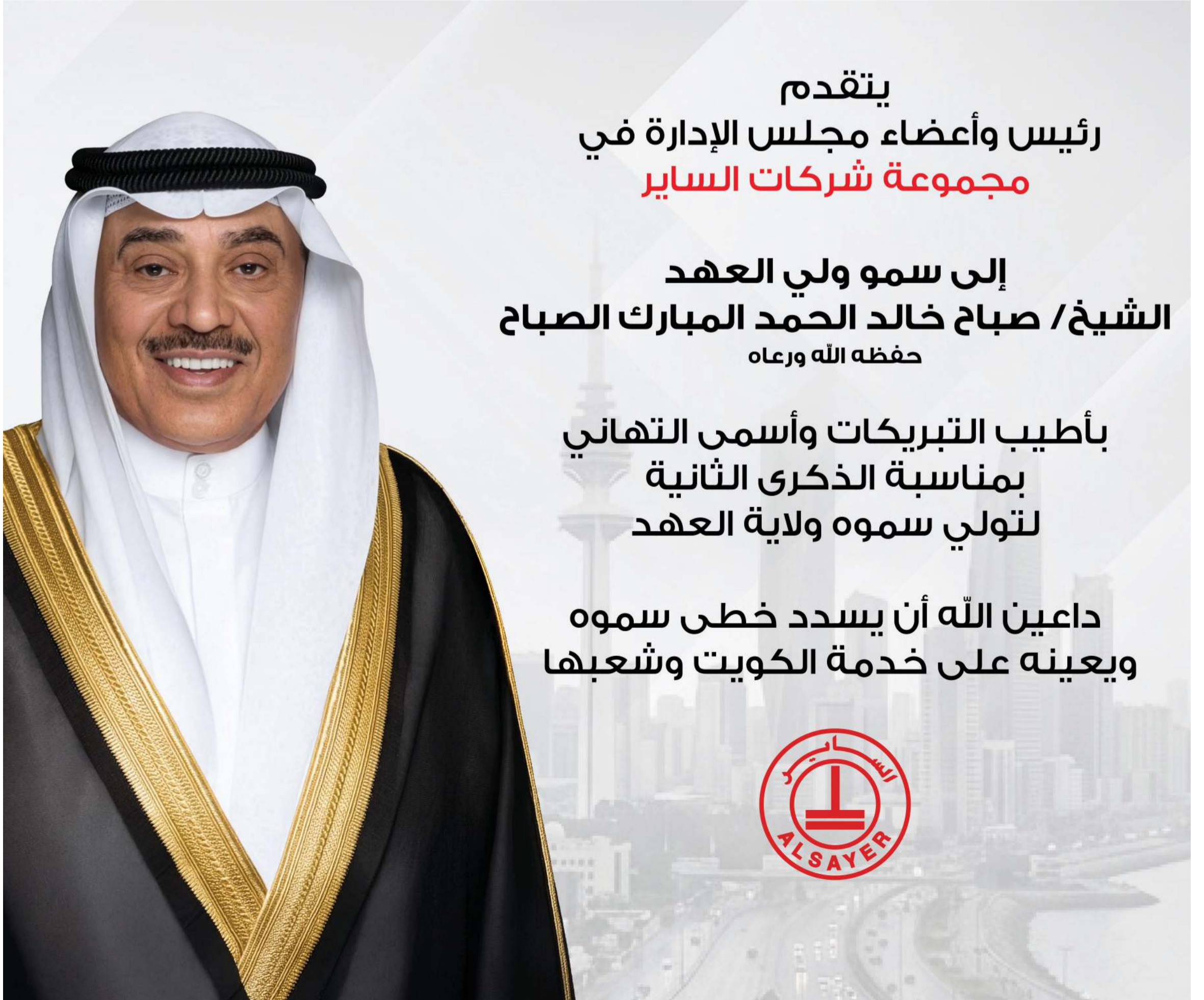
الفريق متقاعد ثابت المهنا

رفع محافظ العاصمة السابق الفريق متقاعد ثابت المهنا أسمى آيات التهنية والتبريكات إلى سمو ولي العهد الشيخ صباح الخالد بمناسبة مرور عامين على تولى سموه ولاية العهد. وأكد الفريق المهنا أن هذه المناسبة الوطنية تجسد مرحلة مهمة من مسيرة الاستقرار والتنمية التي تشهدها الكويت. وأشار إلى أن سمو ولي العهد يتمتع بخبرة سياسية وحكمة كبيرة أسهمت في