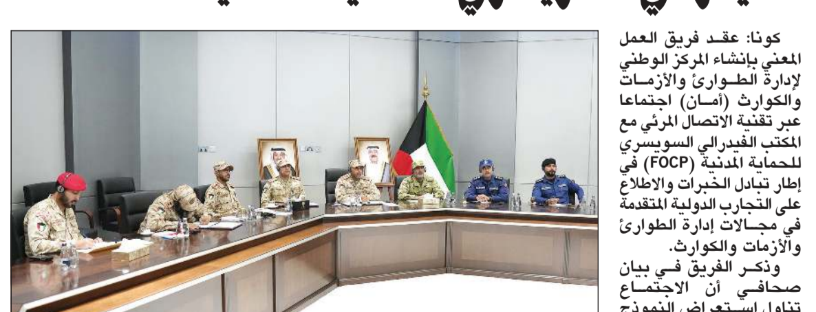
جانب من اجتماع فريق «أمان» مع المكتب الفيدرالي السويسري للحماية المدنية