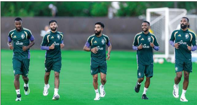
جانب من تدريبات المنتخب السعودي في أوستن