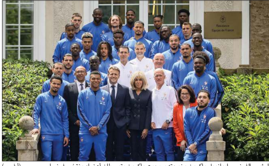
الرئيس الفرنسي إيمانويل ماكرون وزوجته بريجيت ماكرون يتوسطان أعضاء منتخب فرنسا