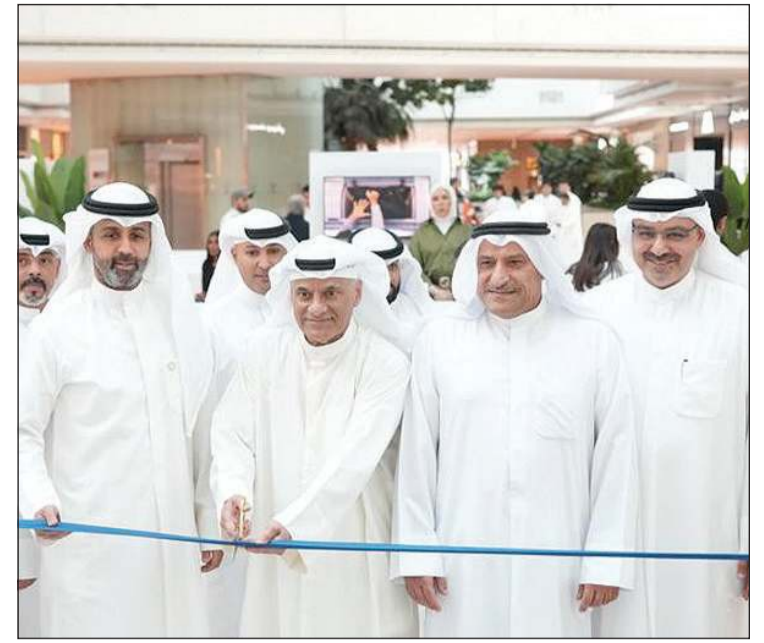
وزير التعليم العالي والبحث العلمي د.نادر الجلال وخالد الشمالان والأمين العام للجهاز الوطني للاعتماد الأكاديمي وضمان جودة التعليم بالتكليف د.جاسم العلي ووكيل وزارة التعليم العالي د.بدر البصيري أثناء قص شريط افتتاح حملة «وجهني»