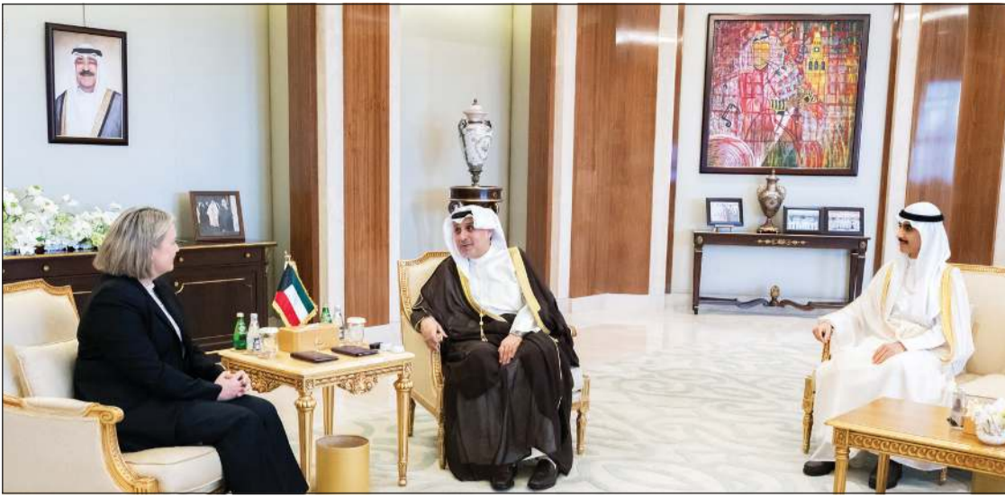
وزير شؤون الديوان الأميري حمد جابر العلي ورئيس ديوان سمو ولي العهد الشيخ نائم الجابر خلال استقبالهما سفيرة أستراليا لدى الكويت ميليسا كيلي

بمناسبة انتهاء فترة مهام عملها سفيرة لبلادها