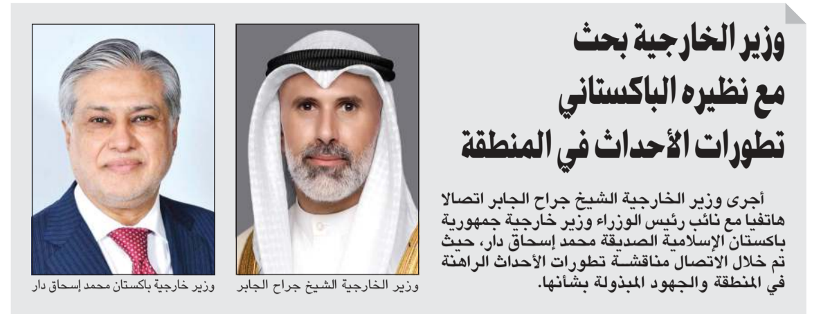
وزير الخارجية الشيخ جراح الجابر ووزير خارجية باكستان محمد إسحاق دار

كونا: استضافت وزارة الخارجية، ممثلة بإدارة شؤون حقوق الإنسان، اجتماعاً تنسيقياً مشتركاً مع الأمانة العامة للمجلس الأعلى للتخطيط والتنمية، ممثلة بلجنة المرأة والأعمال مع الخبراء من مجموعة البنك الدولي، لبحث مستجدات ملف تقرير دولة الكويت في مؤشر المرأة وأنشطة الأعمال الصادر عن البنك الدولي. وقالت «الخارجية» في بيان صحفي أمس الثلاثاء إن الاجتماع الذي عقد عبر تقنية الاتصال المرئي والمسموع برئاسة الأمين العام للمجلس الأعلى للتخطيط والتنمية بالتكليف م. أحمد الجناحي ومشاركة أعضاء لجنة المرأة والأعمال استهدف بحث ومناقشة آخر مستجدات ملف مؤشر المرأة وأنشطة