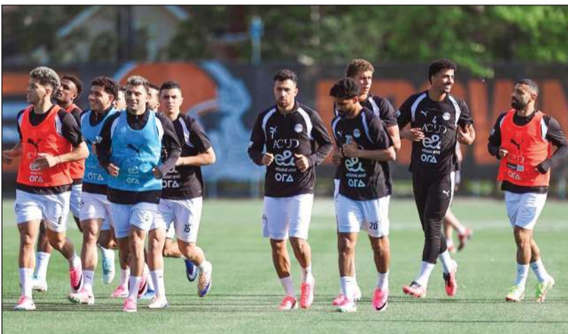
جانب من تدريبات المنتخب المصري استعدادا لودية البرازيل

الأمم الأفريقية، وذلك بعد التتويج بالميدالية البرونزية، عقب الفوز على المنتخب المغربي صاحب الأرض 0-2 في مباراة تحديد المركز الثالث.