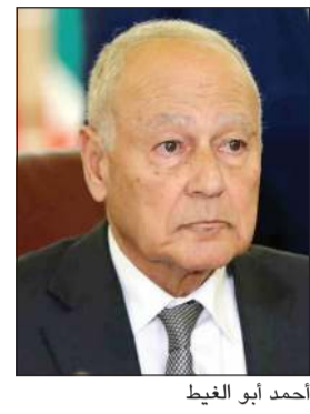
أحمد أبو الغيث

وجددت الوزارة تضامنها مع دولة الكويت وللحفاظ على سيادتها وأمنها.