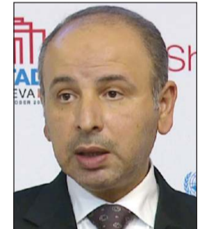
السفير ناصر الهين

أمن واستقراره وللقانون الدولي وميثاق الأمم المتحدة. وأكد «الخارجية» في بيان أمس موقف الكويت الثابت والداعم لوحدة لبنان وسيادته وسلامة أراضيها، داعية إلى الوقف الفوري لهذا التصعيد وانسحاب قوات الاحتلال الإسرائيلي من الأراضي اللبنانية والالتزام الكامل