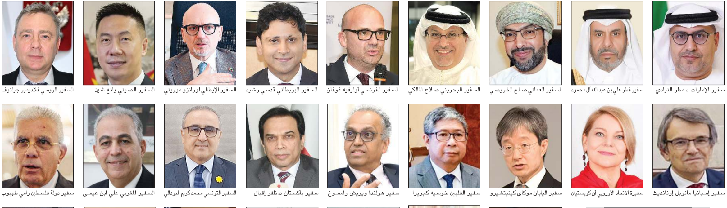
أسامة دياب رفع عدد من السفراء ورؤساء البعثات الدبلوماسية المعتمدين لدى الأمير أسامة آيات التهامي والتبريكات إلى سمو ولي العهد الشيخ صباح الخالد. بمناسبة الذكرى السنوية الثانية لتولي سموه ولاية العهد. مؤكداً تقديره لجهود سموه في تعزيز مسيرة التنمية في مختلف المجالات وترسيخ مكانة الكويت على المستوى الإقليمي والدولي، متمنياً لسموه دوام الصحة والعافية، وللكويت وشعبها المزيد من الأمن والاستقرار والرخاء. ولفت السفراء إلى أن سمو ولي العهد يعتبر خير سند وعضيد لصاحب السمو الأمير الشيخ مشعل الأحمد، في مواصلة قيادة مسيرة الإنجازات والتنمية وترسيخ دعائه للأمن والاستقرار. مشيداً بما يتمتع به سموه من خبرات سياسية ودبلوماسية وعلاقات دولية إيجابية.

كفاءة وخبرة طويلة ومسيرة حافلة بالإنجازات الوطنية والدبلوماسية، والتي أسهمت في ترسيخ حضور الكويت على الساحة الدولية.